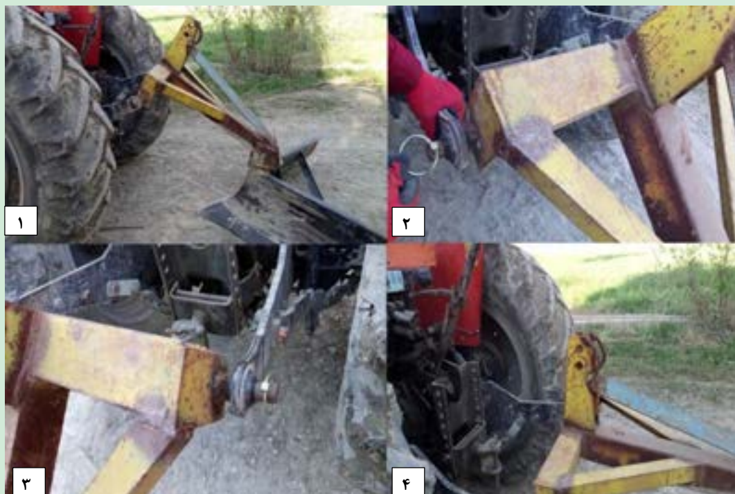
شکل ۲۲- روش اتصال نهركن به تراكتور

جهت اتصال نهركن به تراكتور با حداقل سرعت با دنده عقب تراكتور را به نهركن نزدیک کرده ابتدا بازوی سمت چپ، سپس بازوی سمت راست را متصل کنید.