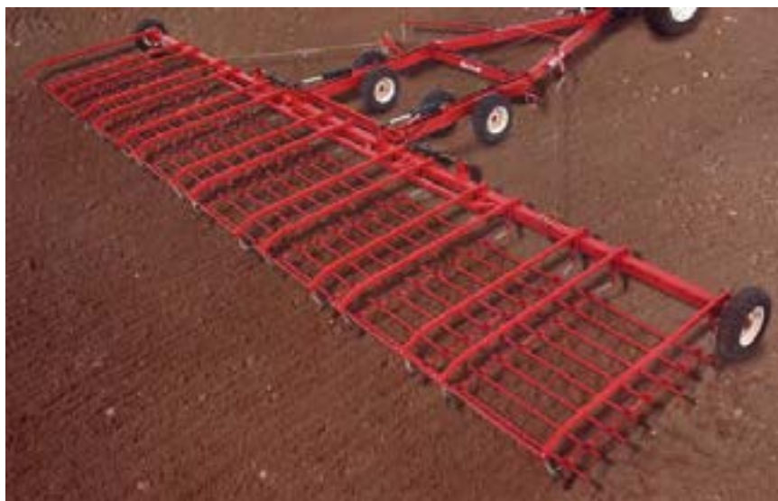
شکل ۶- هرس دندانه میخی