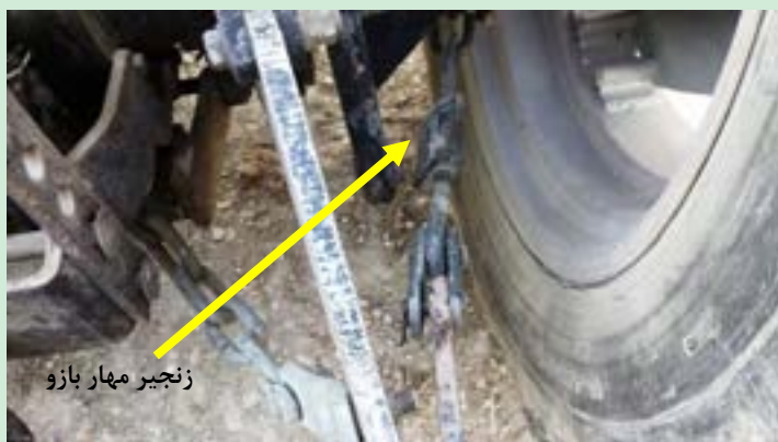
شکل ۲۴- زنجیره مه‌ار. برای تنظیم تعادلی

پس از اتصال نه‌رکن زنجیره‌های مه‌ار دو بازوی تحتانی را مطابق شکل زیر به اندازه کافی سفت کنید.