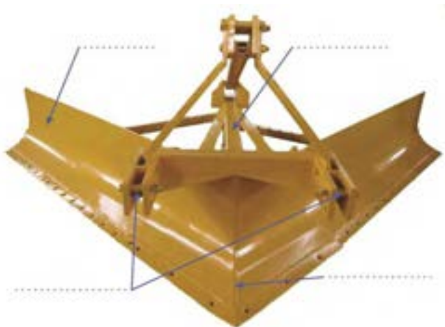
شکل ۲۱- ساختمان نه‌رکن

نام هر یک از اجزاء را در شکل ۲۱ را در محل مشخص شده بنویسید.