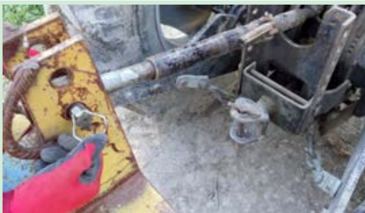
شکل ۲۳- اتصال بازوی وسط تراکتور به نه‌رکن

پس از اتصال نه‌رکن زنجیره‌های مه‌ار دو بازوی تحتانی را مطابق شکل زیر به اندازه کافی سفت کنید.