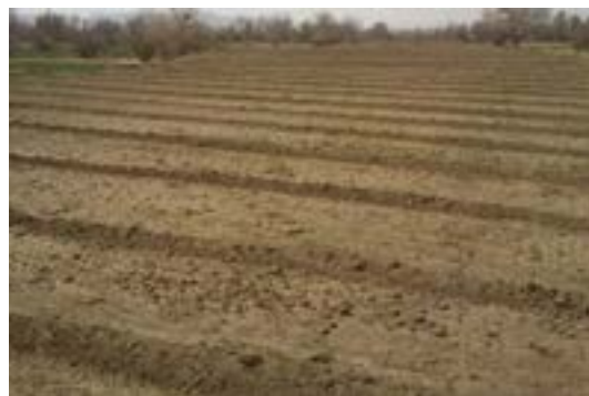
شکل ۱۷- قطعه بندی یا کرت بندی زمین برای انجام آبیاری یکنواخت