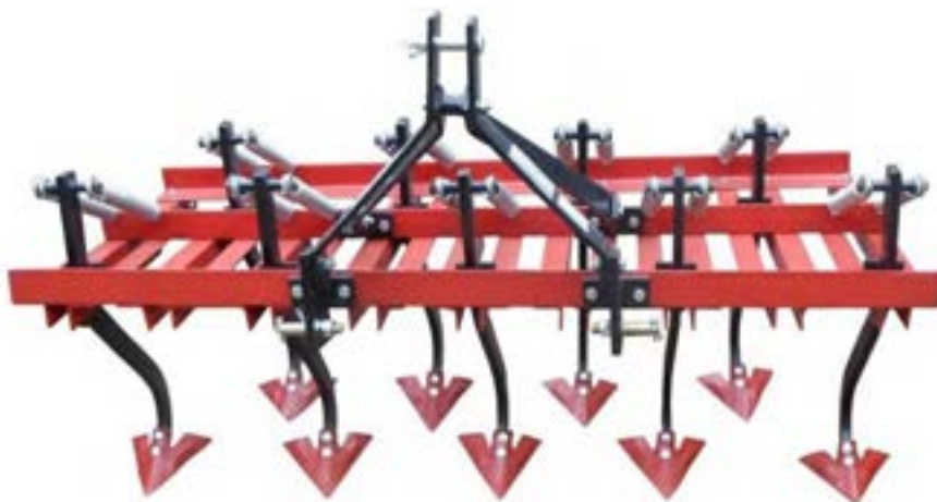
شکل ۱۰- کولتیواتور