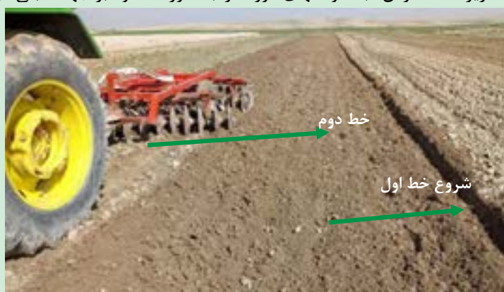
شکل ۱۲- فاصله خطوط رفت و برگشت هنگام دیسک زدن