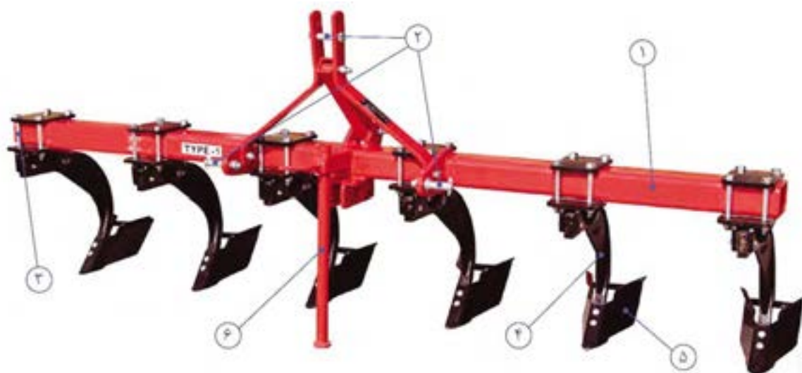
شکل ۱۳- ساختمان شیارکش

استفاده از شیارکش در مزارعی که حجم زیادی از بقایای محصول قبلی یا علف هرز وجود دارد باعث چسبیدن و جمع شدن شاخ و برگ به بیلچه‌های شیارکش شده و سبب ناهموار شدن زمین می‌شود.