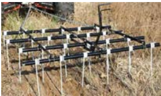
شکل ۸- هرس انگشتی

به ظاهر شبیه کولتیواتور مزرعه شاخه فنری است، اما از کولتیواتور مزرعه سبک تر است و در عمق کمتری نسبت به آن کار می کند (شکل ۹).