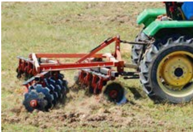
شکل ۳- دیسک دو زانویی سوار

دیسک تاندوم سوار: شکل و اجزای اصلی این دیسک کاملاً شبیه تاندوم کششی است. این دیسک فاقد چرخ‌های حامل و جک هیدرولیکی می‌باشد و به صورت اتصال سه نقطه به تراکتور متصل و از زمین به طور کامل بلند می‌شود (شکل ۳).