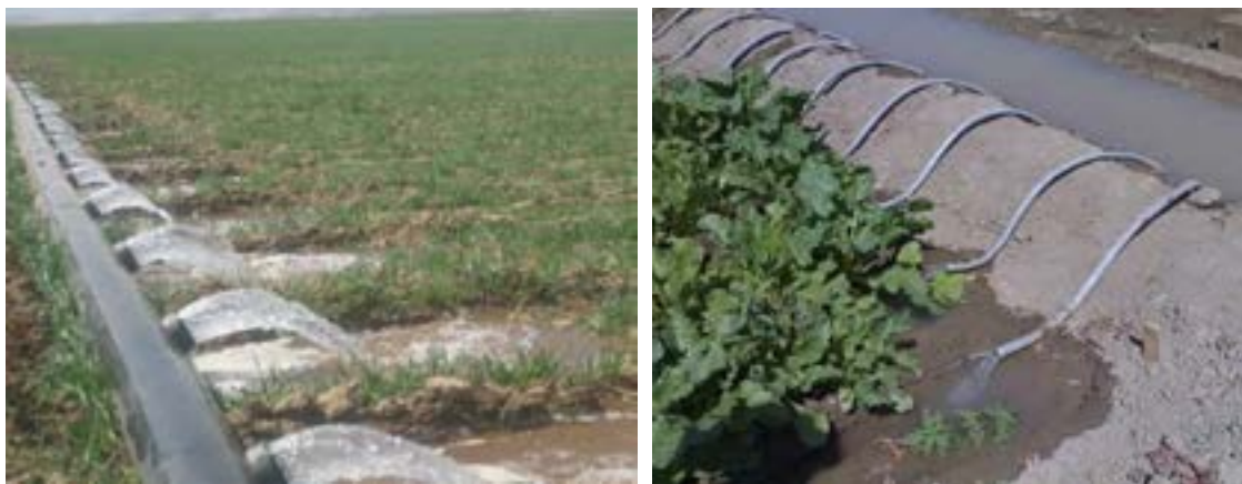
شکل ۱۹- آبیاری ثقلی به صورت جو و پشته با استفاده از سیفون و لوله هیدروفلوم

نوع دیگری از آبیاری ثقلی، به صورت جوی و پشته‌ای است. این روش به عبارتی حد میانه بین روش غرقابی و نشتی می‌باشد. در این روش جوی‌های کشت را به عرض، طول و فواصل مختلف بر حسب عوامل مؤثر ایجاد می‌کنند سپس جوی آبیاری را در بالا دست زمین یا بالاترین ضلع و عمود بر شیب زمین و راستای جوی‌های کشت ایجاد می‌کنند (شکل ۱۹).