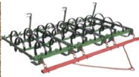
شکل ۹- هرس دندان فنری