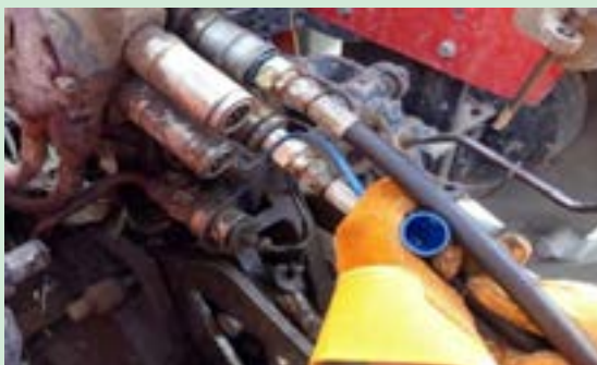
شکل ۱۱- اتصال دیسک کششی هیدرولیکی