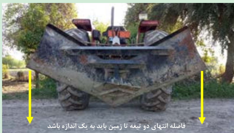
شکل ۲۵- تنظیم تراز عرضی نه‌رکن