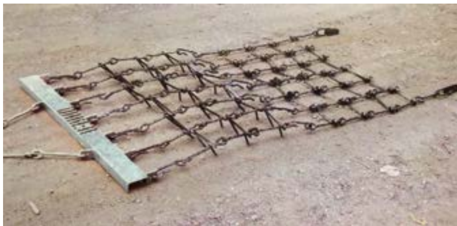
شکل ۷- هرس زنجیری