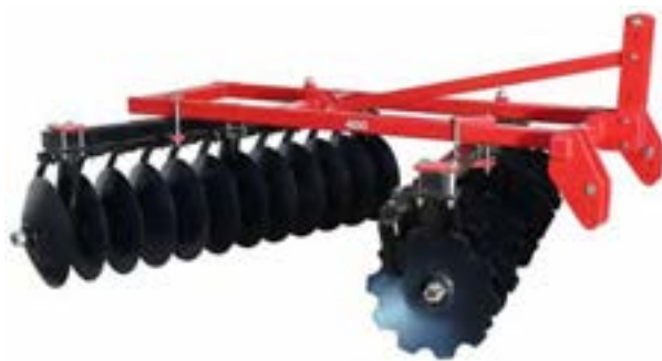
شکل ۵- دیسک آفست سوار

دیسک آفست کششی: شامل انواع هیدرولیکی و مکانیکی است. در انواع مکانیکی، به دلیل نداشتن سیستم هیدرولیک، تنظیم عمق (بالا و پایین کردن چرخ‌ها) دیسک با اهرم دستی انجام می‌شود، به همین دلیل کاربرد تنها در شروع کار یکبار عمق عمل دیسک را تنظیم کرده و تا پایان کار ادامه می‌دهد. این موضوع سبب می‌شود ابتدا و انتهای زمین در هنگام دور زدن بیش از یک بار دیسک زده شود. در دیسک‌های آفست کششی هیدرولیکی مشکل نوع مکانیکی را ندارد زیرا در ابتدا و انتهای زمین با استفاده از هیدرولیک، محور دیسک‌ها با پایین آمدن چرخ‌ها از خاک خارج می‌شود. دیسک آفست سوار: از لحاظ ساختمان شبیه به دیسک آفست کششی هیدرولیکی است با این تفاوت که به صورت اتصال سه نقطه به تراکتور متصل می‌شود (شکل ۴ و ۵).