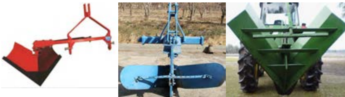
شکل ۲۰- انواع نه‌رکن سوار: ثابت - قابل تنظیم - کناری

در نوع متغیر قسمت پیشانی به صورت لولایی بوده و می‌توان فاصله صفحه برگردان‌ها را کم یا زیاد کرد. از لحاظ اتصال به تراکتور و تنظیم عمق به دو نوع کششی و سوار تقسیم می‌شود، که در کشور ما عموماً از نوع سوار استفاده می‌شود.