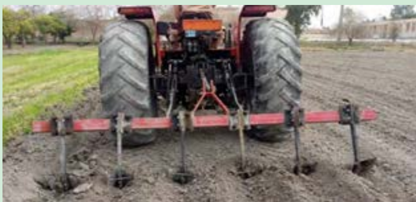
شکل ۱۵- ایجاد شیار با شیارکش

۴- پس از تنظیمات و قطعه بندی عملیات ایجاد شیار را در مزرعه انجام دهید (شکل ۱۵).