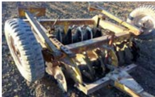
شکل ۴- دیسک آفست کششی