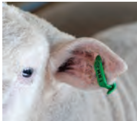
بره‌های دارای پلاک گوش

نوع روشی که برای شناسایی دام‌ها استفاده می‌کنید، بستگی به تعداد گله، شرایط محیطی، اهداف شناسایی، قوانین و مقررات دامپروری کشور، وسایل و امکانات موجود دارد.