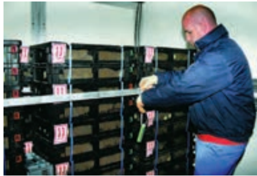
مهار شدن سبد جوجه‌ها در ماشین‌های حمل