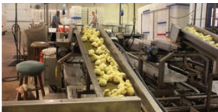
انتقال جوجه‌ها برای درجه‌بندی