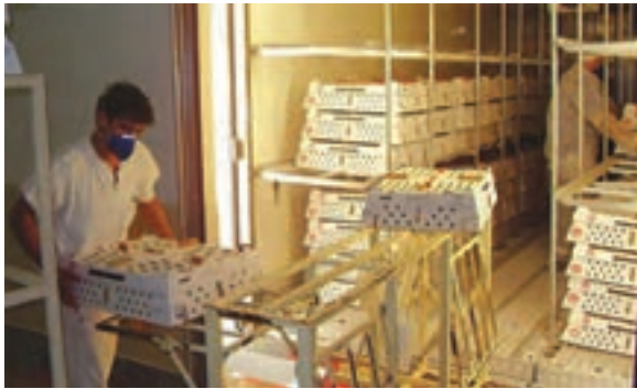
نحوه چیدن کارتن‌ها در ماشین حمل