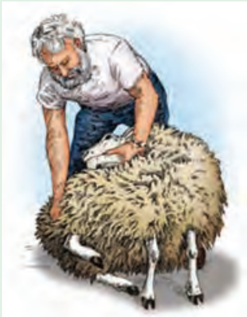
۴ سر گوسفند را در جهت عقربه ساعت خم کنید.