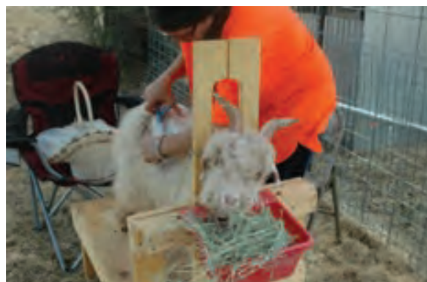
موجینی بز با استفاده از قیچی