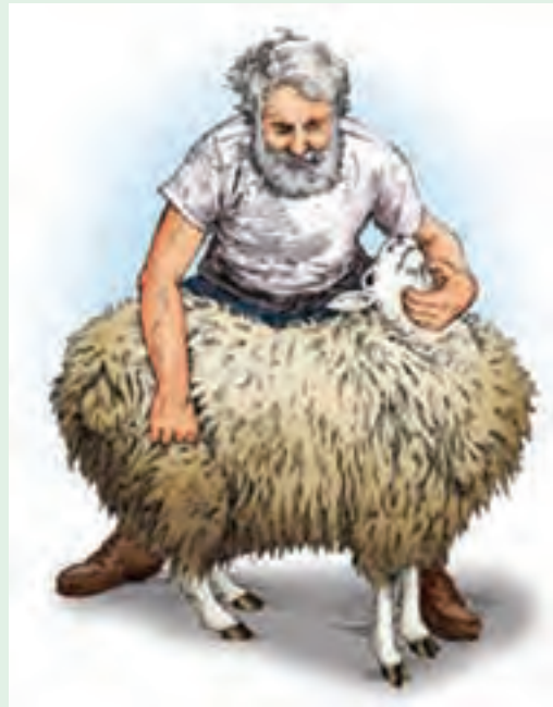
۲ با دست چپ زیر گردن گوسفند و با دست دیگر ران گوسفند را بگیرید.