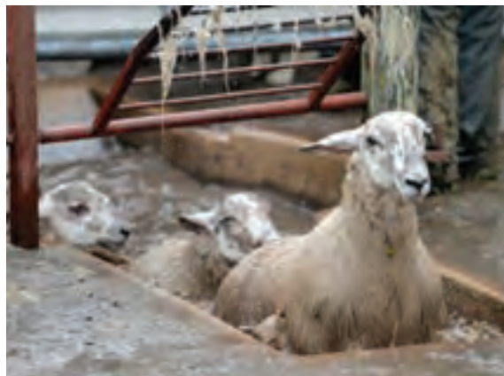
۳- حوضچه یا حمام

با توجه به مطالب بیان شده نام قسمت‌های مشخص شده در تصویر را بنویسید.