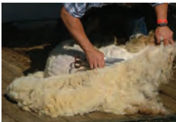
پشم‌چینی گوسفند با استفاده از دوکارد یا قیچی پشم‌چینی