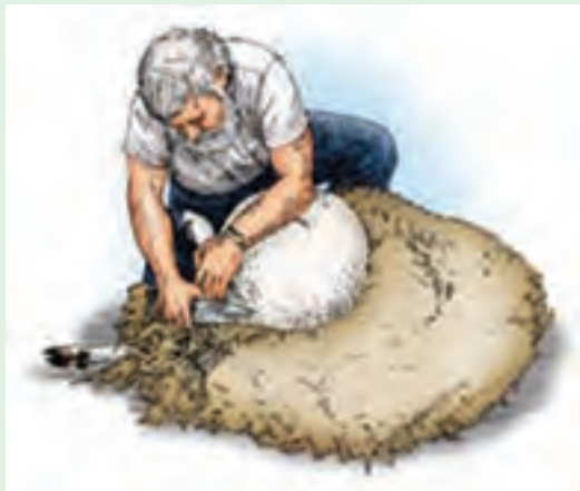
۱۴ با نگه داشتن پای چپ، امکان پشم‌چینی اطراف ناف فراهم می‌شود.