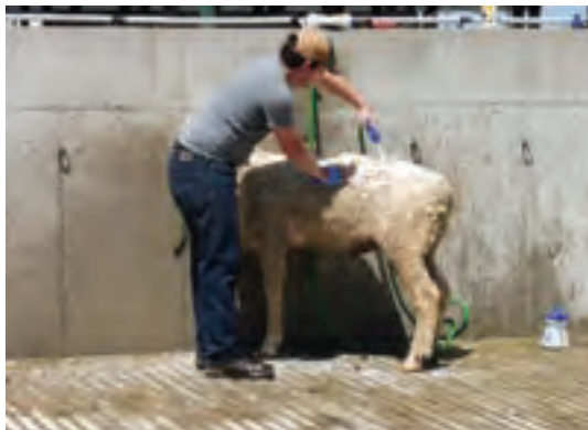
استفاده از شیلنگ آب برای شست‌وشوی گوسفند یا بز