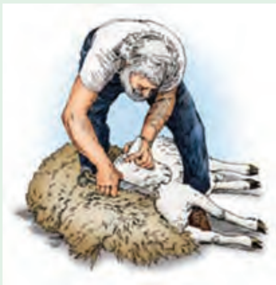
۱۶ یکی از گوش‌ها را با دست چپ نگه دارید و پشم‌چینی سمت راست گردن را انجام دهید.