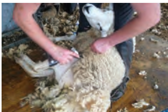
پشم‌چینی گوسفند با استفاده از ماشین پشم‌چین موتوری

برای حفظ مرغوبیت و بازارپسندی پشم باید از ابزارهایی استفاده نمود که پشم را به‌طور یکنواخت از بدن دام جدا نماید. در زیر به روش‌های مختلف اشاره شده است.