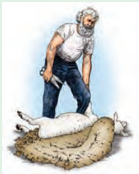
۱۵ در این قسمت نیمی از پشم‌چینی انجام شده است.