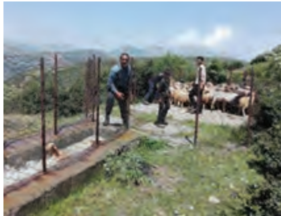
۱- قسمت انتظار