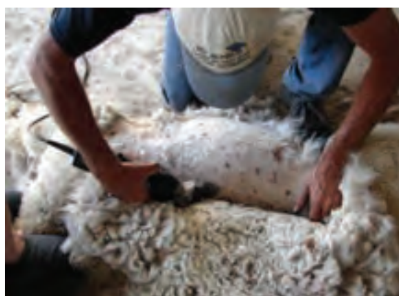
پشم‌چینی گوسفند با استفاده از ماشین پشم‌چینی برقی