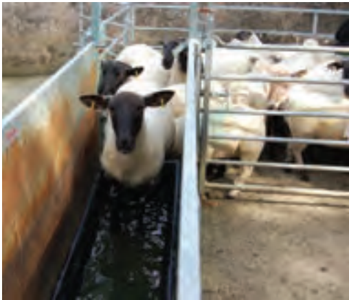
۲- راهرو یا گذرگاه