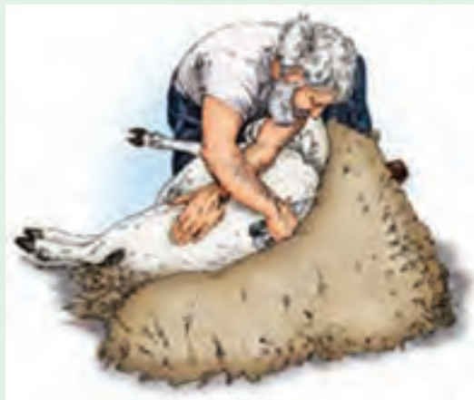
۱۳ در این موقعیت، پشم‌چینی ستون فقرات و چند سانتی‌متر اطراف آن را هم انجام دهید.