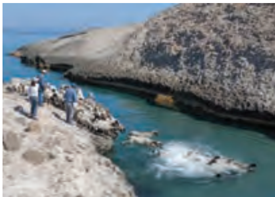
استفاده از منابع آب طبیعی برای شست‌وشوی گوسفند و بز