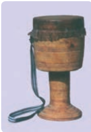
تمبک هرمزگان (میناب)

متداول در نواحی ایران یا چوبی هستند و یا فلزی. در بعضی مناطق فقط تمبک چوبی متداول است و در برخی دیگر فقط از تمبک فلزی استفاده می‌کنند. در بعضی مناطق نیز هر دو نوع متداول‌اند. تمبک‌های چوبی صرف‌نظر از اندازه آنها ویژگی‌های مشترک ساختاری با تمبک کلاسیک ایران دارند. تمبک فلزی معمولاً از ورق فلزی سیاه ساخته می‌شود و قسمت‌های مختلف آن با میخ و پرچ به هم متصل شده‌اند. همه تمبک‌ها اعم از چوبی یا فلزی یک استوانهٔ طینی دارند که روی دهانهٔ آن پوست چسبانده شده است.