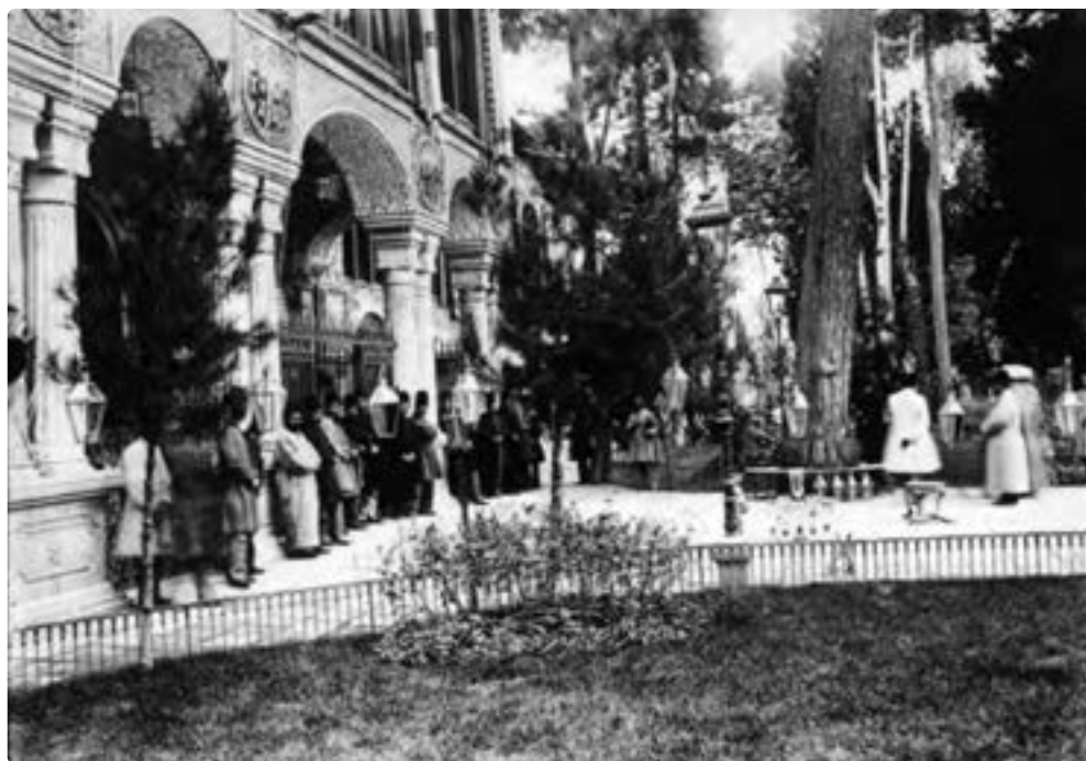
تصویر ۶ - تهران، دورهٔ قاجار