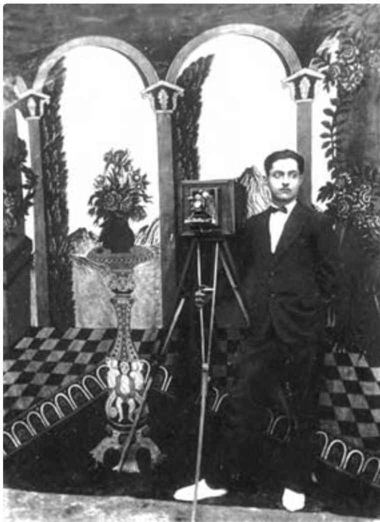
تصویر ۷- عکاس خانه فردوسی، شیراز، حدود ۱۳۲۵ شمسی