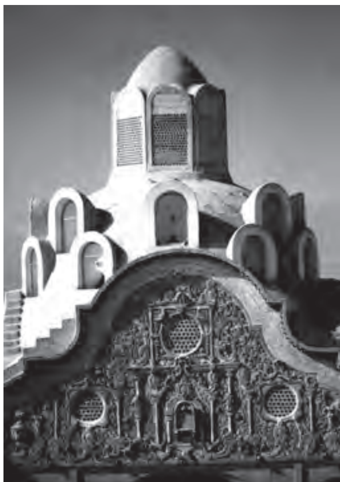
تصویر ۱- خانه بروجردی ها در کاشان

عکس ماحصل ترکیب نور (فیزیک) و ماده حساس به نور (شیمی) است. واژه «Photograph» به معنای «نورنگاری» است.