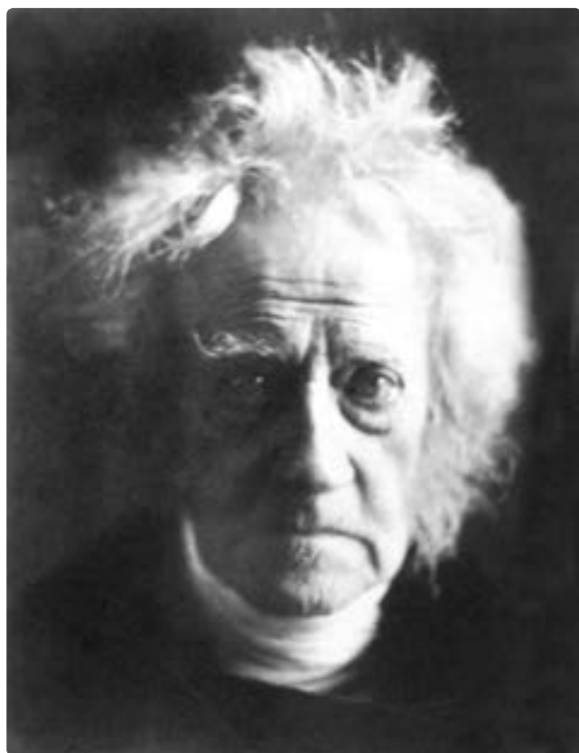
تصویر ۱۰ - مارگارت کامرون، ۱۸۶۷