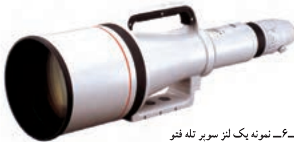
تصویر ۶-۶- نمونه یک لنز سوپر تله فتو