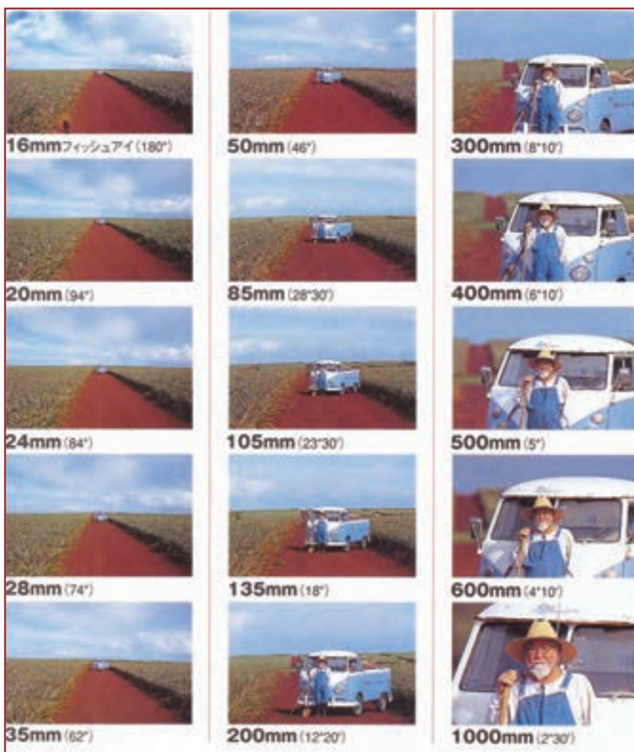
تصویر ۶-۷- تصاویر حاصل از لنز های مختلف از یک موضوع با زاویه دید هر یک از آن ها