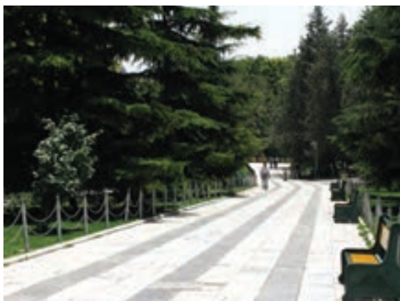
تصویر ۱۹-۶- پرسپکتیو لنز واید