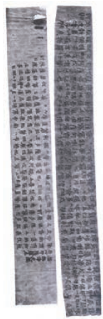
تصویر ۵- طلسم ها و سرودهای بودایی - ژاپن - ۷۷۰ م.

نخستین بول کاغذی نیز در سده نهم میلادی در چین طراحی و چاپ شد. همچنین در سده های نهم و دهم، کتاب های طوماری جای خود را به کتاب های آکاردئونی (دارای ورق های تاخورده) داد و در سده دهم و یازدهم کتاب های دوخته شده پدید آمد. چاپ کارت های بازی نیز شکل دیگری از طراحی گرافیک و چاپ اولیه بود که در چین رواج پیدا کرد. حروف متحرک اولیه در قرن یازدهم ابتدا در چین و سپس در کره به وجود آمد. چاپ در دنیای غرب: قدیمی ترین نمونه چاپ، پارچه ای است مربوط به سده ششم میلادی و به سبک شرقی، که با استفاده از قالب های چوبی اجرا شده و از داخل یک گور در اروپای شمالی به دست آمده است. در شرایطی که در سرزمین چین (و کشورهای مجاور) قرن ها از پیدایش و رواج چاپ می گذشت، روش استفاده از قالب چوبی بر روی کاغذ، در قرن سیزدهم از چین به اروپا منتقل شد. این آثار چاپی با متون مذهبی و تصاویر قدیسان همراه بود که به تدریج به چاپ کتاب های کلیشه ای انجامید (تصویر ۷). قبل از این دوره کتاب ها با دست نوشته می شد و نقاشان و تذهیب کاران آنها را مصور و مزین می ساختند.