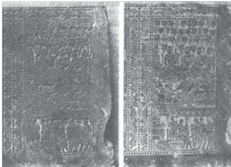
تصویر ۳- نقش برجسته چینی و نقش چاپی آن - سلسله تانگ - ۶۱۸ تا ۹۰۷ م.