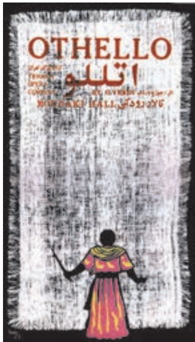
تصویر ۲۹- بهزاد حاتم - سیلک اسکرین - ۱۳۵۴ شمسی.

در کنار چاپ ماشینی، چاپ دستی همواره راه خود را پیموده است، که از این میان باید به ورود چاپ سیلک اسکرین (سری‌گرافی) در دهه چهل اشاره کرد. هنرمندان در شاخه گرافیک از این روش در خلق پوسترهای خود به‌ویژه در موضوعات فرهنگی بهره بسیاری بردند (تصویر ۲۸ و ۲۹).