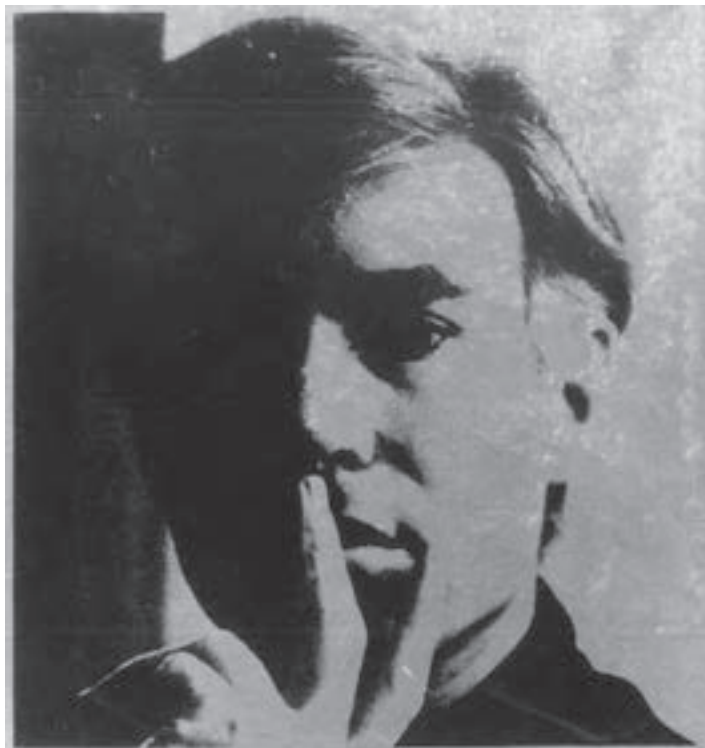
تصویر ۲۰- اندی وار هول - سیلک اسکرین روی کاغذ نقره‌ای - ۵۸/۷×۵۸/۵ سانتی‌متر- ۱۹۶۷ م.