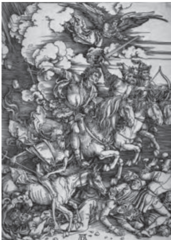
تصویر ۹- آلبرشت دورر- چهار سوار سرنوشت (از کتاب مکاشفات یوحنا)- حکاکی روی چوب- ۱۶۹۸ م.