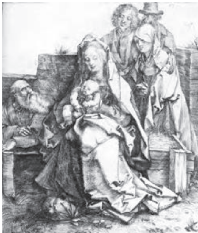
تصویر ۸- آلبرشت دورر- حکاکی روی فلز (شیوه درای پوینت)