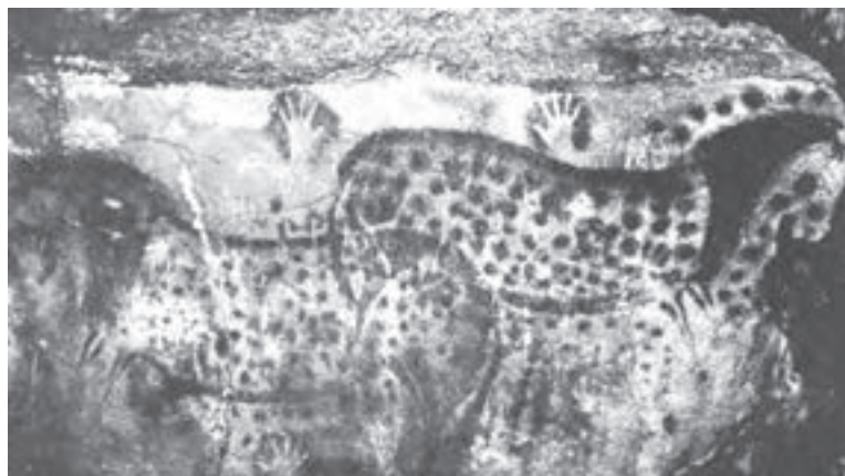
تصویر ۱- اسب‌های خالدار و نقش منفی دست. بش‌مرل، حدود ۱۰ تا ۱۵ هزار سال پیش از میلاد، ۳۴۰ سانتی متر طول، ولایت لوت، فرانسه.

دوران غارنشینی: در آثار بر جای مانده از دوران غارنشینی، دو گونه تصویر چاپ مانند به دست آمده است که در یکی از آنها اثر دست به صورت مثبت و در دیگری به صورت منفی بر دیواره غار نقش بسته است. در اولی با آغشته کردن دست به ماده رنگین و انتقال آن به سطح دیوار و در دومی با قرار دادن دست بر دیواره و پاشیدن رنگ به اطراف آن نقش دست بر جای مانده است (تصویر ۱).