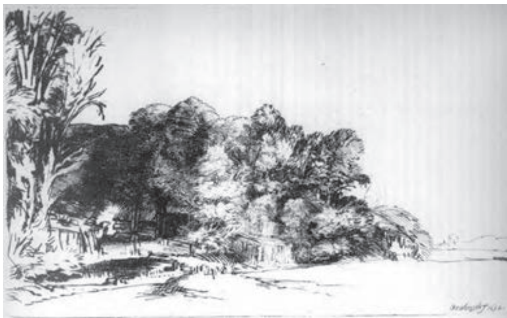
تصویر ۱۰- رامبراند- حکاکی روی فلز (شیوه درای پوینت)- ۲۱×۱۲/۵ سانتی متر- ۱۶۵۲ م.