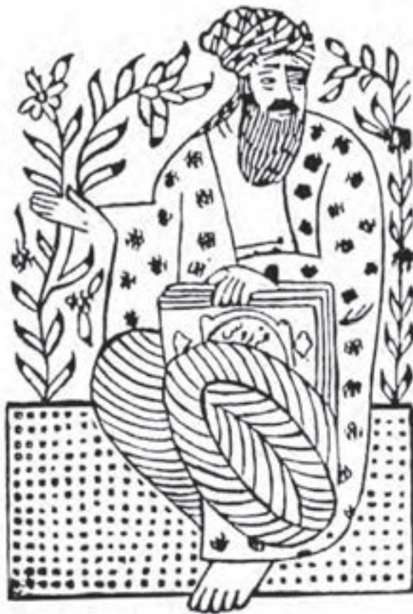
تصویر ۲۳ - نقش فردوسی - حاشیه کتاب چاپ شده با قالب قلمکار - دوره تیموری.

وجود نقش‌های چاپ‌شده بر حاشیه بعضی از کتاب‌های دوره تیموری نیز، نشان از استفاده از قالب‌های چوبی در سده دهم هجری دارد (تصویر ۲۳).