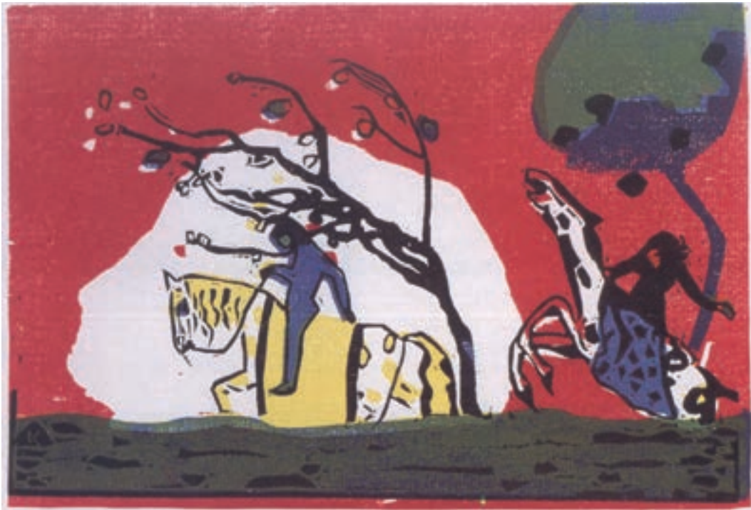
تصویر ۱۸- واسیلی کاندینسکی - حکاکی روی چوب - ۲۸/۵×۲۸/۴ سانتی متر - ۱۹۱۳ م.