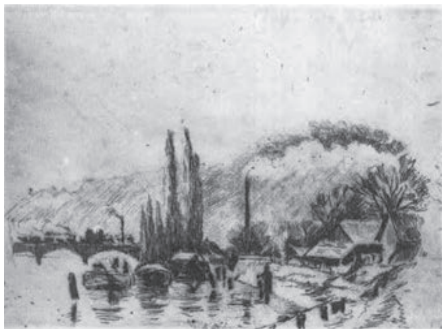
تصویر ۱۳- کامیل پیسارو - حکاکی روی فلز (شیوهٔ اچینگ و درای پوینت) - ۱۲/۸×۱۷/۵ سانتی‌متر - ۱۸۸۵ م.