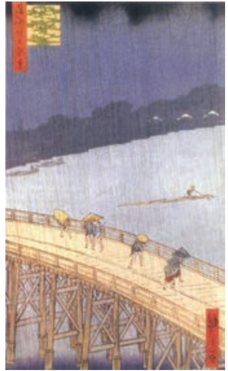
تصویر ۱۶- آندو توکیتارو هیروشیچ (هیروشیگه) - رگبار روی پل اوهایسی - حکاکی روی چوب - ۱۸۵۷ م.