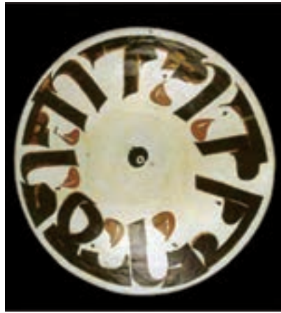
تصویر ۲۵- بشقاب سفالی، خط نوشته کوفی ایران، نیشابور، سده ۳ یا ۴ هجری