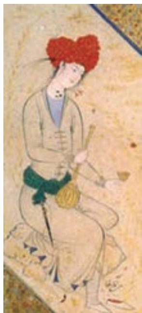
تصویر ۲۱- مکتب اصفهان، یک قطعه نقاشی، جوان نشسته، اثر آقارضا