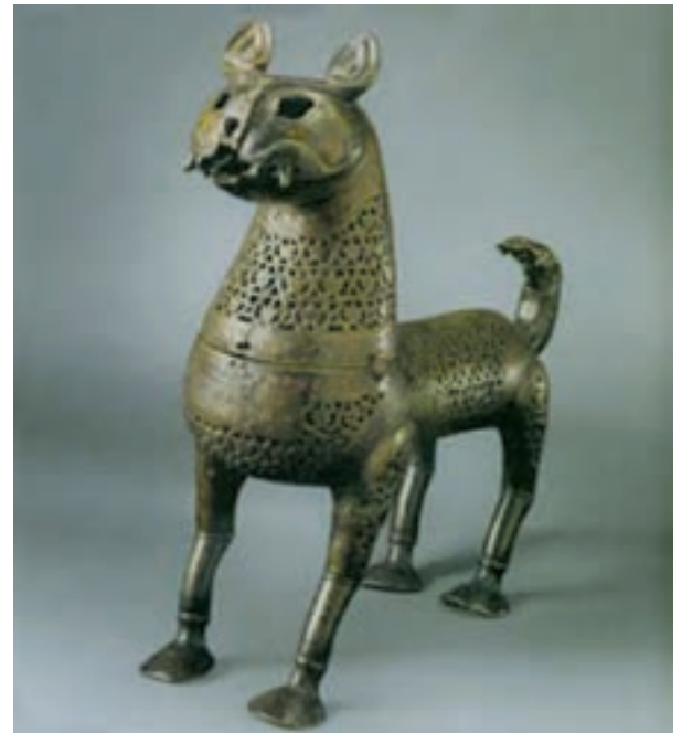
تصویر ۲۷- بخور سوز مفرغی، ایران. سده پنجم هجری، موزه ارمیتاژ

تولید اشیای فلزی در اغلب شهرهای جهان اسلام رواج داشت. دست آفریده‌های فلزی شهرهای ایران، مصر، سوریه و ترکیه از شهرت زیادی برخوردار هستند. هنرمندان مسلمان توجه خاصی به تنوع شکل و تزئین اشیاء داشتند. در میان اشیای فلزی، ساخت ظروف و لوازم خانگی از جایگاه ویژه‌ای برخوردار بودند. به دلیل تحریم استفاده از طلا و نقره، آثار فلزی اغلب با مفرغ، برنج و مس ساخته می‌شدند. زیبایی اشیای فلزی تنها در تنوع شکل آنها نیست بلکه تزئینات آنها چشمگیر است. فلزکاران انواع نقش‌های هندسی، گیاهی، برج‌های دوازده‌گانه، صحنه‌های رزم، بزم و شکار را به روش قلمزنی ایجاد می‌کردند. علاوه بر این گاهی با نوشته، سیاه قلمکاری، میناکاری، ترصیع و زراندود زیبایی آنها را صد چندان می‌کردند (تصاویر ۲۷ و ۲۸).