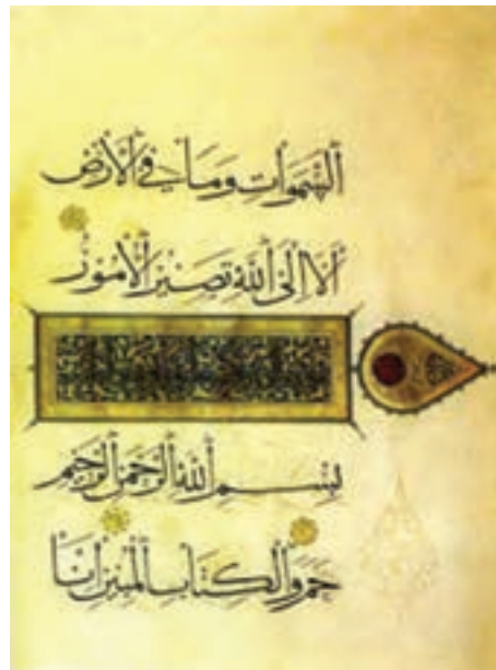
تصویر ۱۳- یک صفحه قرآن به خط ثلث، خط احمد بن سهروردی، اوایل سده هشتم هجری (دوره ایلخانی)، موزه ملی ایران