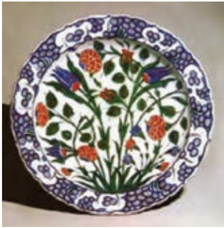
تصویر ۲۶- بشقاب سده دهم هجری، آزنیک، ترکیه