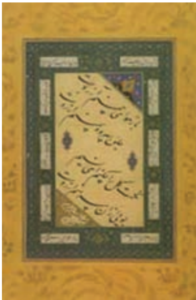
تصویر ۱۴- یک قطعه خط نستعلیق، خط مالک دیلمی، دوره صفوی

خوشنویسی ممتازترین و شریف‌ترین هنر اسلامی است. قرآن کریم نقش اول را در تعالی این هنر به عهده داشت، زیرا قرآن باید با خطی نوشته می‌شد که شایسته آن باشد، کاتبان وحی با سعی و تلاش خوشنویسی را به هنر درجه اول تبدیل کردند (تصویر ۱۲). یکی از ویژگی هنرهای اسلامی استفاده از خط در همه دست ساخته‌ها است. هنرمندان عبارات مذهبی و غیر مذهبی را با زیبایی هرچه تمامتر روی آثار مختلف می‌نوشتند. یکی از جذابیت‌های خوشنویسی مسلمانان تنوع خطوط آنها است. خط‌های کوفی، نسخ، ثلث و نستعلیق بیشترین رواج را داشت و خوشنویسان ایرانی در طراحی و تنوع خطوط سهم بیشتری داشتند (تصاویر ۱۳ تا ۱۴).