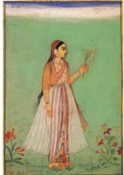
تصویر ۲۲- مکتب مغولی هند، دختری با شاخه گل، از یک مرقع، اندازه ۱۴/۴ در ۹/۷ سانتی متر، سده یازدهم، مجموعه خلیلی، لندن