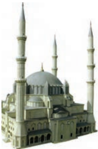
تصویر ۱۰- ماکت، سبک معماری مساجد عثمانی