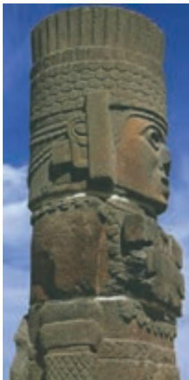
تصویر ۷- تندیس ایستاده، تولتک، مکزیکوسیتی

در پایان سده هشتم میلادی تمدن تئوتیواکان نابود شد و جای خود را در دره مکزیک به قوم مهاجم قبایل تولتک داد. هنر تولتک هندسی و خشک است (تصویر ۷).