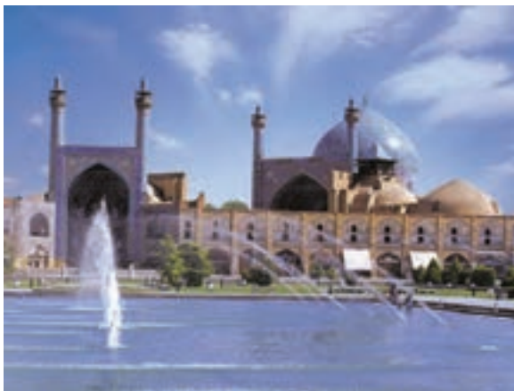
تصویر ۴- مسجد امام، دوره صفوی، اصفهان

گیاهی در تزیینات، پرهیز از طبیعت‌پردازی و واقع‌گرایی دیده می‌شود (تصویر ۴). تصویر ۲- خانه خدا (کعبه)، قبله‌گاه مسلمین جهان، مکه معظمه