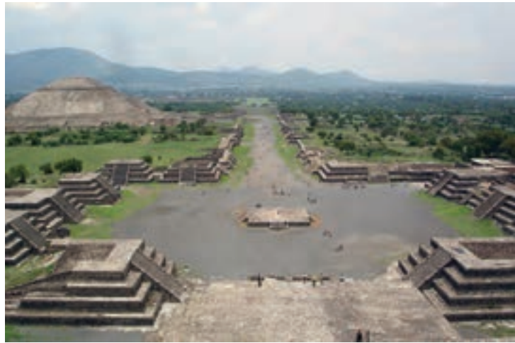
تصویر ۶- بخشی از شهر بزرگ تئوتیواکان