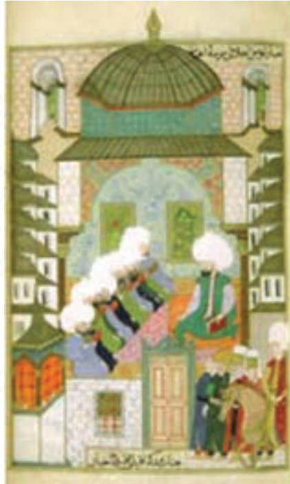
تصویر ۲۳- مکتب عثمانی، اثر محمد امیر شاه، کلاس درس در مدرسه غضنفر آقا در استانبول، سده یازدهم هجری

برخی از هنرمندان دوره صفوی در دربار عثمانی (ترکیه) و مغولی هند حضور یافتند. در این زمان مصور سازی کتاب به تقلید از کتاب‌های مصور ایرانی مورد توجه قرار گرفت و آثار با ارزشی در زمینه‌های مختلف مصور شد. هنرمندان ایرانی در شکل‌گیری مکتب نگارگری عثمانی و مغولی هند، نقش مهمی داشتند (تصاویر ۲۲ و ۲۳).