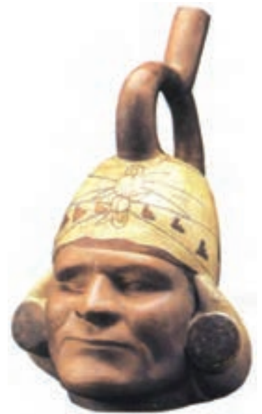
تصویر ۵- ظرف سفالی به شکل مرد تک چشم، پرو، حدود سال‌های ۲۵۰ تا ۵۵۰ میلادی، ارتفاع ۲۹ سانتی‌متر، موزه هنر شیکاگو

همزمان با تمدن مایا، در شمال شهر مکزیکو، تمدن دیگری به نام تئوتیواکان شکل گرفت. هنر این قوم بیشتر جنبه مذهبی داشت. سازندگان معابد مردمی کشاورز بودند که سبک هنری مشخصی در نخستین سده‌های عصر مسیحیت آفریدند. اینان خدایانی که مظاهر طبیعت ماه و خورشید و ... بودند، را می‌پرستیدند و پیکره‌های زیادی با چهره انسانی می‌ساختند (تصویر ۵ و ۶).