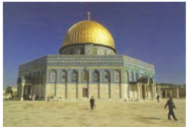
تصویر ۳- قبة الصخره، سال ۷۱ هجری، تزیینات سده ۱۱ هجری، (۱۷ میلادی) فلسطین

هنر اسلامی تنها به‌معماری و نقاشی محدود نمی‌شود بلکه هنرهای دیگر مانند خوشنویسی، کتاب‌آرایی، نگارگری، سفالگری، فلزکاری، پارچه‌بافی، شیشه‌گری، قالی‌بافی، درودگری (نجاری) و ... را نیز در بر می‌گیرد.