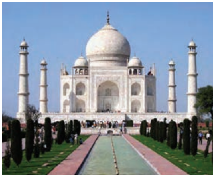
تصویر ۷- تاج محل، آرامگاه ممتاز محل همسر شاه جهان، آگرا، هند، اواسط سده ۱۱ هجری (سده ۱۸ میلادی)

۱- ورودی‌ها، ۲- اتاق‌های بخش مسکونی، ۳- فضای سرپوشیده رو به قبله، ۴- حیاط یا میانسر، ۵- صفا جهت اقامت یاران و مستمندان