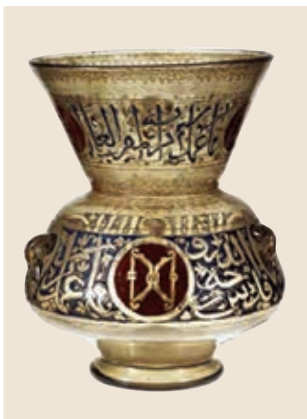
تصویر ۳۰- قندیل (چراغ سقفی)، سده ۸ هجری، دوره مملوک، موزه هنر متروپولیتن نیویورک

شیشه‌گری نیز از فنون و هنرهای دوره اسلامی است که به‌ویژه در دوره سلجوقی با الگوبرداری از شیشه‌گری دوره ساسانی و مراکز شیشه‌گری در سوریه و سایر کشورهای حوزه مدیترانه شرقی شکوفا بوده است. ظروف شیشه‌ای در اشکال و با تزیینات گوناگون و رنگ‌های متنوع ساخته می‌شد و مراکزی چون گرگان، نیشابور، ری و بندر سیراف در استان هرمزگان در ایران و برخی شهرها در کشورهای میانرودان (عراق امروزی)، سوریه و مصر از مراکز مهم و عمده شیشه‌گری کشورهای اسلامی بودند (تصاویر ۲۹ و ۳۰).