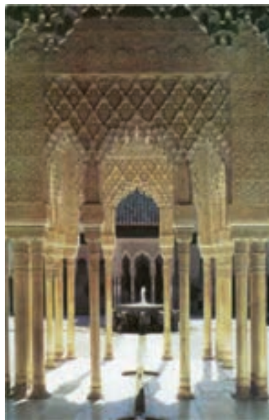
تصویر ۶- کاخ الحرام، گرانا، اسپانیا، سده ۸ هجری (۱۴ میلادی)