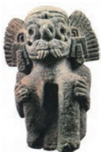
تصویر ۸- هنر آزتک، تندیس سنگی تلالوک، خدای باران آزتک، سده‌های ۱۴-۱۵ میلادی، ارتفاع ۴۰ سانتی‌متر، موزه مردم‌شناسی، برلین.