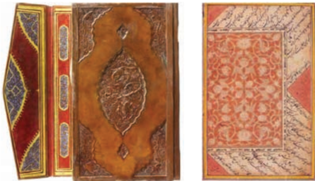
تصویر ۱۶- جلد ضربی. ایران، جلد کتاب مهر و مشتری، سده نهم هجری. موزه توپ‌کاپی، استانبول

(پانزدهم میلادی) جلدهای ایرانی به اروپا رسید و جلد سازی اروپا را تحت تأثیر قرار داد و جلدهایی با نقش‌های ایرانی ساخته شد.