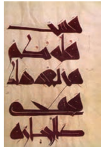
تصویر ۱۲- یک صفحه قرآن به خط کوفی مغربی (مراکشی)، روی پوست، سوره بقره، آیه ۷۴، خط علی بن وزاق سده پنجم هجری، موزه قیروان، تونس