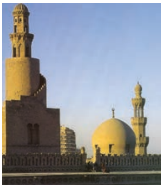
تصویر ۹- مسجد ابن طولون در قاهره ساخته شده در ۲۵۹ هجری