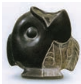
تصویر ۲- ظرف سفالی به شکل ماهی، اولمک، مکزیک

مایاها در شرق آمریکای مرکزی می‌زیستند و در حدود ۱۰۰۰ پیش از میلاد وارد مرحله شهرنشینی شدند و کم کم به اوج زندگی شهرنشینی خود رسیدند. آنها در ساخت بناهای شگفت‌انگیز، یادمان‌های سنگی، سفالگری، فلزکاری و نساجی توانا بودند. آنان در همه جا بر دیواره بناها نقش برجسته‌های نمادین می‌ساختند. خصوصیات بارز این نقش برجسته‌ها انبوهی و فشردگی صورت‌های شبه انسان و حیوان و شکل مکعب گونه آنها است. معمولاً پیکره‌ها با لباس مذهبی یا آئینی در میان علائم یا حروف رمزی نمایش داده می‌شوند (تصویر ۲). در حدود ۹۰۰ میلادی بسیاری از شهرهای مایا متروک شد و