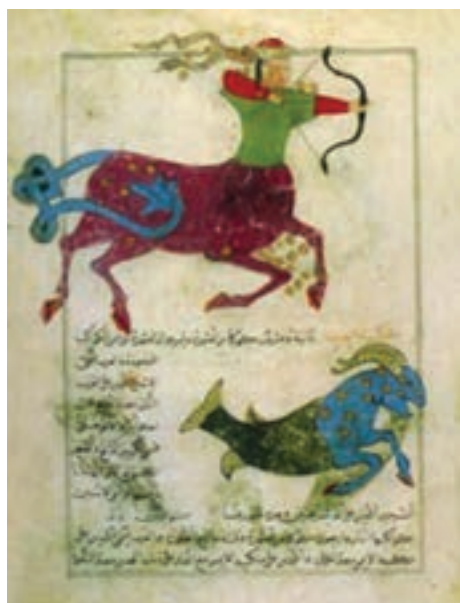
تصویر ۱۷- صورت فلکی قنطورس، کتاب عجایب المخلوقات قزوینی، مکتب بغداد، سده هشتم هجری

در اواخر سده دوم هجری نهضت ترجمه با مرکزیت بغداد شکل گرفت و کتاب‌های زیادی از پهلوی ساسانی، یونانی، مصری و هندی به عربی ترجمه شد. در میان آنها کتاب‌های مصور علمی چون گیاه‌شناسی، جانورشناسی، ستاره‌شناسی که مصور بودند نیز وجود داشت. این کتاب‌های مصور عامل توجه مسلمانان به تصویرسازی کتاب شد متأسفانه تا سده ششم هجری غیر از قرآن به ندرت کتابی باقی مانده است. اما کتاب‌های باقی مانده از اوایل سده هفتم هجری به بعد نشانگر توجه به مصورسازی کتاب‌های علمی در پایتخت‌های جهان اسلام (قاهره، بغداد، دمشق، تبریز، شیراز، هرات و...) است (تصویر ۱۷).