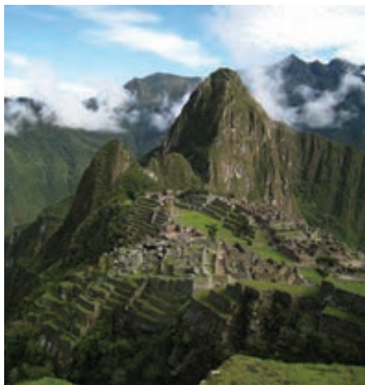
تصویر ۹- شهر ماچوپیککو، تمدن اینکارو، حدود ۱۵۰۰ میلادی

مهندسی ساختمان و شیوه معماری خشک (بدون ملات) شهرت دارند. معماری شکوهمند اینکا در مراکز عمده‌ای چون کوزکو ۱ و ماچوپیککو ۲ مشهور است. معابد هرمی شکل و مرتفع آنها از پاره‌ای جهات به اهرام مصر و زیگورات‌های بین‌النهرین شباهت دارند. در سده‌های ۱۹ و ۲۰ میلادی، آشنایی هنرمندان معاصر با هنر و تمدن گذشته اینکاها سبب گردید که هنر این قوم مورد توجه قرار گیرد (تصویر ۹).