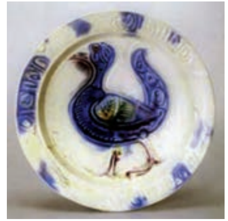
تصویر ۲۴- بشقاب با نقش پرند، سوریه یا مصر، سده هفتم هجری، موزه ارمیتاژ