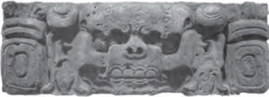
تصویر ۳- سرخدای مرگ، بخشی از سنگ محراب، کوبان، هندوراس، حدود سال‌های ۵۰۰ تا ۶۰۰ میلادی، ۳۷ در ۱۰۴ سانتی‌متر، موزه مردم‌شناسی، لندن

آنها به همراه قوم تولتک پایتخت خود را به یوکاتان ۱ (شرق مکزیک) انتقال دادند و در این محل سنت‌های هنری آنها درهم آمیخت و در حدود سده ۱۱ میلادی، معبد بزرگ هرمی شکلی را در چیچن ایتسا برپا کردند که امروزه جزء یکی از عجایب هفتگانه جهان است (تصویر ۳ و ۴).