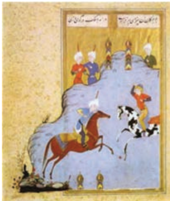
تصویر ۲۰- بازی گوی و چوگان، مکتب تبریز، کتاب گوی و چوگان، منسوب به مظفر علی، اوایل سده دهم هجری