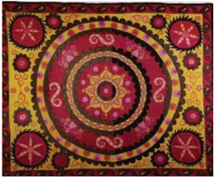
تصویر ۳۱- پارچه، ابریشم - کتان، آسیای مرکزی (ازبکستان)، سده ۱۹ هجری