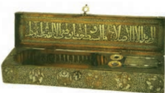
تصویر ۲۸- قلمدان برنجی، ساخت موصل، سده هفتم هجری. موزه ارمیتاژ