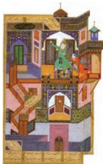
تصویر ۱۹- فرار یوسف از نزد زلیخا، مکتب هرات، بوستان سعدی، اثر بهزاد، سده ۹ هجری