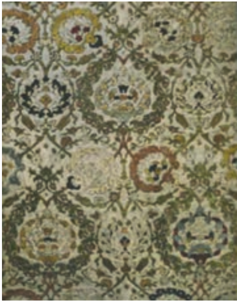
تصویر ۳۲- پارچه مخمل و زربفت، سده ۱۱، دوره صفوی، موزه توپکاپی