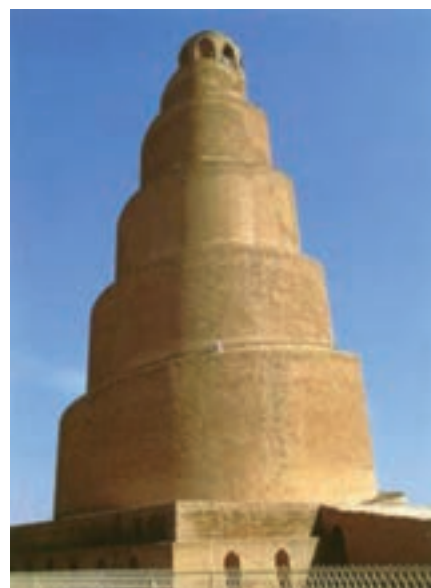
تصویر ۸- منار مسجد سامرا، سده سوم هجری، عراق