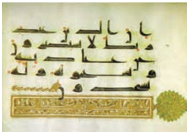
تصویر ۱- یک صفحه قرآن به خط کوفی تحریری، ایران، سده سوم هجری (۹ میلادی)، موزه ملی ایران

با هجرت رسول اکرم (ص) در سال اول هجری برابر با سال ۶۲۲ میلادی به شهر مدینه و تأسیس حکومت اسلامی در آن شهر، اساس هنر و تمدن اسلامی شکل گرفت. آنچه بیش از همه در شکل‌گیری هنر اسلامی نقش داشت، قرآن بود. انتشار قرآن به زبان عربی و رواج آن در تمام سرزمین‌هایی که دیانت اسلام را پذیرفتند، سبب پیوند و اتحاد بین ملل مختلف ساکن در این سرزمین‌ها شد و قرآن عامل خلق آثار هنری گردید (تصویر ۱).