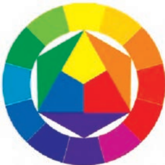
دایره رنگ ها

۴- پس از این که دانش آموزان رنگ های فرعی سبز، نارنجی و بنفش را به وجود آوردند و شاگردان با طیف وسیع هر یک از این رنگ ها نیز آشنا شدند می توانید مطابق عکس روبه رو دایره رنگ های اصلی و فرعی را آماده کنید تا شاگردان با این رنگ ها بهتر آشنا شوند. آنها با استفاده از دایره رنگ های اصلی و فرعی بهتر خواهند فهمید که از ترکیب آبی و زرد رنگ های سبز روشن و تیره به وجود می آیند و از ترکیب زرد و قرمز رنگ های نارنجی روشن و تیره و در آخر از ترکیب قرمز و آبی بنفش تیره و روشن حاصل می گردند. دایره رنگ به شاگردان کمک می کند تا این ترکیب شدن و پله های رنگی میان دو رنگ اصلی را بهتر درک کنند.