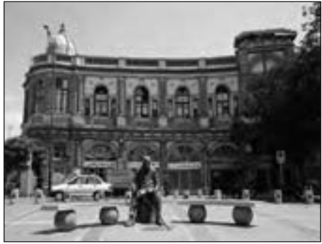
میدان حسن‌آباد جدید، تهران