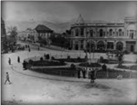
میدان حسن‌آباد قدیم، تهران