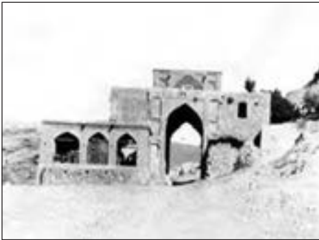
دروازه قران قدیم، شیراز

در صورت امکان تعدادی عکس از محله‌های قدیمی و جدید شهر خودتان پیدا کنید و به کلاس ببرید و از دانش‌آموزان بخواهید شباهت‌ها و تفاوت‌های عکس‌ها را بگویند و آنها را با یکدیگر مقایسه کنند و به این ترتیب بفهمند که محله‌ها در طول زمان دچار تغییر می‌شوند.