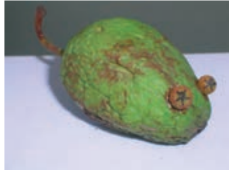
نمونه‌هایی از شکل‌سازی با مواد موجود در طبیعت