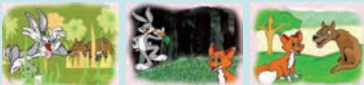
شکل ۱- نمونه کارت‌های تصویری

همچنین می‌توانید قصه زیر را برای آنها بخوانید و از آنها بخواهید کارت تصویری آن را درست کنند و در کلاس آن را برای هم گروه‌های خود اجرا کنند و چگونگی برقراری ارتباط را نمایش دهند.