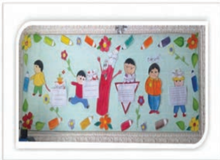
شکل ۷- نمونه تابلوی اعلانات