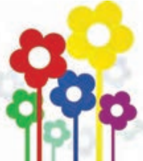
شکل ۵- نمونه تابلوی تقسیم کار

در پایان این فعالیت برای چالش ذهنی بیشتر در مورد سؤال زیر با هنرجویان گفت‌وگو کنید و در صورتی که آنها شیوه‌های دیگری پیشنهاد دادند، فهرست شیوه‌های مشارکت با کودک را کامل کنید: «چه شیوه‌های دیگری در مورد مشارکت با کودک می‌توانید بیان کنید؟».