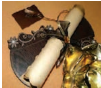
شکل ۴- نمونه کارت طوماری