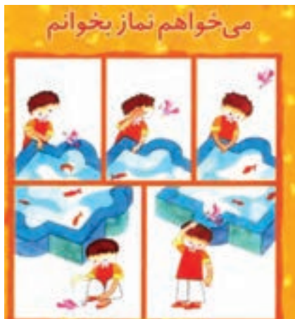
شکل ۲- نمونه کارت‌های تصویری

همچنین می‌توانید کارت‌های تصویری شکل ۲ را به هنرجویان خود نشان دهید و از آنها بخواهید با رسم مجدد آن داستانی برای آن بنویسند.