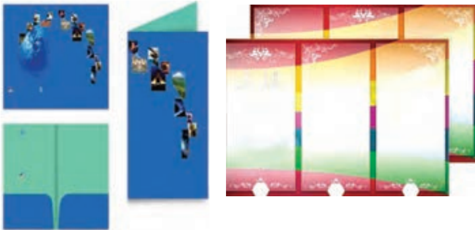
شکل ۳- نمونه بروشور

۱۱ پیامبر خدا ﷺ فرمود: خداوند دوست دارد که میان فرزندانان عادلانه رفتار کنید، حتی در بوسیدن آنها ۱ . هنرجویان باید بعد از تهیهٔ احادیث، آنها را در بروشوری جمع‌آوری کنند و در پوشهٔ خود نگهداری کنند. می‌توانید نمونهٔ بروشورهای زیر را به هنرجویان خود معرفی کنید.