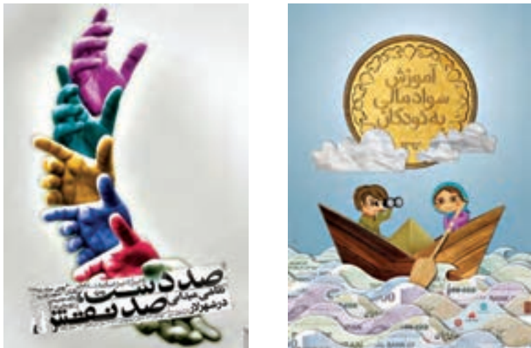
شکل ۶- نمونه پوستر

متناسب با صنعت مورد تبلیغ باید انتخاب شود. دومین گام در آموزش طراحی پوستر: انتخاب فونت مناسب: هرگز انتخاب فونت مناسب را در طراحی پوستر فراموش نکنید. سعی کنید از یک فونت ساده و خوانا استفاده کنید تا مخاطبان محصول در اولین نگاه بتوانند به راحتی مطلب روی پوستر را بخوانند. سومین گام در آموزش طراحی پوستر: انتخاب شعار تبلیغاتی و هدف طراحی پوستر: پیش از طراحی پوستر، به دنبال یک شعار مناسب و جذاب با دیدگاه بازاریابی باشید تا بتوانید هدف از طراحی پوستر و تبلیغات را به مخاطب القا کنید. چهارمین گام در آموزش طراحی پوستر: دقت به چیدمان: سعی کنید از شلوغی در تصویر هر پوستر بپرهیزید در نظر داشته باشید چنانچه هر یک از قسمت‌ها به صورت به هم چسبیده و یا همان‌طور که در ابتدای این نوشتار ملاحظه کردید، بیش از ۵ قسمت باشد، مخاطب حتماً چند مؤلفه مهم از پوستر را نخواهد دید. پنجمین گام در آموزش طراحی پوستر: انجام تحقیقات بازاریابی: پیش از طراحی پوستر در هر موضوع، پوسترهای موجود در آن موضوع را جمع‌آوری کنید تا بتوانید برای طرح پوستر مورد نظر یک وجه تمایز و برتری با طراحی‌های انجام‌شده پیشین ایجاد کنید. در شکل زیر، نمونه‌هایی از پوستر آورده شده است: