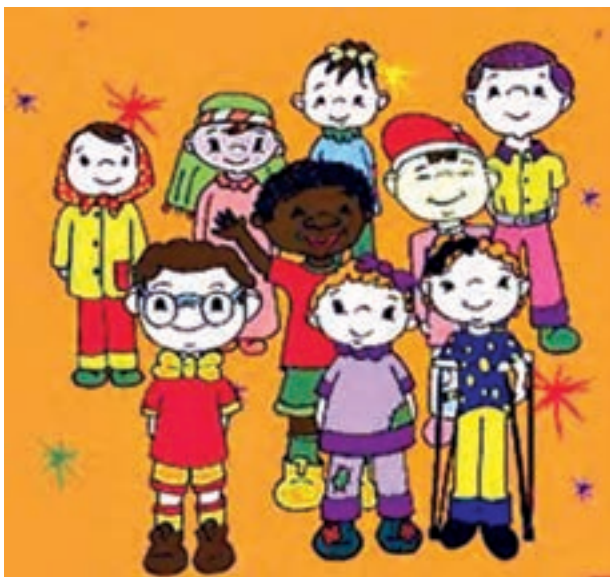
شکل ۸- کودکان دنیا

انواع سلاح‌های هسته‌ای و غیرهسته‌ای می‌شود، کودکان بسیاری از گرسنگی، نداشتن امکانات بهداشتی، سوء تغذیه و ... می‌میرند. یونیسف اعلام کرده است که تنها با اختصاص ۵ دلار برای هر کودک می‌توان جان ۹۰٪ از کودکانی را که سالانه می‌میرند، نجات داد و برای بهبودی چشمگیر زندگی کودکان جهان سوم کافی است که همان مبلغ در یک سال خرج شود و این مبلغ تنها معادل بودجه ۶ هفته تسلیحاتی جهان است. کودکان آسیب‌پذیرترین گروه در هر جامعه هستند و از هیچ چیز آنان از جمله غذا، پوشاک و نیازهای دیگرشان نباید کاست. بی‌توجهی به وضعیت کودکان به علت مشکلات اقتصادی و کاستن بودجه‌هایی که شرایط زندگی و حیات کودکان را خدشه‌دار می‌سازد، به امید اینکه اقتصاد آینده کشور تأمین باشد، نه توجیه و بازده اقتصادی دارد و نه حرکتی انسانی محسوب می‌شود. کودکان خالق زیباترین احساس‌ها و عشق‌ها هستند.