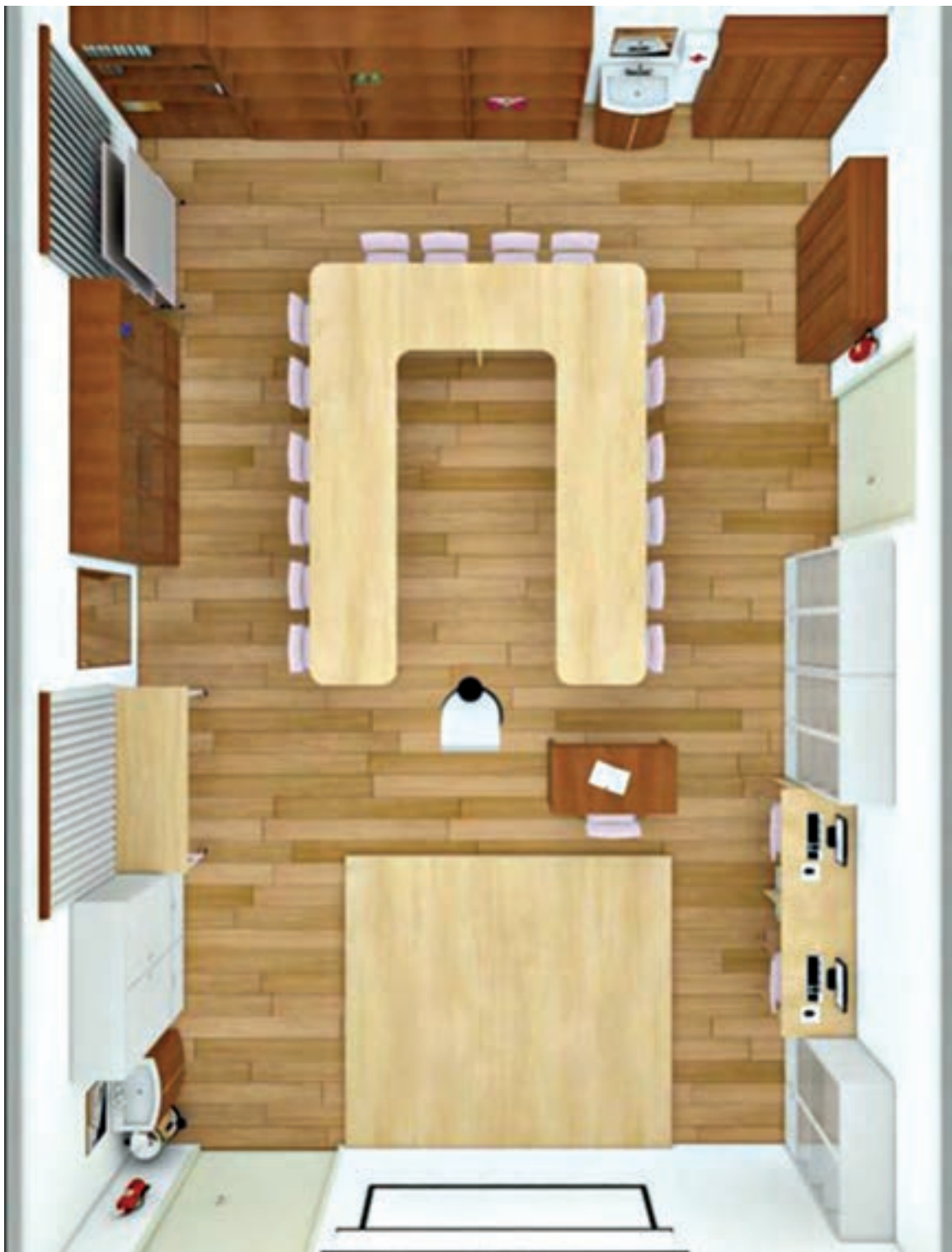
کارگاه فعالیت‌های هنری و خلاق