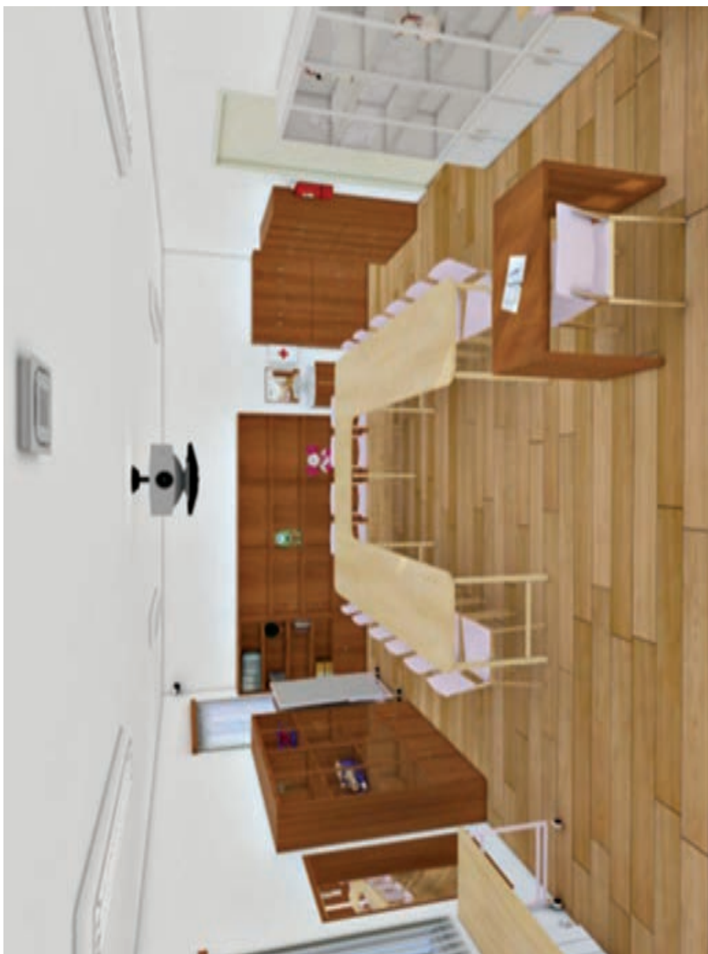
کارگاه فعالیت‌های هنری و خلاق