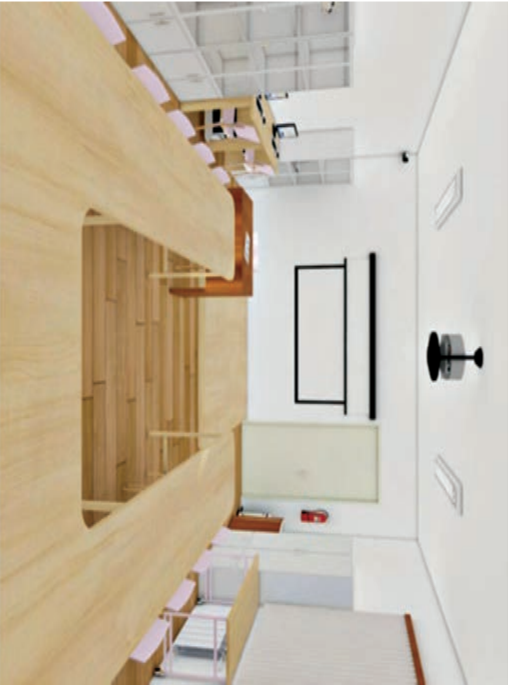
کارگاه فعالیت‌های هنری و خلاق