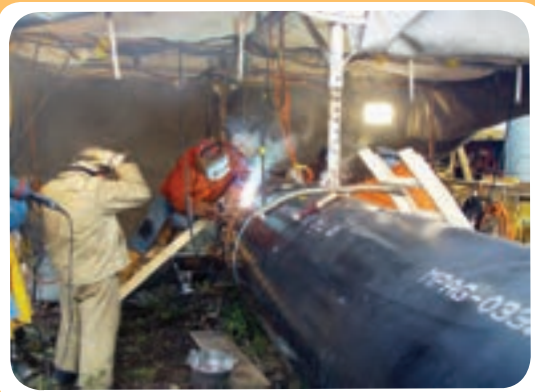
ن) کارگاه ساخت خط لوله