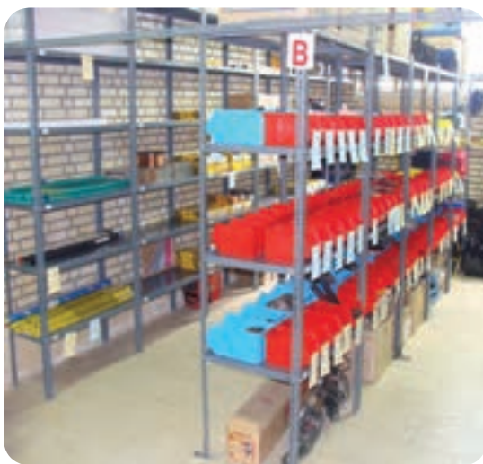
انبار مواد مصرفی جوشکاری