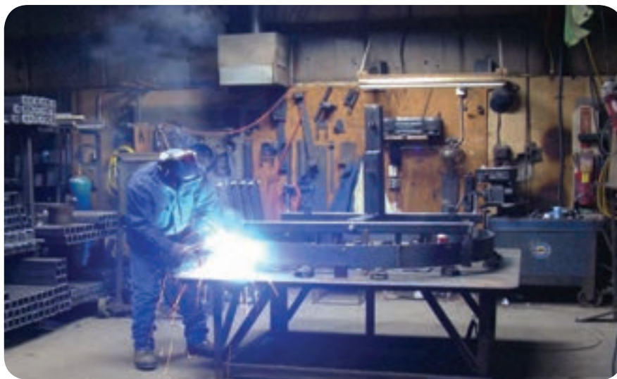
بخشی از فضای داخل کارگاه جوشکاری ساخت

فضای کارگاه جوشکاری به طور معمول سرپوشیده است ولی گاهی به دلیل شرایط اجرایی مثل: مشکل حمل و نقل سازه‌های بزرگ صنعتی بخشی از فعالیت‌های جوشکاری و یا تمام آن در محل نصب سازه‌ها (سایت) صورت می‌پذیرد.