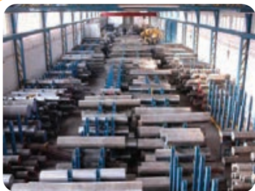
الف) انبار ذخیره لوله و پروفیل‌های گرد فولادی