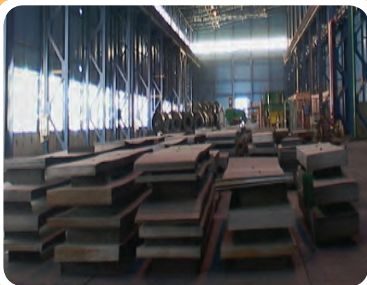
ج) انبار نگه‌داری انواع ورق فولادی