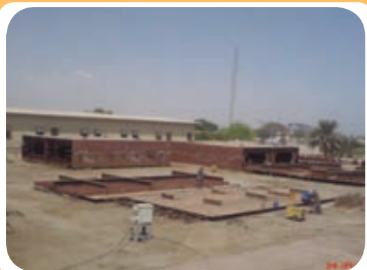
د) کارگاه ساخت اسکلت فلزی ساختمان