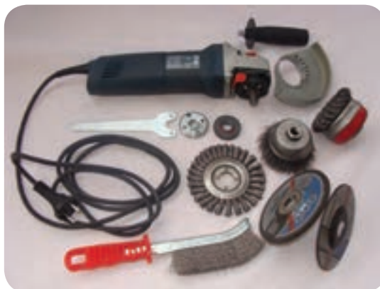
ب) دستگاه‌های آماده سازی و ماشین‌کاری نظیر: تراش، فرز، دریل، سنگ‌زنی، پرس کاری و پخ کاری