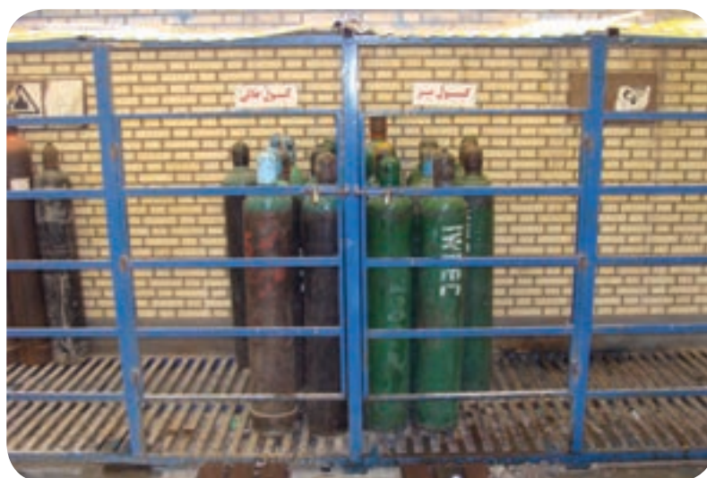
محل نگهداری کپسول‌های گاز محافظ