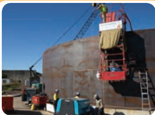
م) کارگاه ساخت مخازن ذخیره

نمونه ای از کارگاه‌های جوشکاری تجهیز شده برای ساخت سازه‌های صنعتی