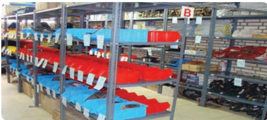
انبار ابزار و لوازم یدکی