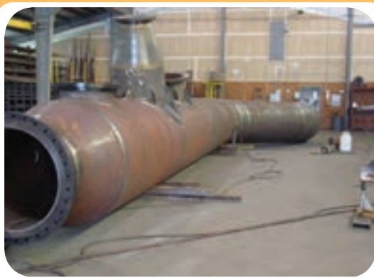
ج) کارگاه ساخت تجهیزات صنعتی