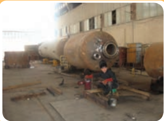
ب) کارگاه ساخت مخازن تحت فشار