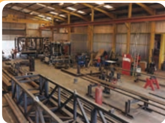
الف) کارگاه ساخت سازه‌های ساختمانی