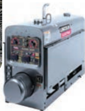
ج) دستگاه‌های جوشکاری نظیر: رکتیفایر، ترانس، دینام و موتور جوش ادامه- برخی از دستگاه‌های موجود در کارگاه‌های جوشکاری