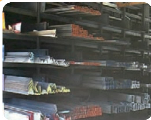
ب) انبار ذخیره انواع پروفیل فولادی