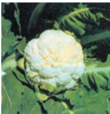
شکل ۸-۱- گل کلم

پاره‌ای از سبزیجات مانند کرفس، گل کلم، ریواس، مارچوبه و ... باید قبل از مصرف سفید گردند تا از نظر طعم و لطافت قابل استفاده شوند. برای این منظور باید به طرق مختلف از رسیدن نور خورشید به قسمت مورد نظر جلوگیری نمود که این عمل را «سفید کردن» می‌گویند (شکل‌های ۸-۱ و ۸-۲).