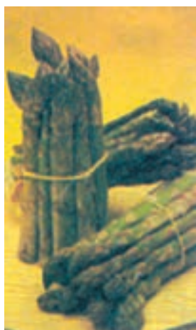
شکل ۸-۲- مارچوبه