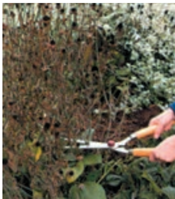
شکل ۵-۹- ج