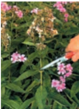
شکل ۵-۹- ب