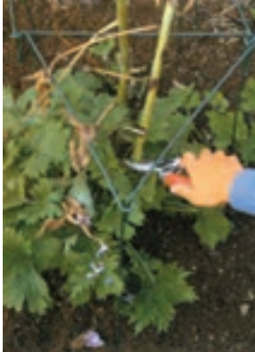
شکل ۵-۹- الف