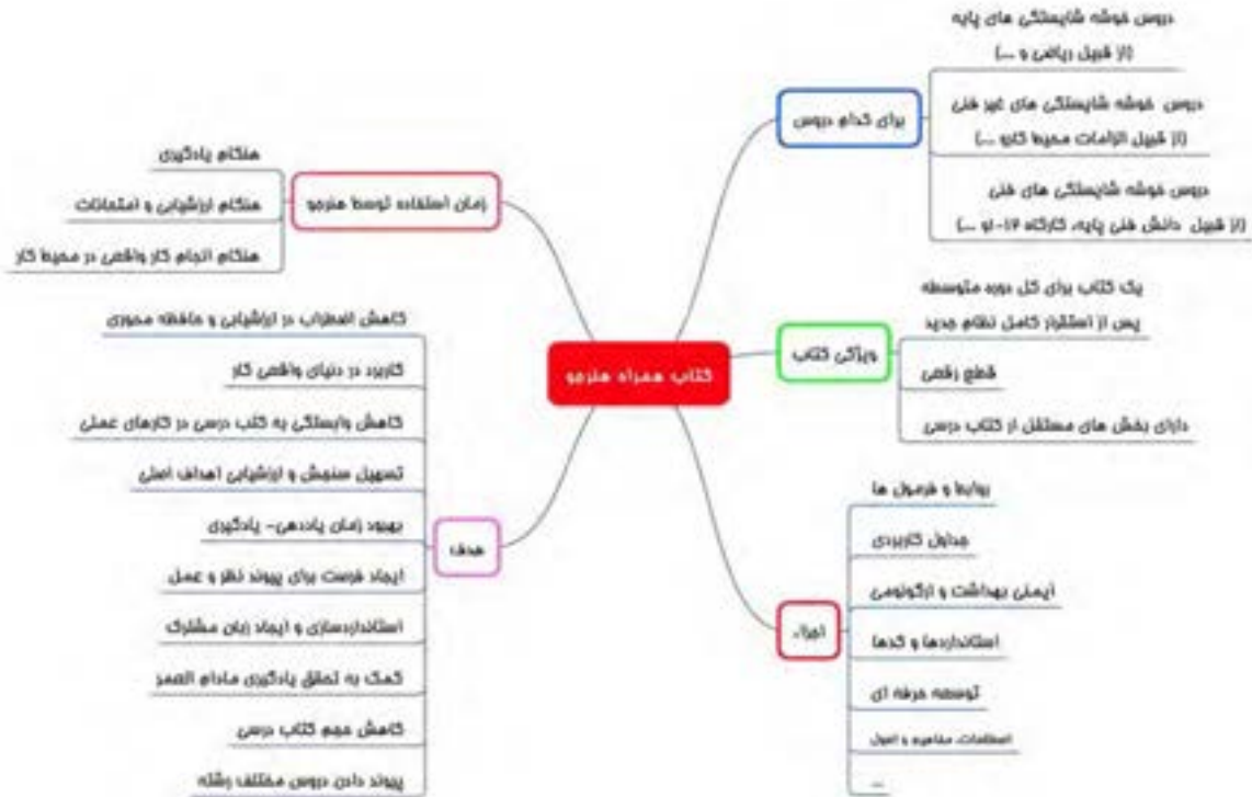
شکل ۱۰ - اهداف و ویژگی های کتاب همراه هنرجو