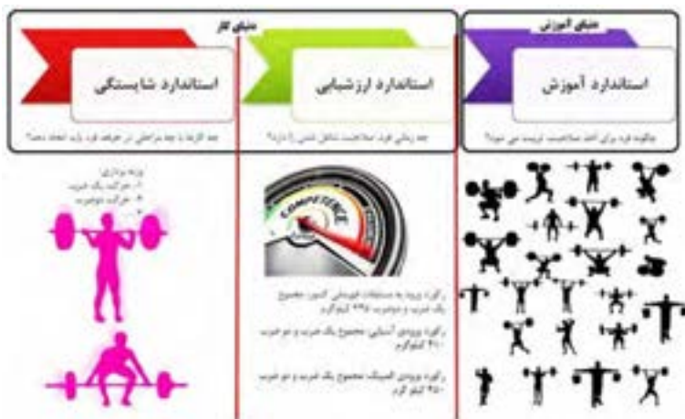
شکل ۳- توالی استانداردهای شایستگی حرفه، ارزشیابی و آموزش

ارزشیابی باید مستقیماً با استانداردهای شایستگی حرفه مرتبط باشد و براساس آنها تدوین شود (نه آن که از استانداردهای آموزشی اقتباس شود). این امر برای ارزشیابی دقیق میزان توانایی فرد ضروری می‌باشد. از نظر فردی، ارزشیابی می‌تواند منجر به صدور گواهینامه شود. به افراد کمک می‌کند تا وارد حرفه و شغل خاصی شوند و در آن پیشرفت نمایند و در شرایط یادگیری دائمی روشی را برای تثبیت توانایی‌ها و شایستگی‌های افراد در شرایط مختلف و زمان‌های متفاوت به دست دهد. از نظر کارفرمایان ارزشیابی می‌تواند در استخدام، ارتقاء و برنامه ریزی برای آموزش‌های داخلی به کار برده شود. از نظر مؤسسات مهارت آموزی ارزشیابی و سنجش، روشی برای تعیین کیفیت مهارت‌ها و دانش‌های آموخته شده در برابر شایستگی‌های واقعی مورد نیاز در یک حرفه است. با اعطای گواهینامه به افراد، هنرستان‌ها ی فنی و حرفه‌ای می‌توانند برنامه‌های آموزشی خود را به افراد و کارفرمایان ارائه نمایند. در مسیر حرکت از دنیای کار به دنیای آموزش می‌توان سه نوع استاندارد را مورد توجه قرار داد (شکل ۳).