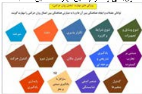
شکل ۲ - ویژگی‌های مهارت (بخش روان حرکتی)

توانائی عضلات و ایجاد هماهنگی بین آن‌ها و یا به عبارتی هماهنگی بین اعمال روان حرکتی را مهارت گویند. البته از سطوح بالائی حوزه شناختی نیز به عنوان مهارت یاد می‌شود. مهارت‌های روان حرکتی دارای ویژگی‌هایی هستند که در شکل زیر مشاهده می‌شود. در هر تکلیف کاری حداقل سه و حداکثر شش مرحله کاری وجود دارد که هر مرحله شامل دانش و مهارت است به نحوی که انجام هر مهارت مستلزم کاربرد دانش است و تعریف مذکور عملیاتی کردن مهارت را مد نظر دارد. بنابراین هر شایستگی (تکلیف کاری) می‌تواند از چندین مهارت تشکیل شده باشد.