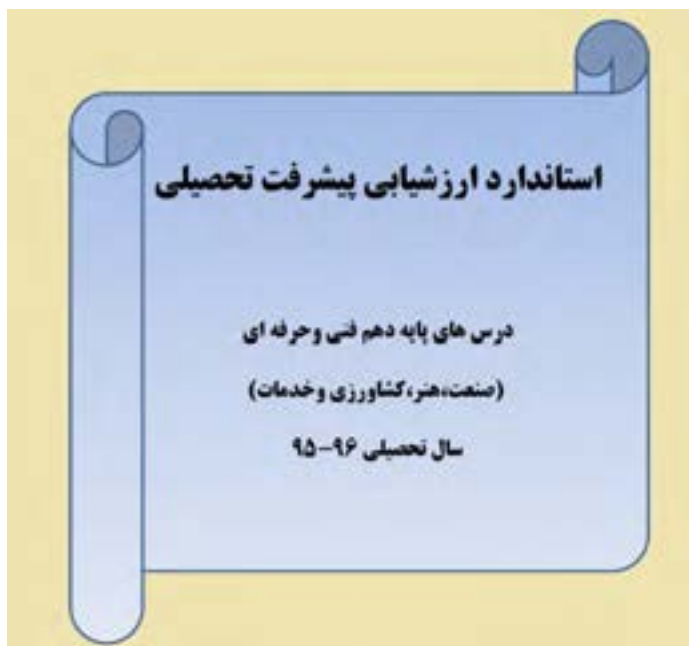
شکل ۸- کتاب استانداردهای ارزشیابی پیشرفت تحصیلی مبتنی بر شایستگی برای کلیه رشته‌های تحصیلی

به منظور استقرار نظام ارزشیابی پیشرفت تحصیلی استاندارد در کشور، استانداردهای ارزشیابی پیشرفت تحصیلی با رویکرد شایستگی را برای هر یک از دروس در شاخه‌های فنی و حرفه‌ای و کاردانش تهیه شده است.