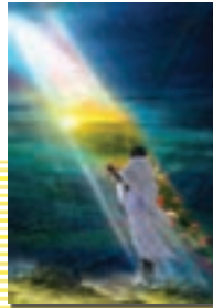
۱۲۲ درس یازدهم : دوستی با خدا