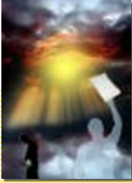
۸۸ درس هشتم : فرجام کار