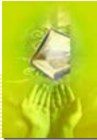
۱۳۴ درس دوازدهم : یاری از نماز و روزه