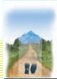
۱۰۲ درس نهم : آهنگ سفر