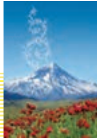
۱۴۸ درس سیزدهم : فضیلت آراستگی