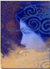
۱۵۸ درس چهاردهم : زیبایی پوشیدگی