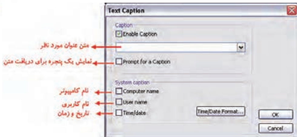
شکل ۳-۶ کادر محاوره Text Caption

با استفاده از این جلوه در بخش Effects می‌توان عناوینی مانند: قرار دادن یک عنوان برای تصویر، قرار دادن نام کامپیوتر، نام کاربر، اضافه کردن تاریخ و زمان را روی خروجی نهایی اعمال کرد. (شکل ۳-۶)