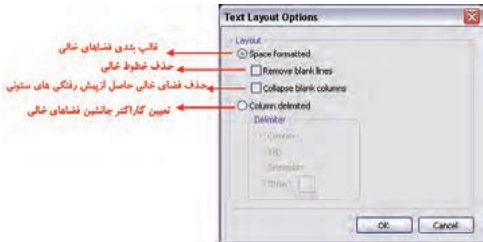
شکل ۳-۵ کادر محاوره تنظیمات جلوه Layout

از این گزینه برای تنظیم قالب بندی مربوط به فضاهای خالی و کاراکترهای جانشین قرار گرفته در این فضاها استفاده می‌شود با اجرای این گزینه، کادر محاوره‌ای مربوط به آن باز خواهد شد. (شکل ۳-۴)