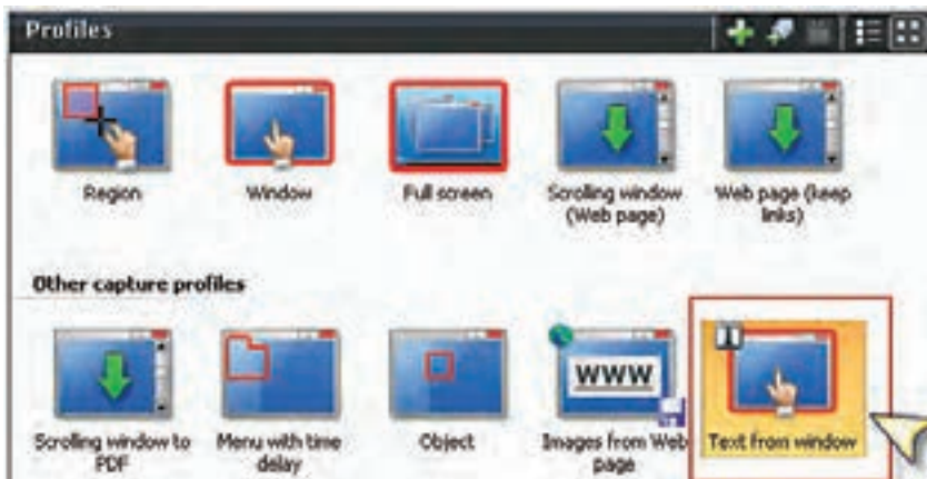
شکل ۳-۲ انتخاب نوع ورودی از بخش Profiles

پنجره‌های را که می‌خواهید متن موجود در آن را جدا کنید، باز کرده و سپس در نرم‌افزار SnagIt از پانل Profile گزینه‌ی Text from a window را انتخاب کنید. اکنون اگر دکمه Capture را که در قسمت پایین و سمت راست کادر محاوره قرار دارد، کلیک کنید یا از کلید میانبر تعریف شده (Print Screen) استفاده کنید، اشاره‌گر ماوس به شکل یک دست در می‌آید؛ در این حالت چنانچه روی پنجره مورد نظر کلیک کنید، عملیات Capture انجام خواهد شد. (شکل ۳-۲)