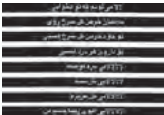
تصویرسازی کتاب - قباد شیوا