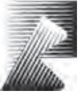
نشانه نوشته‌ی شرکت بی. بی. بی طراح: نورالدین زرین کلک

خطوط عمودی، افقی، مایل و منحنی می‌توانند در مسیر حرکت خود دارای شرایط زیر باشند که برای آشنایی بیش‌تر شما با چگونگی استفاده از تغییرات انواع خطوط در طول مسیر حرکت، نمونه‌هایی از کارهای گرافیک را نیز در این‌جا می‌آوریم. ۱. ضخیم یا نازک، قوی یا ضعیف، تیره یا روشن شوند.