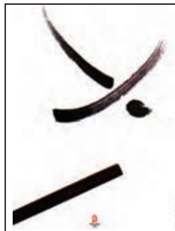
کان- تای کنونک - طراحی برای رشته‌های ورزشی المپیک