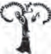
نشانه‌ی انتشارات مارلیک طراح: نیلوفر وکیل بهرامی

۳. می‌توانند در جهت مسیر اصلی خود به صورت بریده بریده یا ممتد باشند.