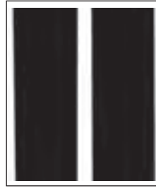
نشانه انتشارات سروش - قباد شیوا