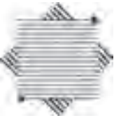
نشانه‌ی انجمن ویراستاران طراح: قباد شیوا

۲. به صورت خطوط باریک یا ضخیم یکنواخت باشند.