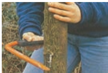
شکل ۳-۵۱ ب