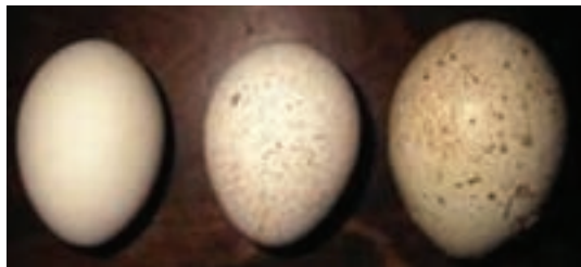
تصویر ۵-۲- مقایسه‌ی تخم مرغ و تخم بوقلمون