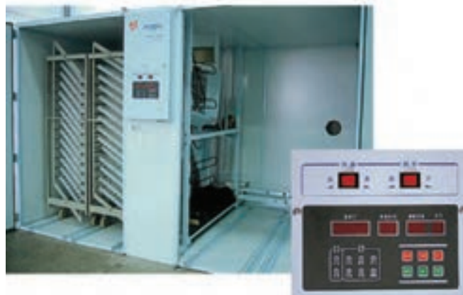
تصویر ۳-۲- انواع دستگاه جوجه‌کشی (ستر) بزرگ

سه روش (جریان هوای گرم، جریان آب گرم و قراردادن مقاومت‌های الکتریکی) گرم کنید. برای تأمین حرارت دستگاه از برق، گاز و یا نفت استفاده می‌شود. در ماشین‌های کوچک جوجه‌کشی، رطوبت از طریق قراردادن ظرف آب در زیر تخم‌مرغ‌ها و در ماشین‌های بزرگ با استفاده از منبع تأمین رطوبت همراه با المنت و یا به وسیله‌ی اسپری تولید می‌شود. تهویه در ماشین‌های کوچک از طریق باز و بسته کردن دریچه‌ها و در ماشین‌های بزرگ با نصب هواکش انجام می‌گردد. چرخش نیز در ماشین‌های کوچک دستی و در ماشین‌های بزرگ به صورت خودکار با جک‌هایی متصل به کمپرسور باد انجام می‌شود.