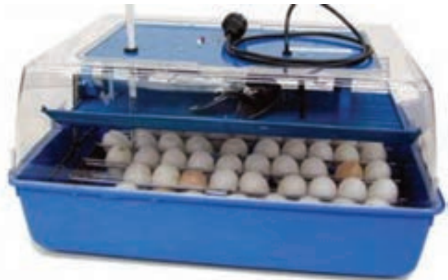
تصویر ۲-۲- انواع دستگاه‌های جوجه‌کشی کوچک (آزمایشگاهی)