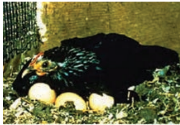
تصویر ۱-۲- جوجه‌کشی طبیعی