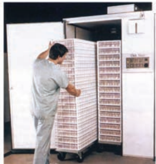
تصویر ۴-۲- انواع دستگاه تفریخ