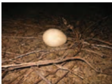
تصویر ۷-۲- تخم غاز