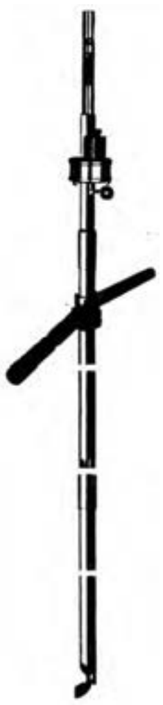
شکل ۵-۳- سوند فستوکسین برای قرص‌گذاری در داخل توده غله

۴- در انبارها از ترکیبات هیدروژن فسفره مثل قرصهای فستوکسین نیز می‌توان استفاده نمود. در انبارهای سرپوشیده و یا زیر چادرهای پلاستیکی به ازای هر تن محصول مثل گندم، جو، برنج و ... ۳ تا ۶ قرص کافی است این قرصها سرعت و حداکثر