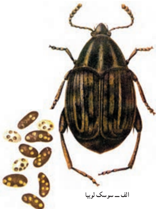
الف - سوسک لوبیا

۷- سوسک لوبیا: حشره کامل به رنگ خاکستری و به طول ۲ تا ۴/۵ میلیمتر است. در اواخر زمستان در انبارها ظاهر می شود. تخم ریزی این حشره بیشتر در انبار صورت می گیرد. لاروها پس از تغذیه محصول و تبدیل حشره کامل به مزارع نیز حمله کرده، موجب خسارت می شوند (شکل ۱۴-۳) در سال قادر به تولید چند نسل است. این آفت در درجه اول به لوبیا خسارت می زند اگر لوبیا موجود نباشد به سایر دانه های حبوبات حمله می کند.