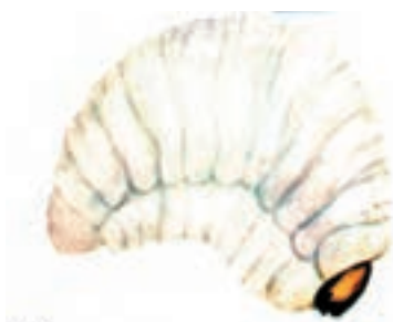
الف - لارو شپشه برنج

۲- شپشه برنج: حشره کامل به رنگ قهوه‌ای مایل به سیاه و به طول ۲/۵ تا ۴ میلی‌متر است. دارای بالهای ریز و قادر به پرواز است (شکل ۹-۳).