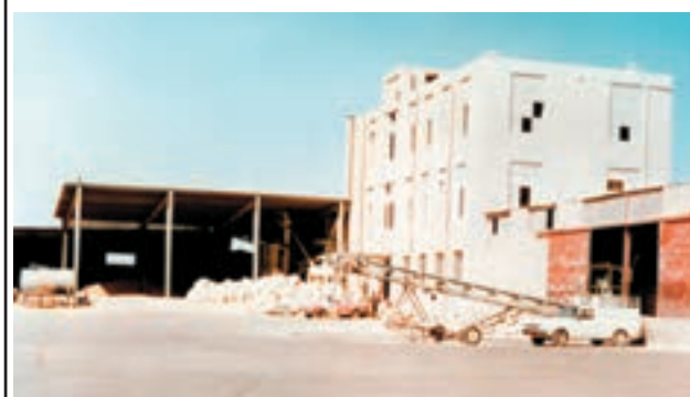
شکل ۳-۳- نوع دیگر انبار