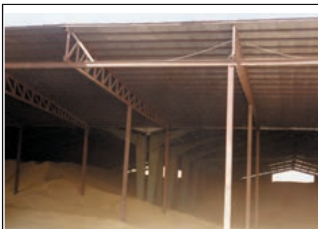
شکل ۲-۳- یک نوع انبار