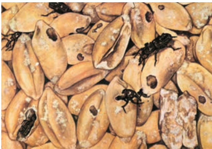
شکل ۸-۳- خسارت آفات روی محصول