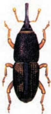
ب - شپشه برنج