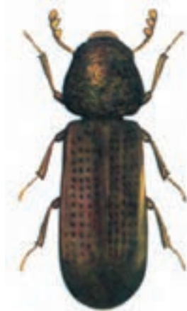
شکل ۱۲-۳- ریزوپرتا

۵- ریزوپرتا: سوسکی است به طول ۲/۵ میلی‌متر و دارای رنگ قهوه‌ای مایل به عنابی براق دارای چند نسل در سال و بیشتر در نواحی گرمسیری فعالیت دارد (شکل ۱۲-۳). لاروهای جوان این حشره، به دانه‌های شکسته و آسیب دیده در اثر حمله دیگر آفات خسارت وارد می‌کنند اما در سنین بالا بیشتر از دانه‌های سالم تغذیه می‌کنند. این آفت به دانه غلات و حتی نان و بیسکویت نیز خسارت وارد می‌نماید.