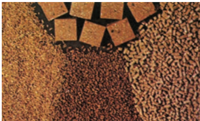
شکل ۱۶-۳- طعمۀ آماده مصرف «کلرت» به صورت‌های پلت (PELLET)، مکعبهای روغنی (WAX BLOCK) و ... برای استفاده در شرایط مختلف مناسب می‌باشد.

طرز تهیه: گندم یا ذرت یا دانه خربزه را در ظرفی ریخته روغن کتان را بتدریج روی آن بریزید و با چوب به هم بزنید تا دانه‌ها به‌طور یکنواخت به روغن آغشته گردد. سپس بتدریج فسفر دوزنگ را روی دانه‌ها بریزید به طوری که دانه‌ها به سم آغشته گردد و بلافاصله طعمه را برای کنترل مورد استفاده قرار دهید (شکل ۱۶-۳).