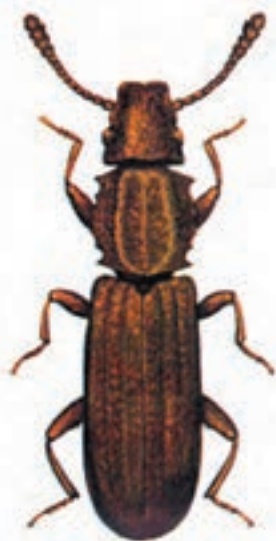
شکل ۱۰-۳ - شپشه دندان‌دار

بیشترین علاقه این آفت به برنج است اما از دیگر غلات نیز استفاده می‌نماید. ارزش غذایی برنج را از بین می‌برد و بعضی مواقع حتی محصول را غیرقابل استفاده می‌نماید.