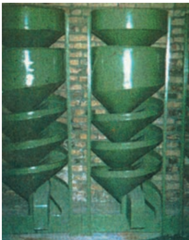
شکل ۱-۳- یک نوع دستگاه بوجاری

۵- محصول آغشته و آلوده به حشرات و امراض برای کنترل رطوبت و حرارت قبل از انبار کردن می توان با برداشت بموقع، هوا دادن و حمل بموقع محصول تا حدود زیادی شرایط مساعد را فراهم نمود. اما برای حذف قسمتهای زاید و اضافی فیزیکی (سنگ ریزه، شن) و بیولوژیکی (دانه های خرد، اندامهای سبز گیاهی، بذر و علفهای هرز) از عملیات بوجاری برای خالص کردن محصول استفاده می شود. در بوجاری به روش ساده از الک و غربال و در بوجاری مکانیزه از دستگاههای بوجاری بهره گیری می شود. اساس کار این دستگاهها مبتنی بر عبور دانه از تمیزکننده های غربالی مجهز به جریان باد است که طی این فرایند، علفهای هرز، دانه های شکسته و اندامهای گیاهی غیر محصول، ذرات جامد سنگ ریزه و گرد و خاک از محصول جدا می شود (شکل ۱-۳).