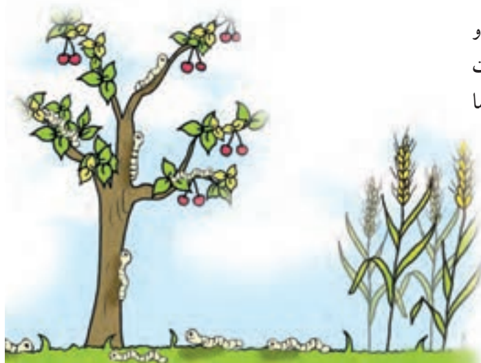
شکل ۳-۴- افزایش آفات و بیماریها

۳- افزایش آفات و بیماریها: کشت ممتد یک گیاه باعث تجمع آفات و بیماریهای بخصوصی با توجه به شرایط مساعد و وجود میزبان مناسب در طول سالهای پی‌پی خواهد شد مثل آفت کرم ساقه‌خوار برنج یا بوته میری جالیز (حداقل دو مثال نیز شما ارائه نمایید) (شکل ۳-۴).