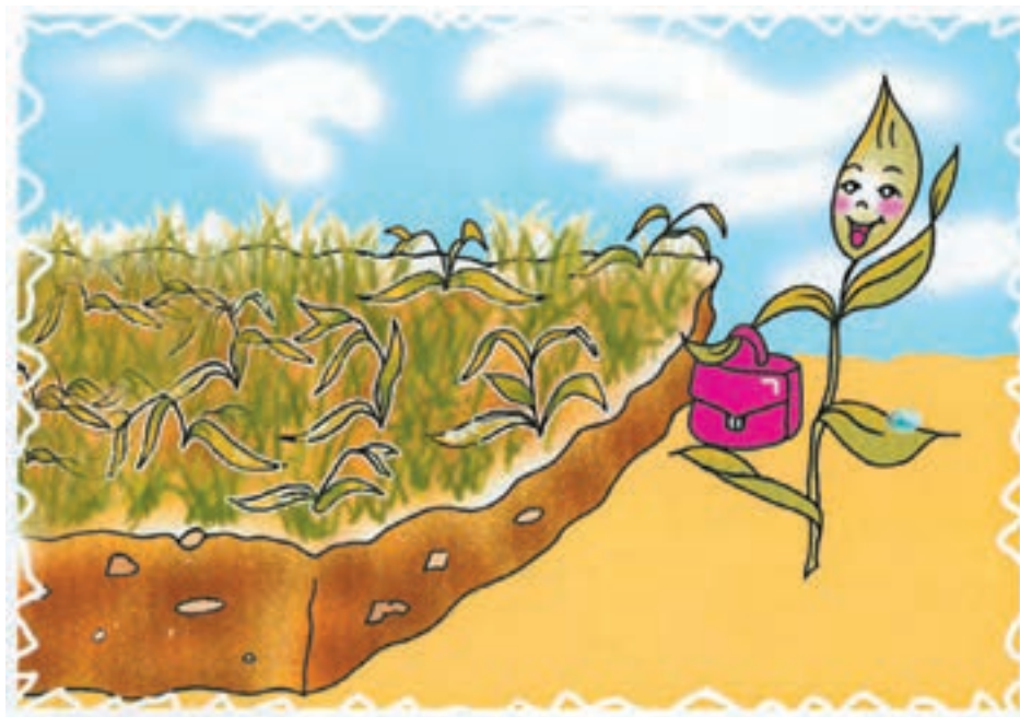
شکل ۲-۴- استقبال زمین از گیاه جدید

در گذشته و در زراعت سنتی، کشت گیاهان در یک زمین زراعی به صورت پیاپی و ممتد انجام می‌شد مثلاً اگر برای مدت طولانی فقط کشت گندم یا در بعضی مناطق فقط کشت برنج و ... بر روی یک زمین صورت گیرد. این استفاده از یک نوع محصول، «زراعت یکطرفه» یا «تک محصولی» و یا