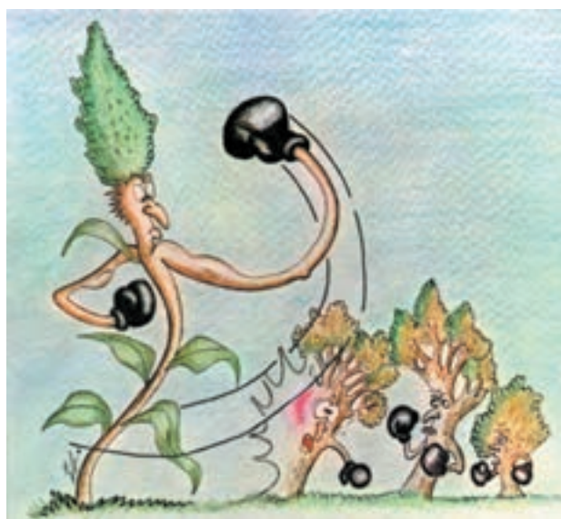
شکل ۴-۴- غلبه علف هرز بر بعضی از گیاهان

۴- افزایش علفهای هرز: در اثر کشت تک محصولی، علفهای هرز گیاهان میزبان به نحو مؤثری افزایش می‌یابد. در حالی که با تغییر گیاه میزبان شرایط مناسب رشد علفهای هرز نیز از بین خواهد رفت مثلاً رشد و توسعه یولاف در کشت ممتد گندم (مثال دیگری را شما ارائه نمایید) (شکل ۴-۴).