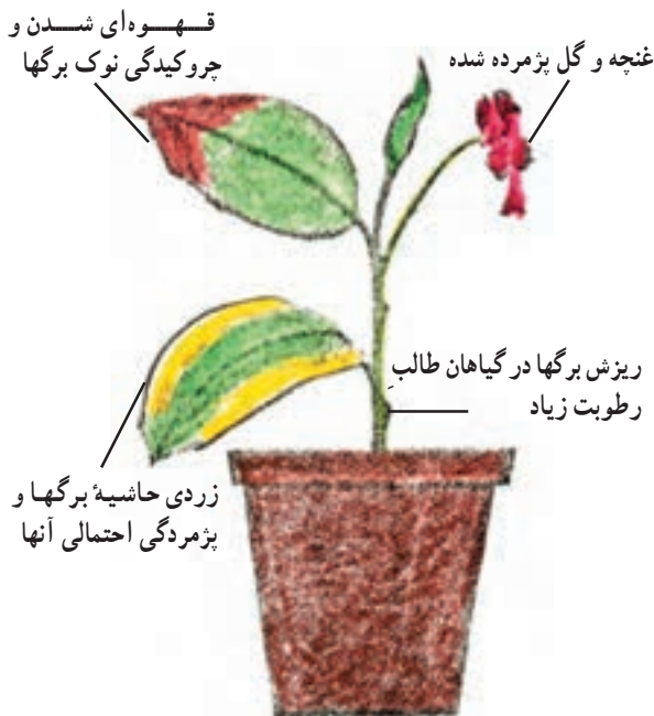
شکل ۱-۵۳ - علایم و خسارات کمبود در رطوبت نسبی هوا بر روی گیاهان آپارتمانی

– پاشیدن آب در هنگام عصر یا شب باعث می شود تا آب بر روی گیاه باقی بماند و تبخیر نشود و از تبادلات گیاه با محیط خارج جلوگیری کند.