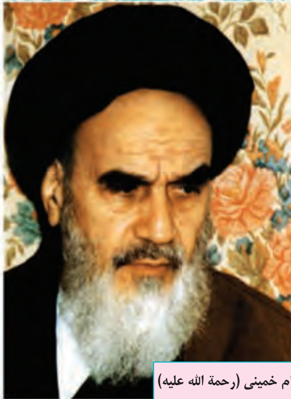
امام خمینی (رحمة الله عليه)

فرزندان عزیزم، امید است با نشاط و خرمی درس‌هایتان را خوب بخوانید و در همان حال، به وظایف اسلامی که انسان‌ها را می‌سازد، عمل کنید و اخلاق خود را نیکو کنید و اطاعت و خدمت پدران و مادرانتان را غنیمت شمارید.