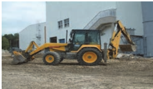
شکل ۶- بکهولودر