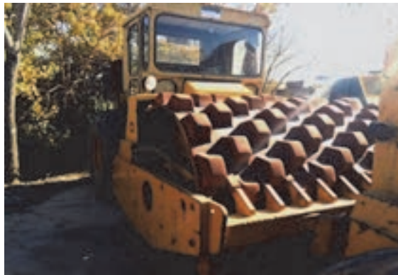
شکل ۱۲- غلتک پاچه بزی