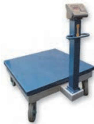
شکل ۳۰- باسکول الکترونیک