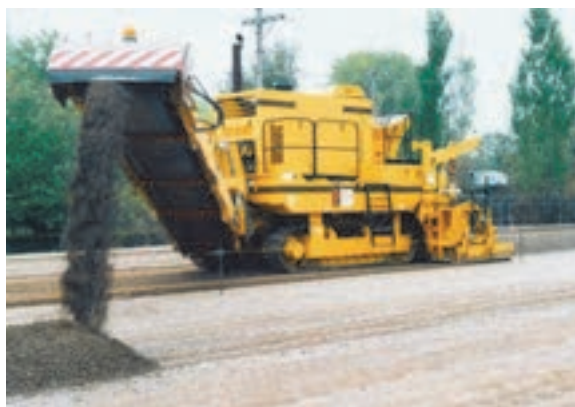
شکل ۱۵- تریمر

مهم‌ترین کاربرد این دستگاه کندن لایه‌های آسفالتی و یا بتنی است. از تریمرها برای ترمیم پوشش آسفالتی و یا بتنی جاده‌ها استفاده می‌شود. همچنین این ماشین قادر است پس از ترمیم کردن مسیر پیش روی خود پس مانده‌های کنار شانه راه را جمع‌آوری نماید. این دستگاه همچنین توانایی شیب دادن به راه و تثبیت خاک را نیز دارد.