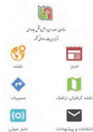
شکل ۳۶- نمایی از نرم افزار سامانه جامع اطلاع رسانی ۱۴۱

در ایران وبگاه و نرم‌افزار سامانه جامع اطلاع‌رسانی ۱۴۱ ( www.141.ir ) یکی از سامانه‌های مدیریت ترافیک جاده‌ای و راه می‌باشد. مرکز مدیریت راه‌های کشور واقع در سازمان راهداری و حمل‌ونقل جاده‌ای پس از کسب اطلاع از وضعیت ترافیک و شرایط جوی در تمامی ساعات شبانه‌روز از طریق تجهیزات هوشمند موجود مانند تردد شمارها، سامانه تشخیص بلوتوث، دوربین‌های نظارتی و شناسه‌گری و ... به تجزیه و تحلیل اطلاعات حاصله می‌پردازد. اطلاعات آخرین وضعیت جوی محور، آخرین وضعیت ترافیکی در محورهای مورد درخواست کاربر، بهترین و مناسب‌ترین مسیر برای تردد و سفر بین یک مبدأ و مقصد انتخابی، اعلام زمان سفر در برخی از محورهای مهم کشور، محدودیت‌های ترافیکی برای رانندگان وسایل نقلیه سنگین و سبک، کارگاه‌های جاده‌ای در حال برگزاری، مسیرهای مسدود، موقعیت مکانی امکانات بین راهی شامل: مجتمع‌های خدمات رفاهی، امداد فنی خودرو، پمپ بنزین، مسجد، پایگاه‌های اورژانس و مراکز درمانی و مراکز اقامتی رسمی، راهدارخانه‌ها در این سامانه در دسترس می‌باشد.