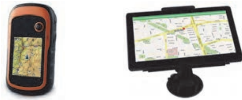
شکل ۳۸- دستگاه جی پی اس (ردیاب ماهواره‌ای)

سامانه‌های ماهواره‌ای و ردیاب برای تعیین موقعیت ناوگان بوده که از طریق آن پلیس، شرکت حمل و نقل و سایر افراد لازم، می‌توانند اطلاعات مورد نیاز خود از ناوگان در حال سفر در جاده را به صورت دقیق، اخذ کنند.