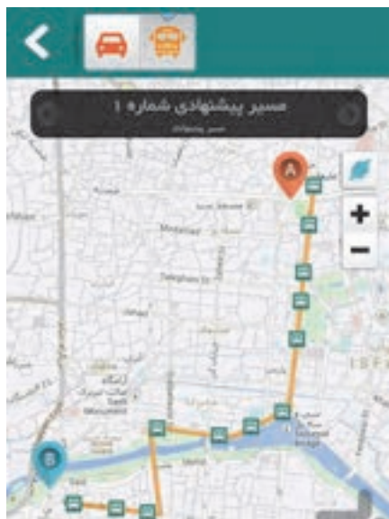
شکل ۳۹- مسیر یاب هوشمند- ارائه بهترین مسیر

سامانه‌های هوشمند حمل‌ونقل که ذیل فن‌آوری‌های هوشمند قرار می‌گیرد، دانشی میان‌رشته‌ای بوده و شامل علوم مهندسی الکترونیک، مهندسی مخابرات و سیستم‌های رادیویی، ارتباطات و فن‌آوری اطلاعات، مهندسی کامپیوتر و انفورماتیک، برنامه‌ریزی حمل‌ونقل، مهندسی سازه، مهندسی راه و مهندسی ترافیک و مانند آن می‌باشد. استفاده از سیستم‌های هوشمند در حمل‌ونقل دارای مزایای بسیاری مانند کنترل و ارزیابی عملکرد، کاهش زمان و ارتقای کیفیت و بهره‌وری فعالیت‌ها، افزایش ایمنی، بهینه‌سازی ناوگان، مدیریت منابع انسانی و کاهش هزینه‌ها خواهد شد. سیستم‌های حمل‌ونقل هوشمند برای مقاصد مختلفی به کار گرفته می‌شود که در ادامه به بخشی از آنها اشاره شده است: