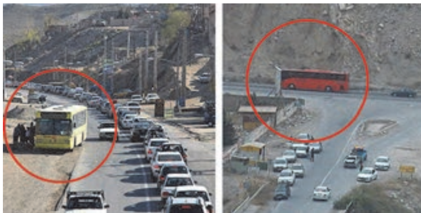
شکل ۳۷- نمای دوربین‌های نظارتی

به منظور کنترل عبور و مرور و همچنین ثبت تخلفات توسط پلیس راهنمایی و رانندگی، شهرداری‌ها در داخل شهرها و وزارت راه و شهرسازی در خارج از شهرها، اقدام به تهیه، نصب و نگهداری تجهیزات کنترل و نظارت می‌نمایند. در حمل و نقل از تجهیزات عکس برداری، فیلم برداری و سامانه‌های ماهواره‌ای و ردیاب استفاده می‌شود. عکس برداری و فیلم برداری به منظور ثبت عبور یک خودرو از یک مکان معین یا ثبت مشخصاتی مانند سرعت آن استفاده می‌شود.