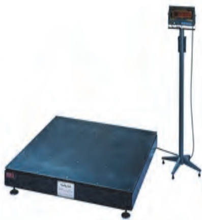
شکل ۳۲- باسکول کفه‌ای