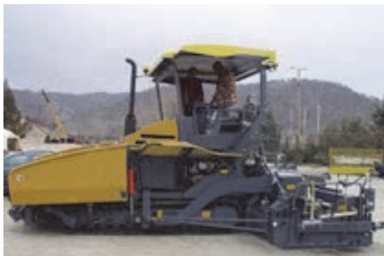
شکل ۱۴- فینیشر چرخ زنجیری