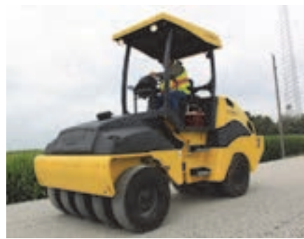
شکل ۱۰- غلتک چرخ لاستیکی

غلتک‌های پاچه‌بزی برای متراکم کردن و کوبیدن خاک‌های چسبیده نظیر رس، رس لای‌دار و رس ماسه‌دار استفاده می‌شود. غلتک‌های لرزنده عمل مرتعش کردن دانه‌های خاک را ضمن کوبیدن آنها انجام می‌دهند. تخماق‌ها نیز مانند صفحات و کفشک‌های لرزنده برای کوبیدن خاک در محل‌هایی که نمی‌توان از غلتک‌های بزرگتر استفاده کرد به کار می‌رود.