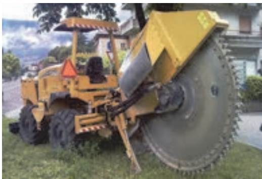
شکل ۱۸- دستگاه برش آسفالت ماشینی

از این وسیله برای برش سطح آسفالت خیابان‌ها، جاده‌ها به منظور انجام عملیات خاص و یا ترمیم آسفالت استفاده می‌شود. مزیت برش قبل از کندن آسفالت آن است که آسفالت سطح کناری منطقه برش مورد نظر دست نخورده باقی می‌ماند. اما در غیر این صورت آسفالت کنار منطقه مورد نظر در حین کندن آسیب می‌بیند. به علاوه اینکه کندن آسفالت کامل بسیار مشکل‌تر است و نیاز به صرف نیرو و وقت بیشتری دارد. همچنین از این ماشین برای کندن سطوح کوچک از آسفالت نیز استفاده می‌شود. این وسیله در سه نوع اتصالی ( به صورت یک قطعه مجزا و قابل نصب)، دستی و ماشینی مورد استفاده قرار می‌گیرد.