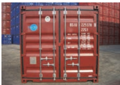
شکل ۳۵- شماره گذاری (کد شناسایی) روی کانتینرها

کانتینرها به دلیل حمل و نقل سریع و راحت این قابلیت را دارد که در هر کجای این جهان به خاطر اندازه‌های استانداردش مورد استفاده قرار گیرد. ساختار مخصوص کانتینر، وسایل نقلیه کانتینری و تجهیزات مربوط به تخلیه و بارگیری کانتینر، جابه‌جایی آن را سریع و آسان می‌کند. کانتینرها به دو دسته کانتینرهای ۲۰ فوتی و ۴۰ فوتی تقسیم‌بندی می‌شوند.