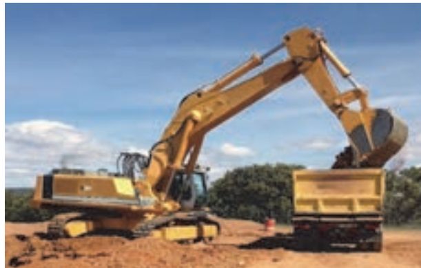
شکل ۴- بیل مکانیکی چرخ زنجیری

بیل‌های مکانیکی به دو نوع چرخ لاستیکی و چرخ زنجیری موجود می‌باشند. بهتر است از بیل‌های چرخ لاستیکی برای حفاری در خاک‌های مرطوب و نرم و در سایر خاک‌ها از بیل چرخ زنجیری استفاده شود. جام‌های بیل مکانیکی با عرض‌های متفاوت وجود دارند و همچنین جام‌ها متناسب با عرض‌شان، عمق‌شان نیز تغییر می‌کند.