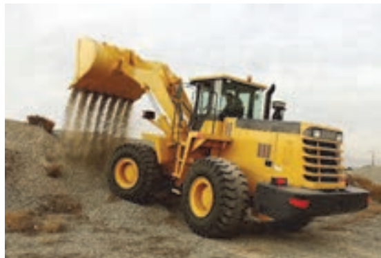
شکل ۱- لودر چرخ لاستیکی و چرخ زنجیری