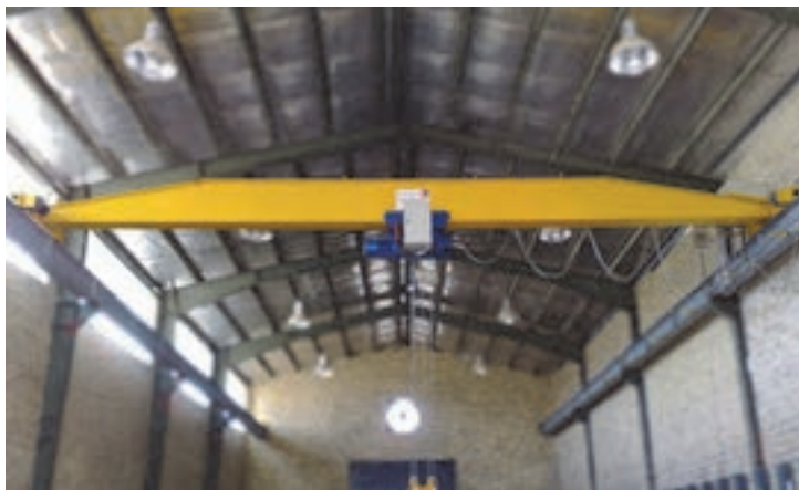
شکل ۲۱- نمایی از جرثقیل سقفی (تک پل)

■ جرثقیل برجی (پایه ثابت): این نوع جرثقیل معمولاً در ساختمان‌های مرتفع مورد استفاده قرار می‌گیرد. جرثقیل برجی (تاور کرین) نوعی جرثقیل برج‌سازی است که اجسام سنگین را جابه‌جا می‌کند. اغلب تاور کرین جسم سنگین را تا ارتفاع معینی بالا برده و سپس اقدام به جابه‌جایی آن در شعاع‌های گوناگون می‌کند. این جرثقیل به سه دسته ثابت، متحرک و بالا رونده تقسیم می‌شود.