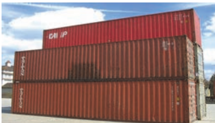
شکل ۳۴- کانتینر