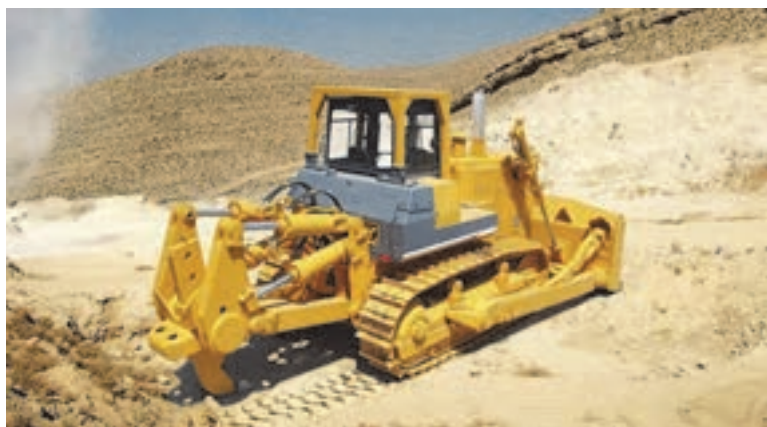
شکل ۸- ریبر