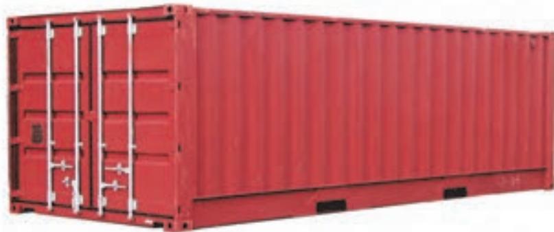
شکل ۳۳- کانتینر

کانتینر (بارگنج) از مهم‌ترین تجهیزات ایجاد شده در رابطه با حمل‌ونقل بار، در چند قرن اخیر است. اهمیت کانتینر به علت پیچیدگی یا فن‌آوری آن نیست؛ بلکه به دلیل مزایای حاصل از آن است.