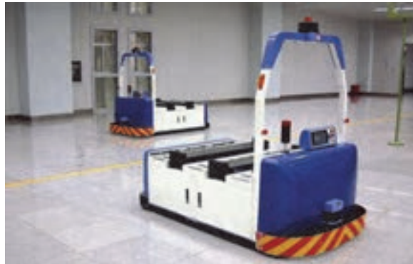
شکل ۲۸- ماشین اتوماتیک هدایت شونده با لیزر

■ ماشین‌های اتوماتیک حمل و جابه‌جایی ماشین‌هایی که توسط کامپیوتر برنامه‌ریزی می‌شوند و به طور خودکار عملیات انتقال کالا را در کارخانجات و یا کارگاه‌ها انجام می‌دهند. این نوع تجهیزات به سه دسته تقسیم‌بندی می‌شوند: