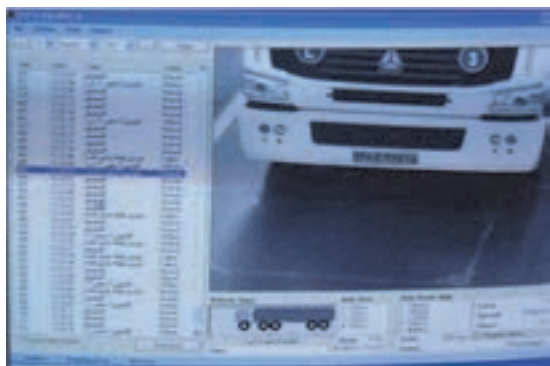
شکل ۴۰- نرم افزار دوربین ثبت تخلف

■ ثابت سفارش: یکی از مهم‌ترین بخش‌های سامانه‌های باربری، بخش سفارش‌ها است که در آن اطلاعات بار، حمل‌کننده، راننده، شرکت و پایانه حمل‌ونقل ثبت می‌شود. امروزه فعالیت‌هایی مانند انجام امور روزانه صدور بارنامه و صورت وضعیت به طور الکترونیک انجام می‌شود تا هم مدیریت حجم وسیعی از اطلاعات ساده‌تر شده و هم هزینه‌های ناشی از آنها حداقل گردد. ■ مسیریابی بهینه: یکی از ارکان حمل‌ونقل در شهرهای بزرگ و پرجمعیت جهان، مسیریابی است. وسایل نقلیه باید بتوانند در هر ساعت از روز بهترین مسیر را از نظر مسافتی و سبک بودن ترافیک، برای رسیدن به مقصد پیدا کنند. برای حل این مسئله و رسیدن به این هدف، سامانه‌های الکترونیکی بسیاری که اطلاعات ترافیکی را درون خود جای داده‌اند به‌وجود آمده و در حال استفاده و پیشرفت هستند.