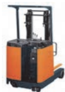
شکل ۲۵- ریچتراک