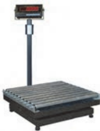
شکل ۳۱- باسکول غلتکی