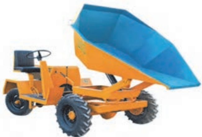
شکل ۹- دامپر

دامپرها یکی از تجهیزات حمل مصالح در کارگاه‌ها در مقیاس کوچک و در مسافت‌های محدود هستند. شیوه کار دامپرها شباهت زیادی با روش قدیمی استفاده از فرغون دارد، با این تفاوت که نیروی محرکه آنها به جای عامل انسانی توسط موتور تأمین می‌گردد. دامپرها امروزه در ظرفیت‌های مختلفی تا ۹ تن ساخته می‌شوند و موتور آنها نیز همانند بقیه وسایل نقلیه از نوع دیزلی می‌باشد. این ماشین‌ها می‌توانند در زمین‌های ناهموار نیز کارایی داشته باشند، ولی ترجیح داده می‌شود برای استهلاک کمتر همواره مسیر رفت و آمد دامپر با کیفیت مناسب وجود داشته باشد.