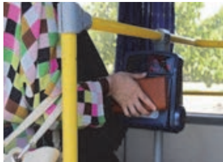
شکل ۴۱- پرداخت الکترونیک در تاکسی و اتوبوس

■ سیستم‌های اطلاع‌رسانی به مشتریان: از قبیل معرفی برنامه‌های فروش محصولات و خدمات مسافرتی، فروش بلیت‌های رفت و برگشت روزانه برای مشتریان، تعیین نوع و ویژگی‌های ناوگان و غیره صورت می‌گیرد. با داشتن زیرساخت اطلاعاتی یکپارچه و کامل، می‌توان اطلاعات را به‌صورت‌های مختلف در اختیار مشتریان قرار داد و شرکت‌ها و دست‌اندرکاران می‌توانند از وضعیت آگاه باشند و به گزارش‌های دلخواه دست یابند. مسافر نیز می‌تواند از منزل برنامه‌ریزی سفر خود را انجام دهد. بلیت تهیه کند و برنامه‌ریزی لازم برای ادامه مسیر خود تا مقاصد بعدی را انجام دهد. اینترنتی کردن خرید بلیت به جایگزینی مطمئن و آسان برای تهیه بلیت به جای شیوه مراجعه حضوری، تبدیل شده است.