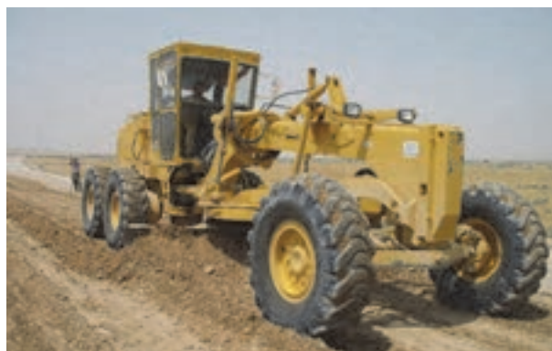
شکل ۳- گریدر

از گریدر برای پخش خاک، تنظیم شیب سطح راه، ایجاد شانه‌های دو طرف راه، مخلوط کردن انواع خاک با هم، پخش آسفالت و برف‌روبی استفاده می‌شود. گریدر قادر است خاک را به کنار مسیر حرکت خود جابه‌جا نماید و این امر با تغییر زاویه تیغه گریدر میسر می‌شود. به منظور شکل دادن به جاده و عملیات ترمیم و نگهداری جاده‌ها معمولاً زاویه تیغه گریدر با امتداد عمود بر امتداد حرکت حدود ۲۵ تا ۳۰ درجه تنظیم می‌گردد.