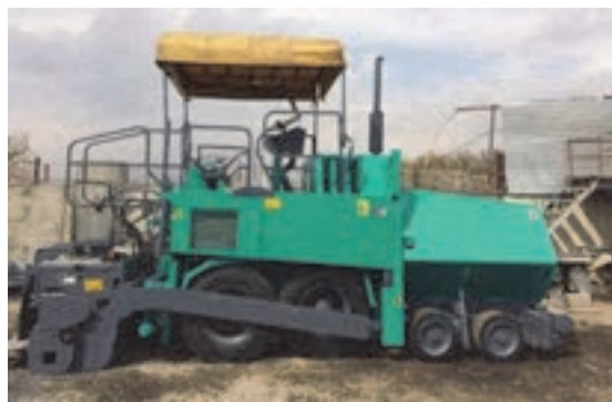
شکل ۱۳- فینیشر چرخ لاستیکی

از فینیشر در ساخت خیابان‌ها، اتوبان‌ها، جاده‌ها، پارکینگ‌ها، باند فرودگاه استفاده می‌گردد. فینیشرها دارای دو نوع چرخ لاستیکی و چرخ زنجیری می‌باشند.