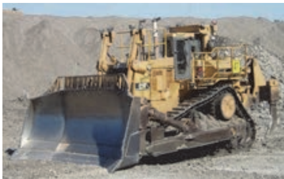
شکل ۲- بولدوزر