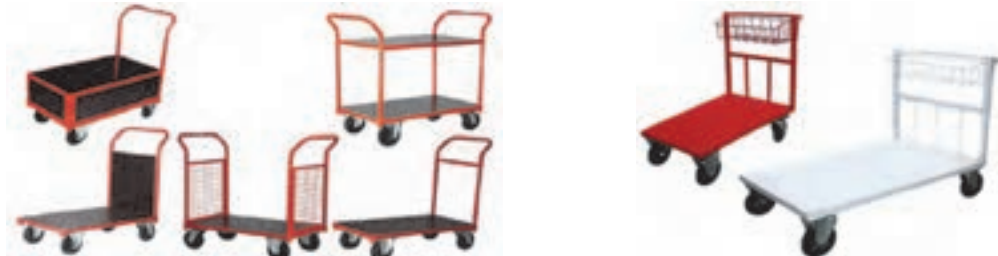
شکل ۲۶- انواع چرخ دستی

از چرخ (گاری) دستی برای حمل و جابه‌جایی بار در کارخانه و کارگاه‌ها استفاده می‌گردد. همچنین وجود گاری در انبارها ضروری است و یکی از پرکاربردترین تجهیزات برای جابه‌جایی‌های کوچک می‌باشد.