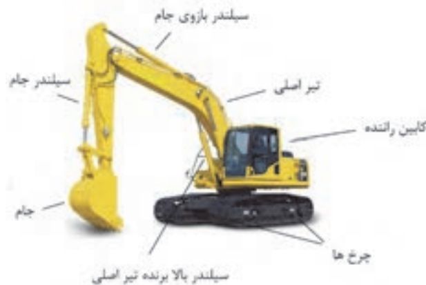
شکل ۵- قسمت‌های مختلف بیل مکانیکی

بیل‌های مکانیکی به دو نوع چرخ لاستیکی و چرخ زنجیری موجود می‌باشند. بهتر است از بیل‌های چرخ لاستیکی برای حفاری در خاک‌های مرطوب و نرم و در سایر خاک‌ها از بیل چرخ زنجیری استفاده شود. جام‌های بیل مکانیکی با عرض‌های متفاوت وجود دارند و همچنین جام‌ها متناسب با عرض‌شان، عمق‌شان نیز تغییر می‌کند.