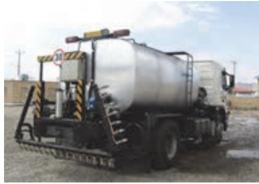
شکل ۱۶- نمونه‌های ماشین قیرپاش