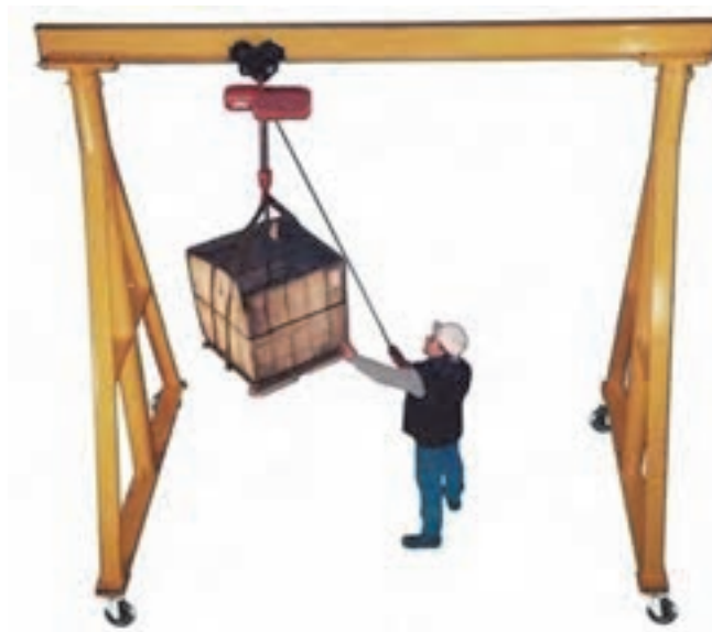
شکل ۲۴- جرثقیل دستی

که انسان به تنهایی قادر به جابه‌جایی آن نیست را به راحتی و بدون دخالت برق و فقط با نیروی انسانی جابه‌جا کند.