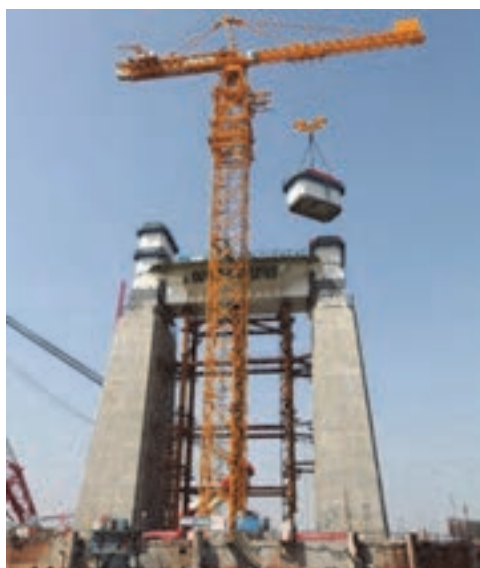
شکل ۲۳- نمایی از جرثقیل برجی (پایه ثابت)

■ جرثقیل برجی (پایه ثابت): این نوع جرثقیل معمولاً در ساختمان‌های مرتفع مورد استفاده قرار می‌گیرد. جرثقیل برجی (تاور کرین) نوعی جرثقیل برج‌سازی است که اجسام سنگین را جابه‌جا می‌کند. اغلب تاور کرین جسم سنگین را تا ارتفاع معینی بالا برده و سپس اقدام به جابه‌جایی آن در شعاع‌های گوناگون می‌کند. این جرثقیل به سه دسته ثابت، متحرک و بالا رونده تقسیم می‌شود.