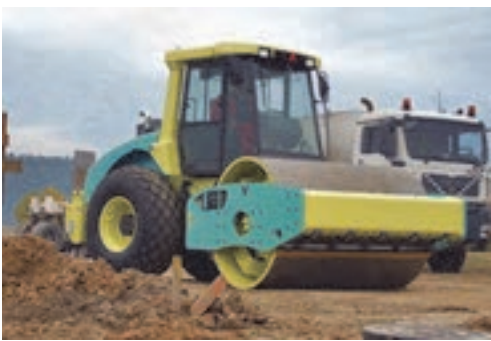
شکل ۱۱- غلتک چرخ فولادی

غلتک‌های چرخ لاستیکی خاک‌ها را با ورز دادن متراکم می‌کنند و از این رو برای کوبیدن خاک‌های ماسه‌ای، رس‌ها، لای‌ها و یا مخلوطی از آنها بسیار مناسب هستند. غلتک‌های چرخ فولادی برای کوبیدن و متراکم کردن خاک‌های دانه‌ای نظیر شن و ماسه و سنگ شکسته مناسب می‌باشند.