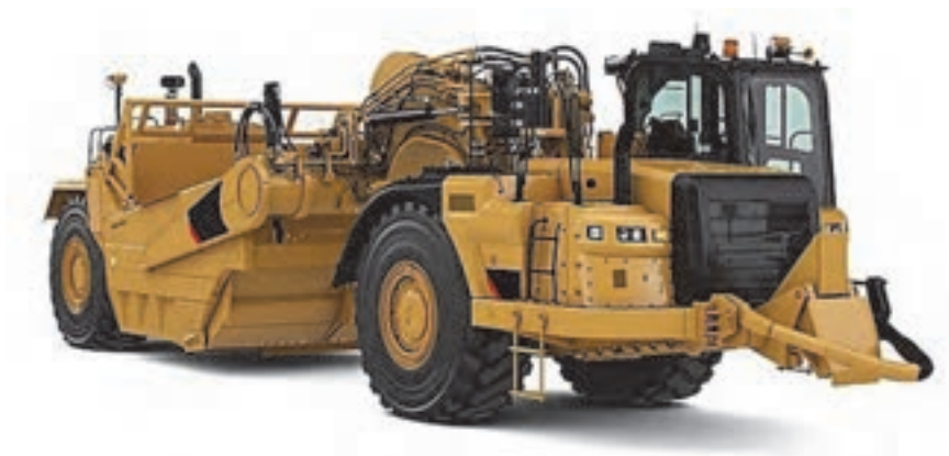
شکل ۷- اسکریپر

اسکریپرها ماشین‌آلاتی هستند که برای کندن، بارگیری، حمل، تخلیه، پخش و تراکم اولیه مواد خاکی به کار می‌روند. این دستگاه‌ها به عنوان یکی از بهترین ماشین‌های بارگیری و حمل شناخته می‌شوند. اسکریپرها قادرند مسافت ۵۰۰ متر تا ۵ کیلومتر را برای حمل خاک طی کنند. از اسکریپر می‌توان برای برش و انتقال تمام خاک‌ها به جز خاک‌های دارای قلوه سنگ استفاده کرد.