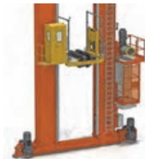
شکل ۲۷- انواع استکر