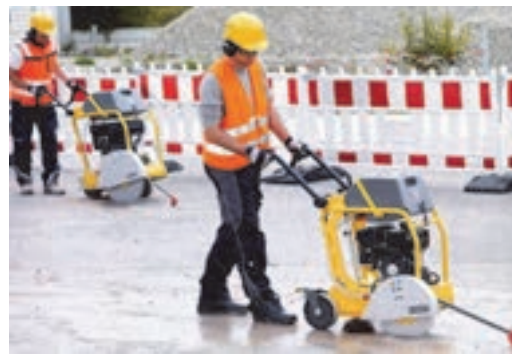
شکل ۱۷- دستگاه برش آسفالت دستی