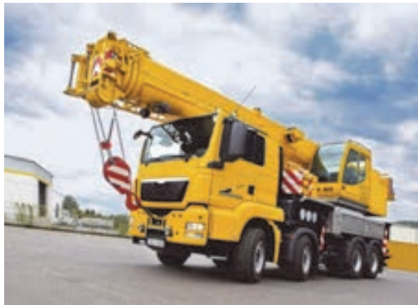
شکل ۱۹- نمایی از جرثقیل ماشینی

وسیله‌ای است که بار را در راستای قائم با ترکیب شش جهت حرکتی جابه‌جا می‌کند. به‌طور کلی جرثقیل برای جابه‌جایی بارها مورد استفاده قرار می‌گیرد. اما جرثقیل‌ها انواع گوناگونی دارند و برای کارهای مختلف از جرثقیل‌های مختلف استفاده می‌شود. بیشترین موارد استفاده از جرثقیل در ساخت پروژه‌های عمرانی و صنعتی (انبارها، کارخانه‌ها و ...) است.