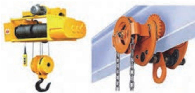
شکل ۲۰- جرثقیل سقفی

■ جرثقیل سقفی: از این نوع جرثقیل در سالن‌های صنعتی و تولیدی و یا سایر خطوط (انبار، تعمیرگاه و ...) در ارتفاع و برای جابه‌جایی و حمل کالا استفاده می‌شود. عموماً به دو شکل جرثقیل سقفی تک پل و جفت پل مورد استفاده قرار می‌گیرند.