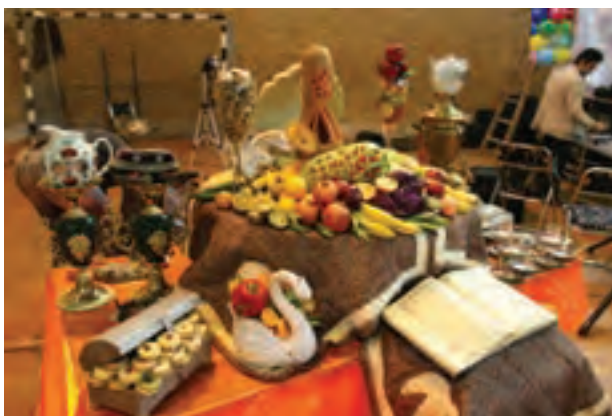
▲ تصویر ۱۰۵