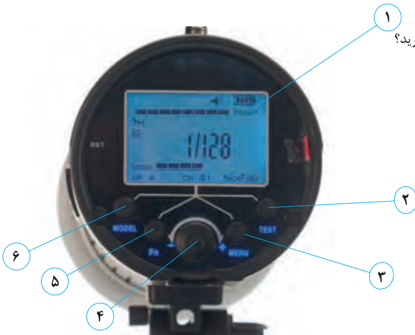
تصویر ۸۶ ▲