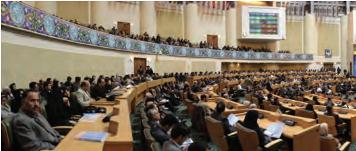
▲ تصویر ۶۱

۳- وضعیت سالن و مدعوین: در بسیاری از مراسم و آئین‌ها، مدعوین معمولاً به صورت پراکنده در سالن مستقر می‌شوند. این پراکندگی، عکاس را برای تهیه عکس‌های مناسب و ایده‌آل با مشکلاتی مواجه می‌سازد. در برخی موارد می‌توان با کمی جابجایی و بالا و پایین شدن و یا به چپ و راست حرکت کردن و یا استفاده از لنزهای مختلف عکاس این مشکل را حل می‌کند. در چنین وضعیتی در صورت امکان، بهتر است عکاس، نحوه نشستن مدعوین و ساماندهی سالن را با همکاری مجریان و مسئولان ذی‌ربط انجام دهد و سپس عکاسی را آغاز کند.