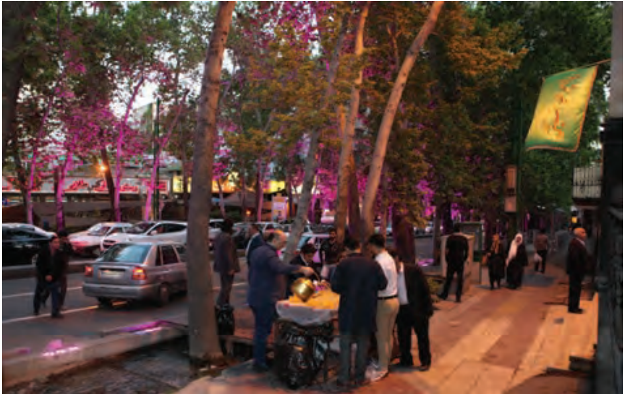
▲ تصویر ۹۹