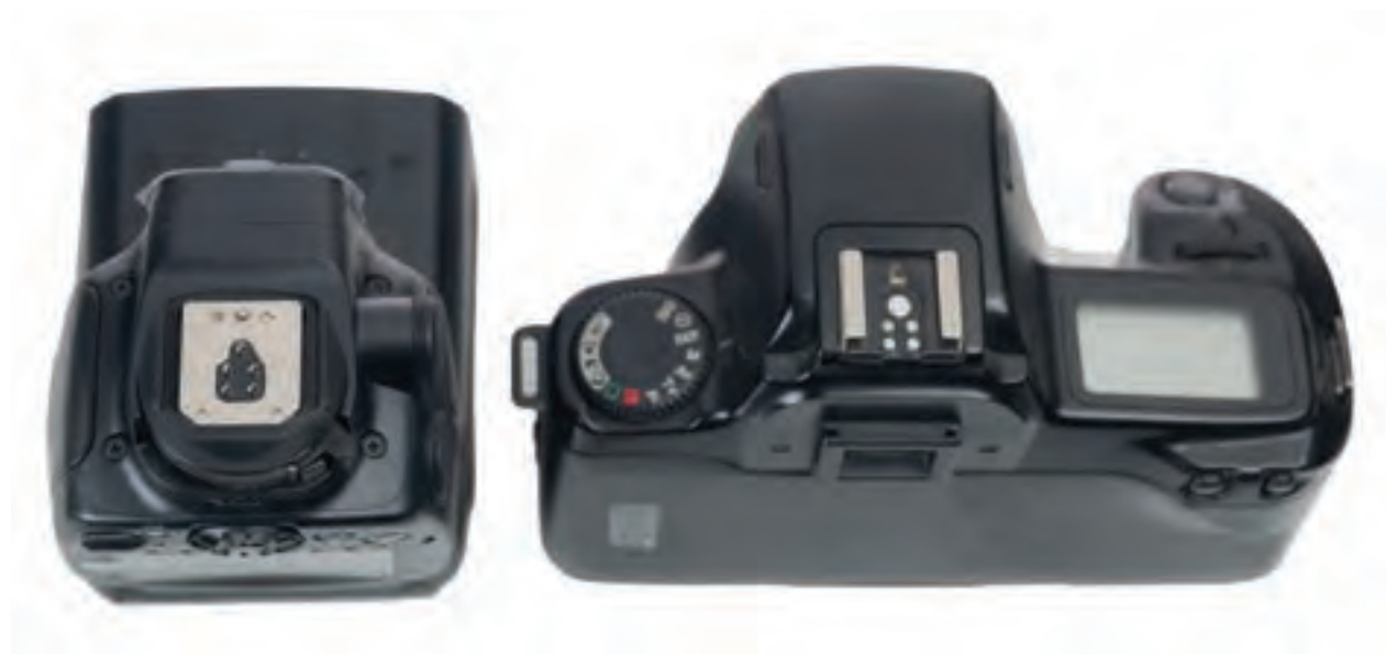
▲ تصویر ۹۰

فلاش‌های اکسترنال، توسط نقاط فلزی خاص که کانکتور نام دارند به دوربین عکاسی متصل می‌شوند و وظیفه آن‌ها برقراری ارتباط دوربین با فلاش و انتقال اطلاعات می‌باشد. این نقاط اتصال که یکی از آن‌ها که وظیفه دستور تخلیه فلاش را دارد، باقی آن‌ها را در دوربین‌های مختلف از آرایش خاصی برخوردار هستند (تصاویر ۹۰ و ۹۱). همین امر سبب می‌شود که برای هر دوربینی در برندها و مارک‌های مختلف، فلاش‌های اکسترنال مخصوص نیز تولید شود.