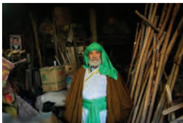
▲ تصویر ۴۹