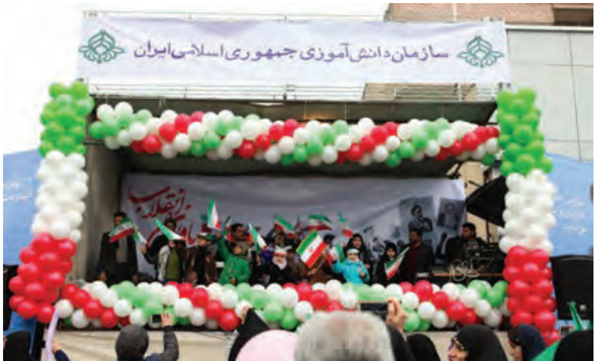
▲ تصویر ۸