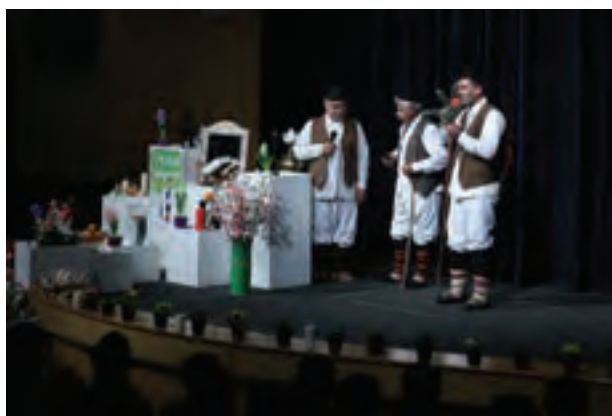
تصویر ۱۰۹ ▲

به آرشیو عکس‌های خود مراجعه کنید و با راهنمایی هنرآموز، هر کدام که نیاز به اصلاح رنگ، نور و یا کادر دارد را مشخص کرده پس از اصلاح آن‌ها را چاپ کنید و در کارگاه ارائه دهید.