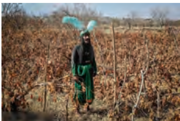
▲ تصویر ۴۸