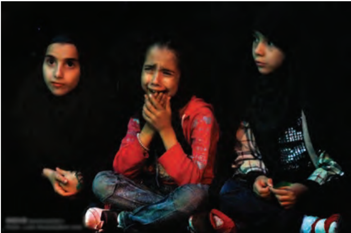
▲ تصویر ۲۳