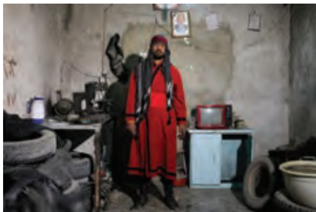
▲ تصویر ۴۵