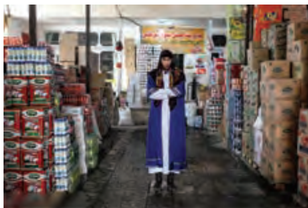
▲ تصویر ۵۱