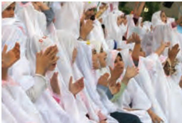
تصویر ۱۰۷ ▲

به نظر شما این عکس‌ها چه اشکالاتی دارند؟ آیا این اشکالات قابل رفع هستند؟ پیشنهاد شما برای رفع اشکال این عکس‌ها چیست؟