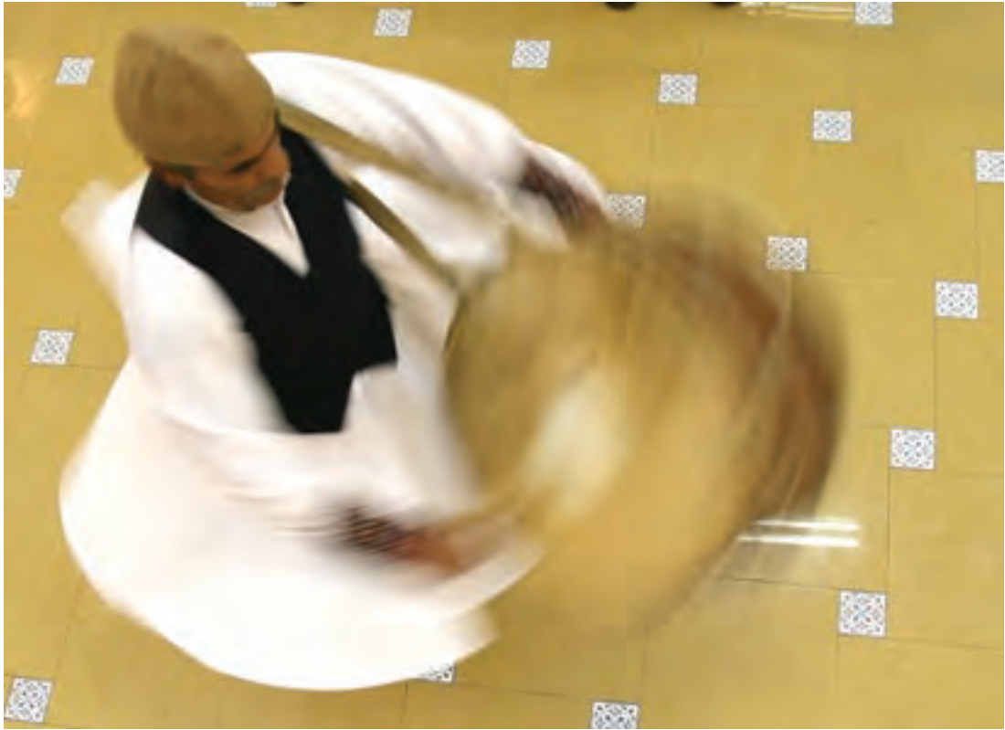
▲ تصویر ۳۲