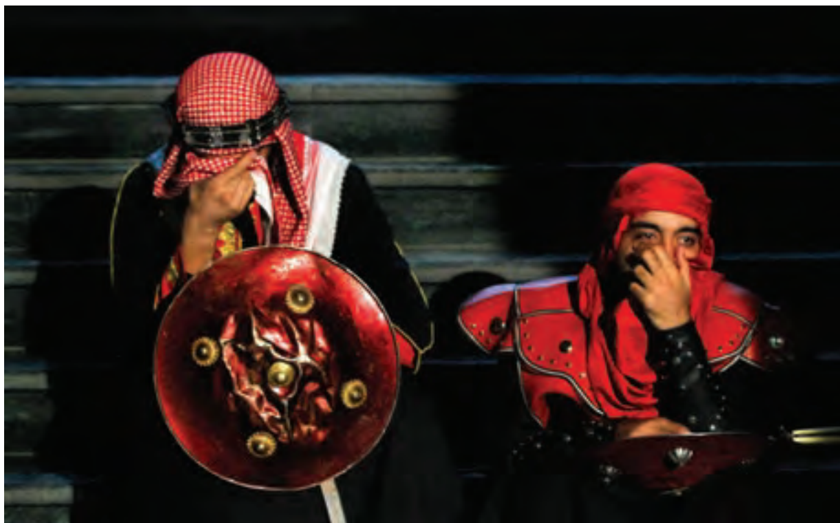
تصویر ۲۴ ▲