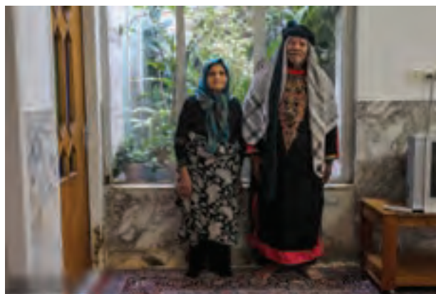
▲ تصویر ۴۷