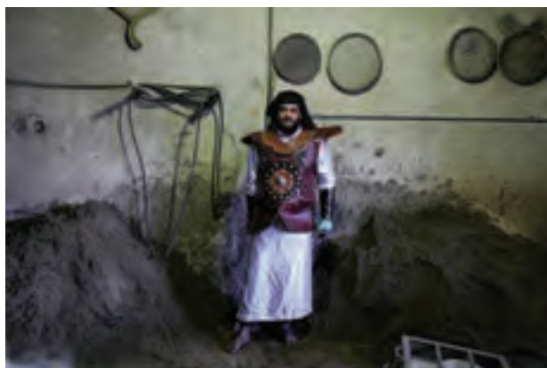
▲ تصویر ۴۳