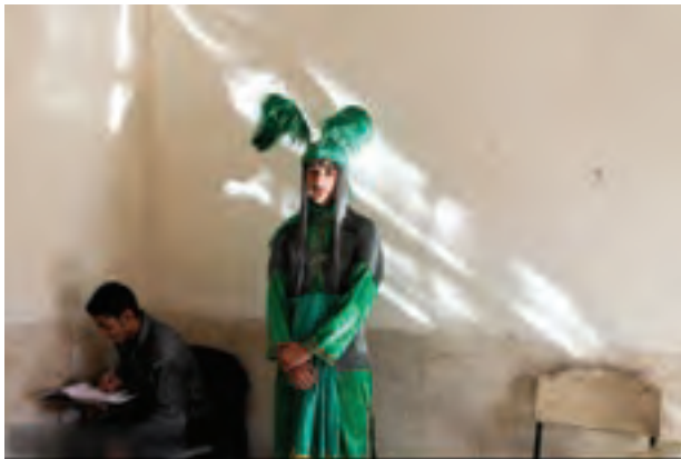
تصویر ۵۲ ▲