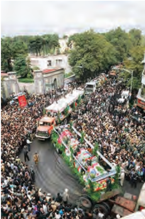
▲ تصویر ۳۴