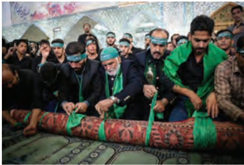
تصویر ۱ ▲

آیا می‌توانید یک تعریف ساده از جشن‌ها و مراسم آئینی در کلاس ارائه دهید؟ به عکس‌های زیر توجه کنید، آیا می‌توانید آنها را به لحاظ نوع دسته‌بندی کنید؟