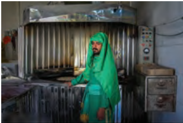
تصویر ۵۴ ▲