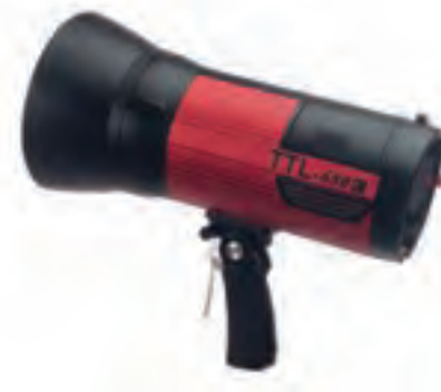
تصویر ۷۹ ▲