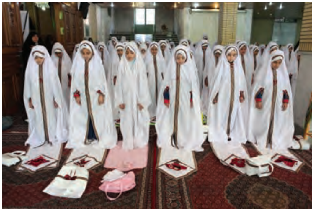
تصویر ۳۱ ▲