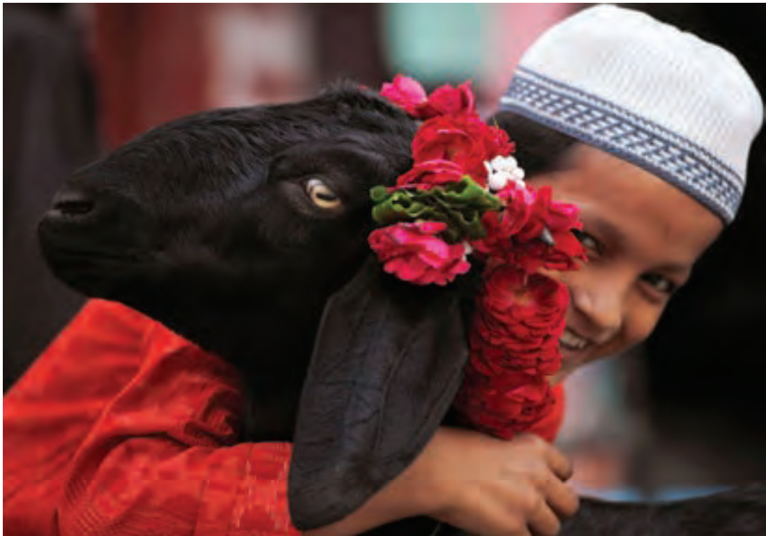
▲ تصوير ١٧