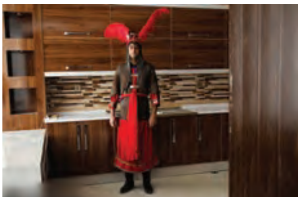
▲ تصویر ۳۸