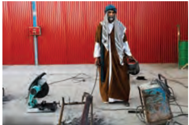
تصویر ۵۵ ▲