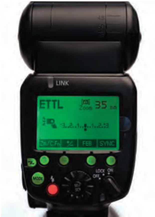
تصویر ۸۴ ▲