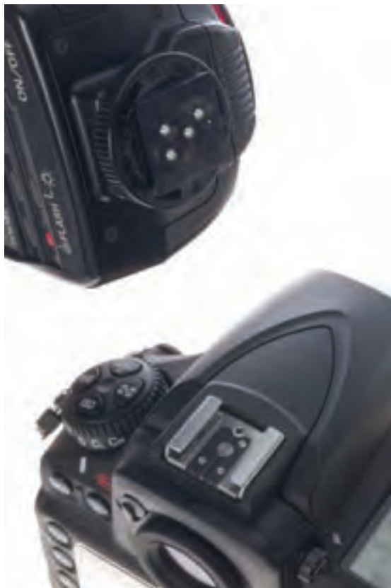
تصویر ۸۸ ▲

آیا به محل اتصال فلاش با دوربین دقت کرده‌اید؟ (تصاویر ۸۸ و ۸۹) فلاش شما چند نقطه اتصال با دوربین عکاسی دارد؟ آیا در تمامی دوربین‌های عکاسی محل نصب، نحوه اتصالات و آرایش و قرارگیری اتصالات به یک شکل است. کار این اتصالات چیست؟ به قسمت اتصال فلاش به دوربین عکاسی، پایه فلاش گفته می‌شود و محل نصب فلاش بر روی دوربین عکاسی (Hot shoes) نامیده می‌شود.