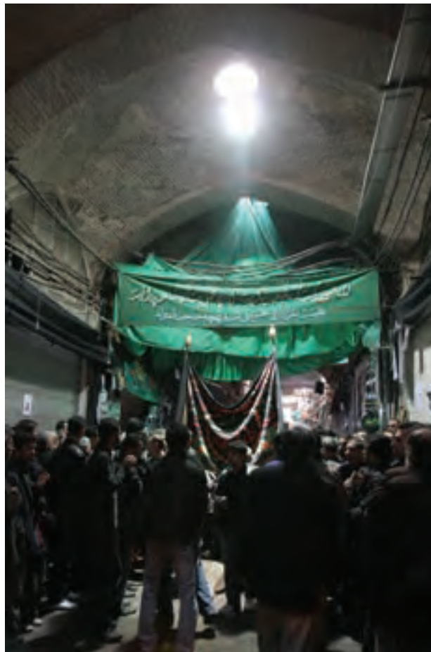
▲ تصویر ۷۱

- نمونه عکس‌هایی از مراسم آئینی و مذهبی یا جشن‌های مذهبی جمع‌آوری کنید و در کارگاه بر روی دیوار نصب کنید در کدامیک فضای معماری بیشتر دیده می‌شود و مورد توجه عکاس بوده است؟ درباره آن‌ها با یکدیگر گفت‌وگو کنید. - از مکان‌هایی در استان‌تان که معماری ویژه‌ای دارند و یا محل برگزاری آئین‌های مذهبی، ملی و ... است عکاسی کنید.