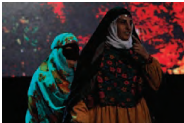
تصویر ۷۷ ▲

۱- نور: منابع نور طبیعی، یک نعمت بزرگ برای عکاسان است. شناخت منابع نور و نورپردازی مهم‌ترین عاملی است که سبب تفاوت در عکس‌ها شده و آموزش آن برای هر هنرجویی الزامی و کاربردی است.