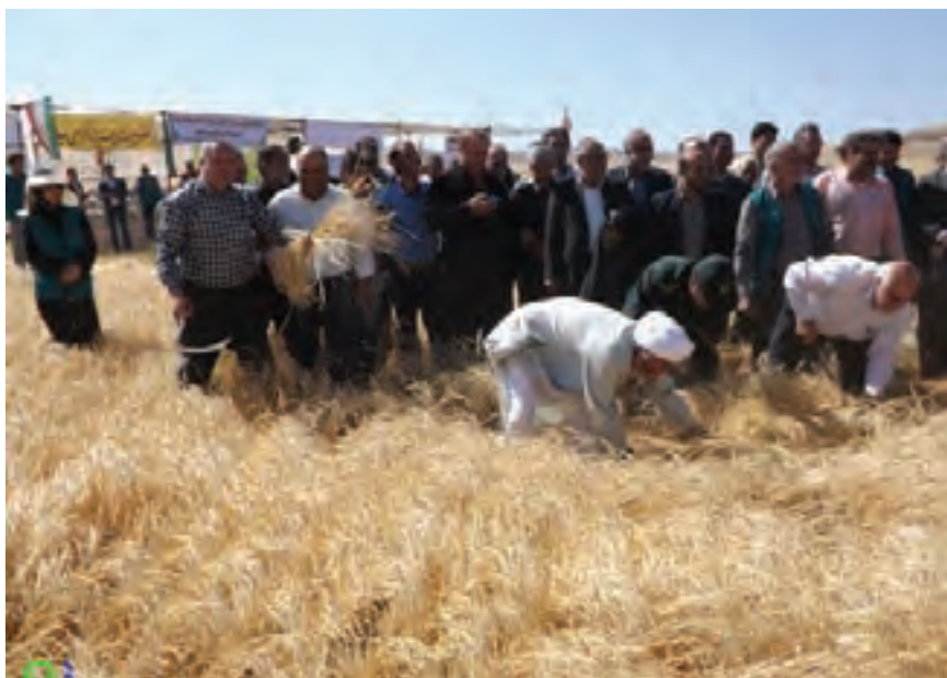
جشن گندم | تصویر ۷۳ ▲

۵- فضای باز و بسته: جشن‌ها و مراسم آئینی ممکن است در فضاهای روباز و یا سالن‌های سرپوشیده برگزار شود. در برخی مواقع در هنگام عکاسی در فضاهای باز، با تغییرات ناگهانی آب و هوا و یا بارش برف و باران مواجه می‌شویم اگر تجهیزات و لوازم جانبی مناسب به همراه نداشته باشیم، مجبور به ترک محل شده و فرایند تهیه عکس از مراسم آئینی و یا جشن متوقف خواهد شد.