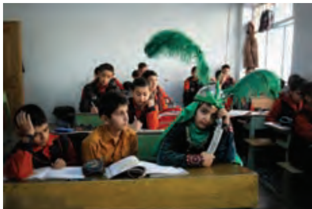
▲ تصویر ۴۰