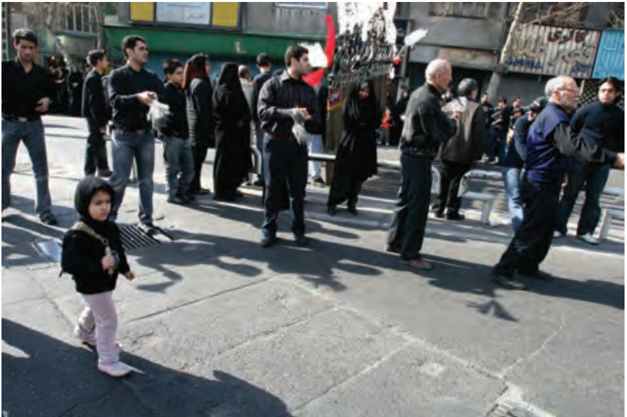
تصویر ۶۴ ▲

در عکاسی از آئین‌های مذهبی (مانند ایام عزاداری در محرم و روزهای تاسوعا و عاشورا) پراکندگی و تجمع افراد ممکن است قابل پیش‌بینی و یا ساماندهی نباشد. بنابراین عکاس در چنین مواقعی باید بهترین مکان را برای عکاسی انتخاب کند و یا همراه با جمعیت در مسیر، حرکت کرده و عکاسی کند. بدیهی است در تمام این مراحل زاویه دید مناسب، کادربندی، محاسبه نور در محیط و انتخاب سوژه‌های برتر، از دید یک عکاس حرفه‌ای نباید پنهان بماند.