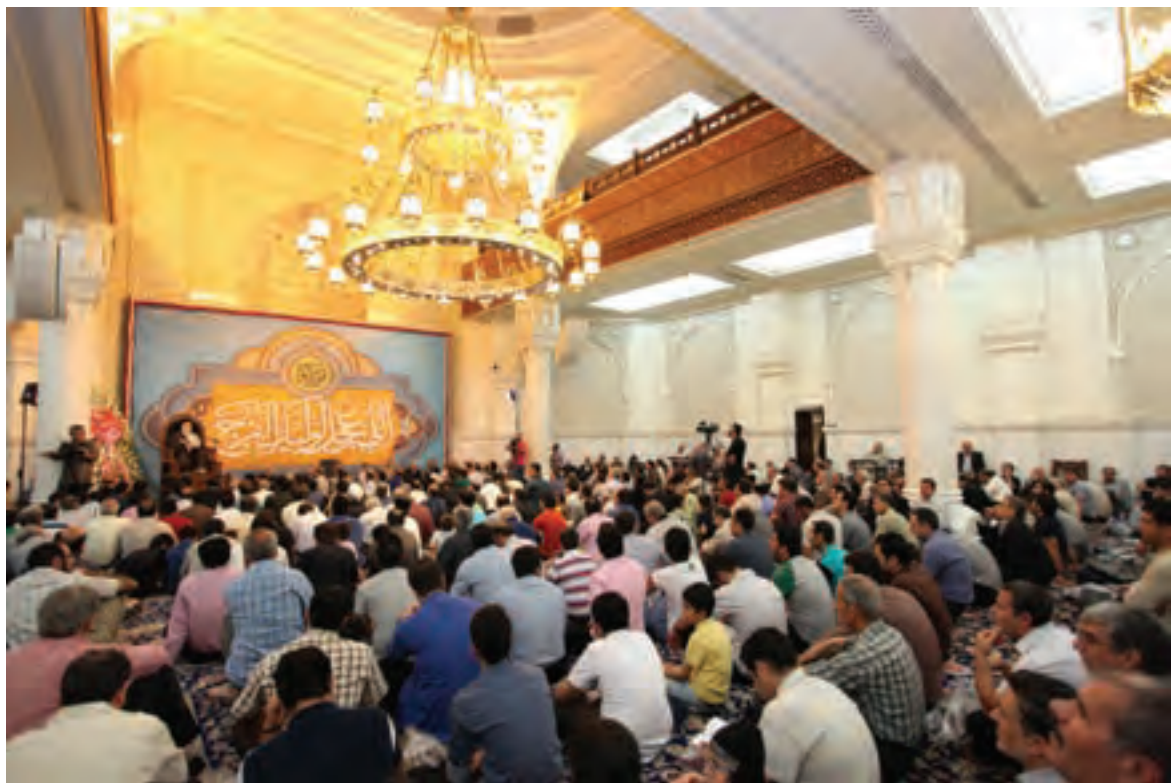
▲ تصویر ۷