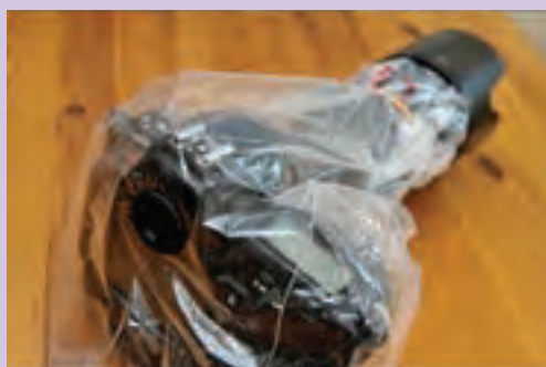
▲ تصویر ۷۵