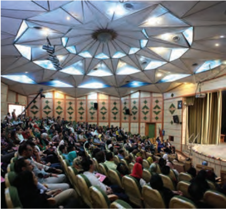
تصویر ۶۸ ▲