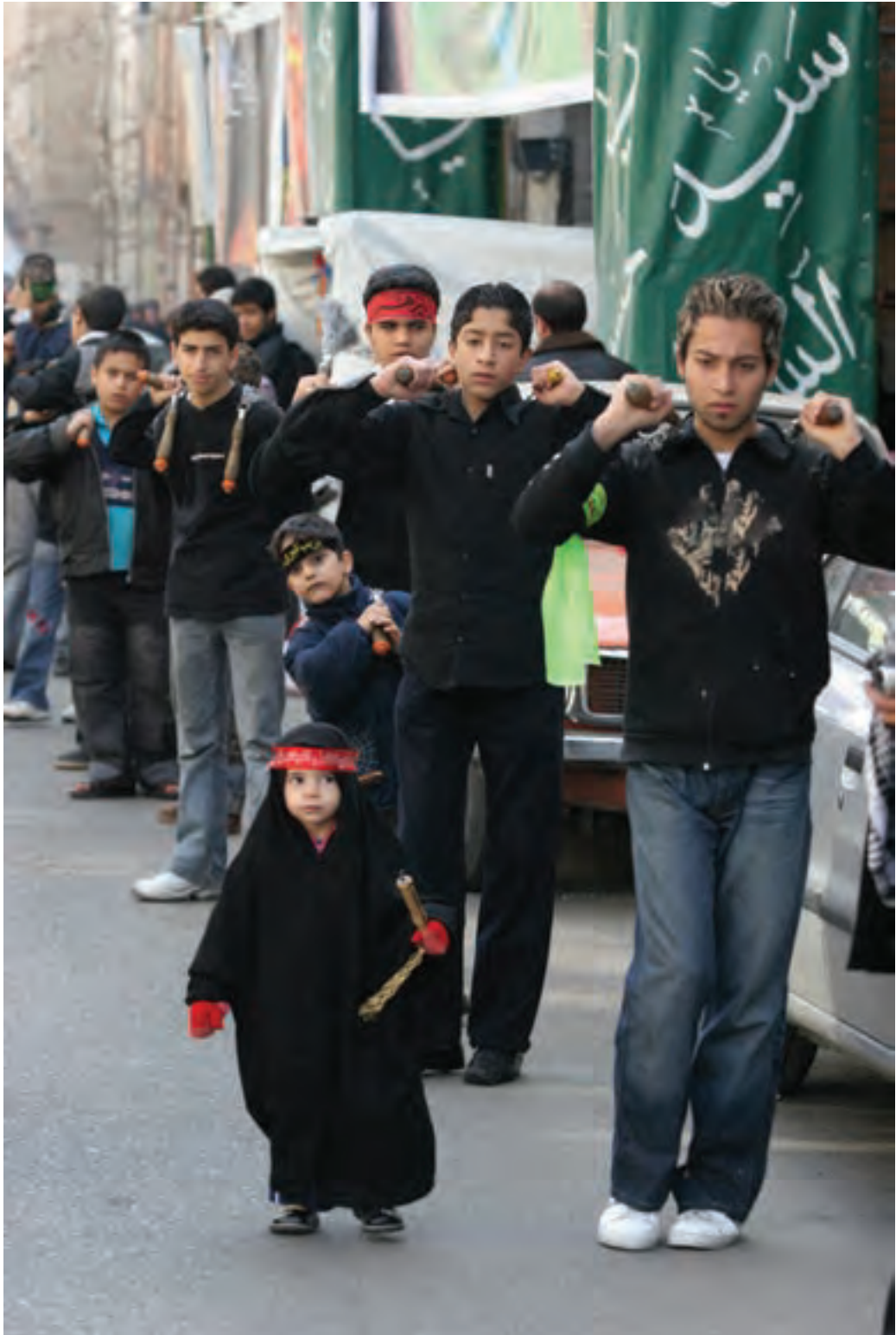
▲ تصویر ۶۵