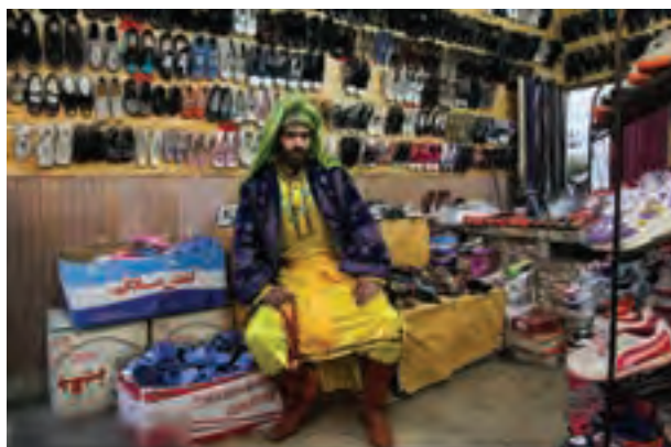
▲ تصویر ۳۹