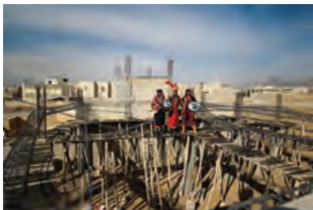
▲ تصویر ۴۲