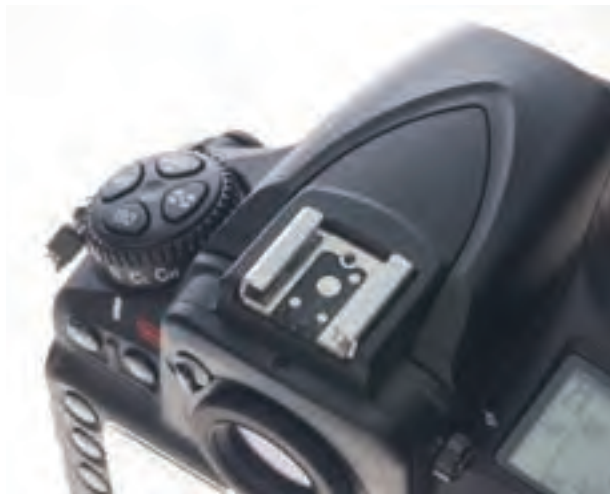
تصویر ۸۹ ▲