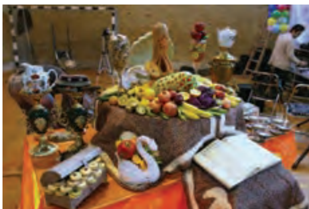
تصویر ۱۰۸ ▲

اکنون به تصاویر زیر نگاه کنید. هر یک از عکس‌ها چه تغییراتی کرده‌اند؟ (رنگ، کادر، نور و ...)