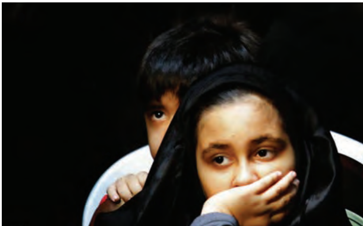
تصویر ۲۵ ▲