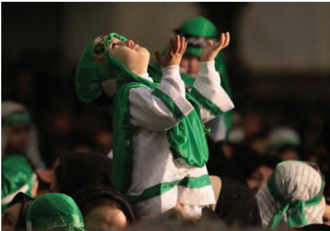
▲ تصویر ۱۴