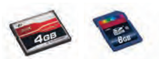
تصویر ۹۲ ▲