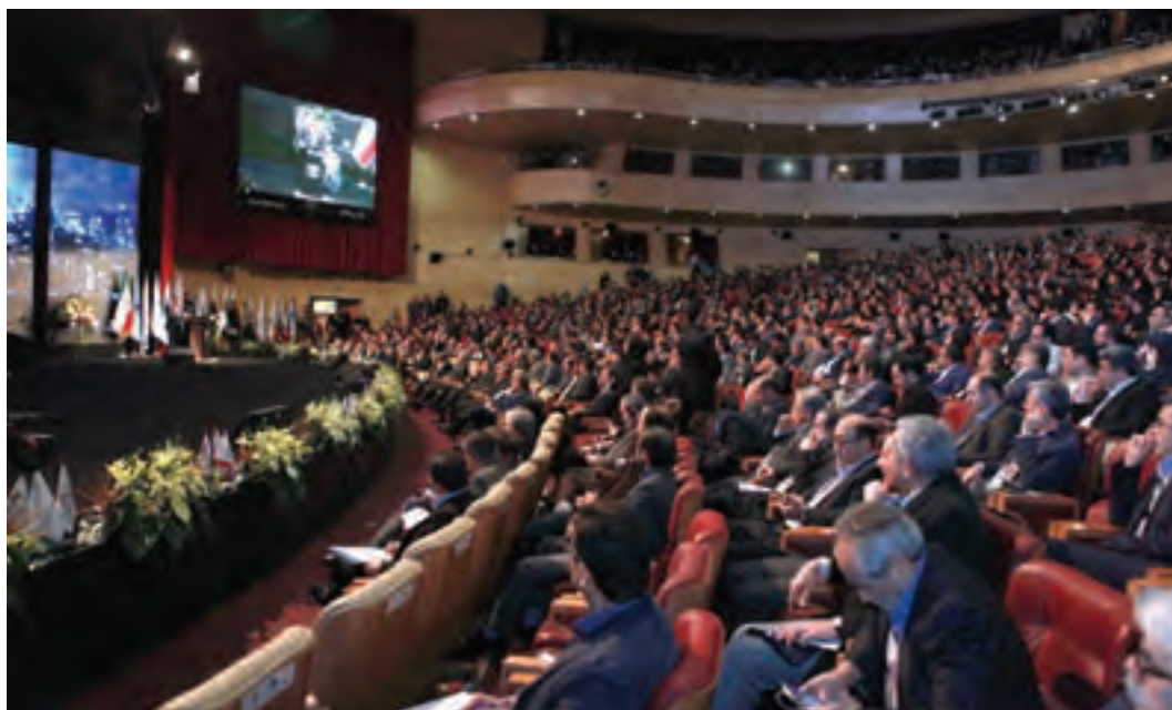
▲ تصویر ۶۲

۳- وضعیت سالن و مدعوین: در بسیاری از مراسم و آئین‌ها، مدعوین معمولاً به صورت پراکنده در سالن مستقر می‌شوند. این پراکندگی، عکاس را برای تهیه عکس‌های مناسب و ایده‌آل با مشکلاتی مواجه می‌سازد. در برخی موارد می‌توان با کمی جابجایی و بالا و پایین شدن و یا به چپ و راست حرکت کردن و یا استفاده از لنزهای مختلف عکاس این مشکل را حل می‌کند. در چنین وضعیتی در صورت امکان، بهتر است عکاس، نحوه نشستن مدعوین و ساماندهی سالن را با همکاری مجریان و مسئولان ذی‌ربط انجام دهد و سپس عکاسی را آغاز کند.