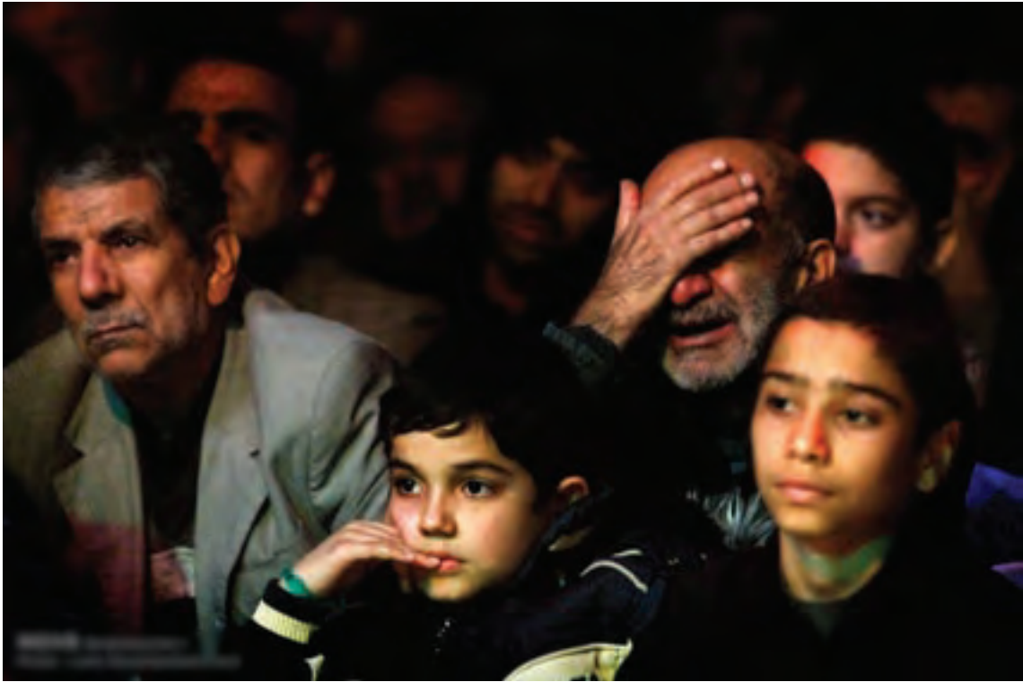
▲ تصویر ۲۲