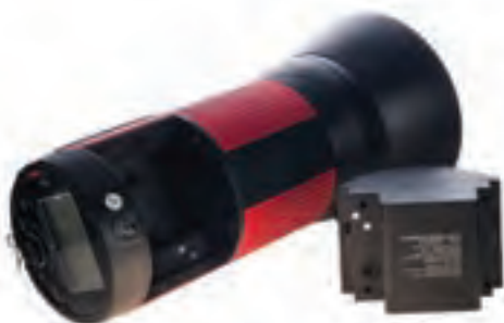
تصویر ۸۰ ▲

با کدام یک از این فلاش‌ها کار کرده‌اید؟ آیا می‌توانید ویژگی‌های فلاشی را که می‌شناسید بنویسید؟ * فلاش‌های قابل حمل به فلاش‌هایی گفته می‌شود که نیازی به برق به صورت مستقیم برای شارژ خازن‌های خود ندارند. فلاش‌های استودیویی از قدرت بیشتری نسبت به فلاش‌های قابل نصب روی دوربین (اکسترنال) برخوردار هستند. ولی نیاز این‌گونه فلاش‌ها به برق، استفاده از آن‌ها را در فضای خارج از استودیو مشکل می‌کند.