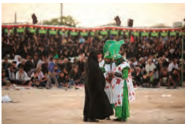
▲ تصویر ۳۶

۱- ایده و اجرا: در برخی از مراحل عکاسی، از یک مراسم آئینی (مانند تعزیه)، عکاس پس از انجام کار، می‌تواند به ایده‌های خلاق برسد و برای یک مجموعه عکس، ایده پردازی کند. بدین ترتیب گویا ادامه یک مراسم آئینی را در زندگی روزمره به تصویر می‌کشد (تصاویر ۳۶ تا ۵۷).