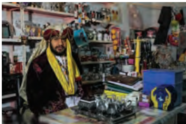
▲ تصویر ۴۴