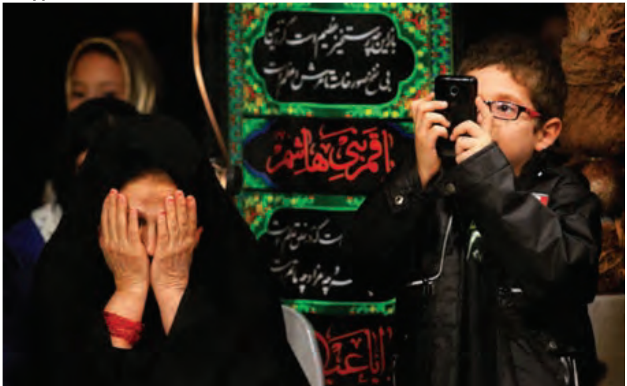
تصویر ۲۱ ▲