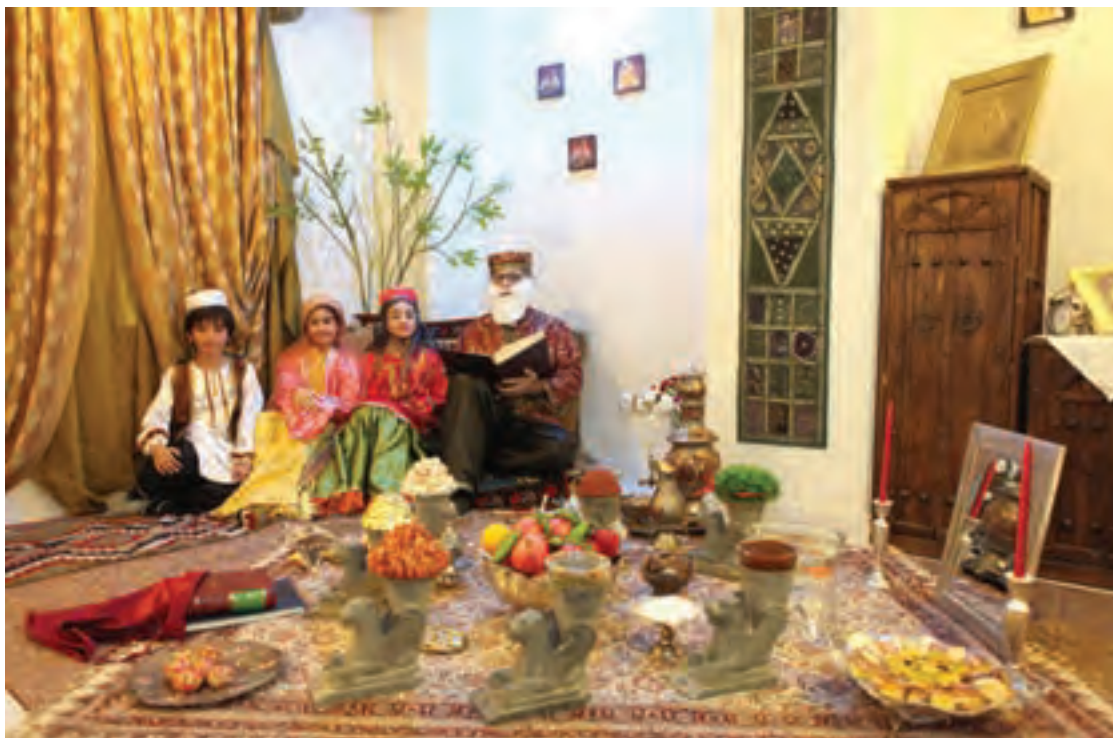
تصویر ۵۹ ▲