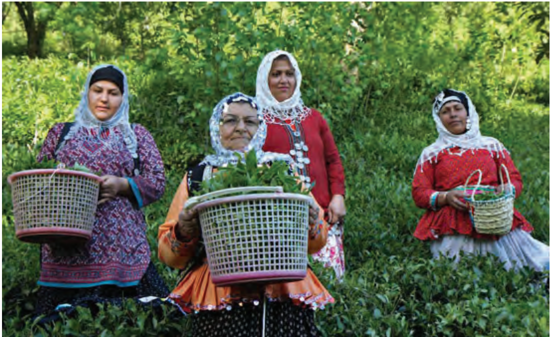
▲ تصویر ۳۳