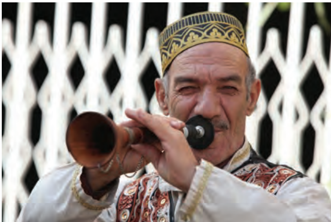
▲ تصویر ۱۱