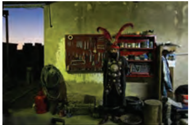
تصویر ۵۳ ▲