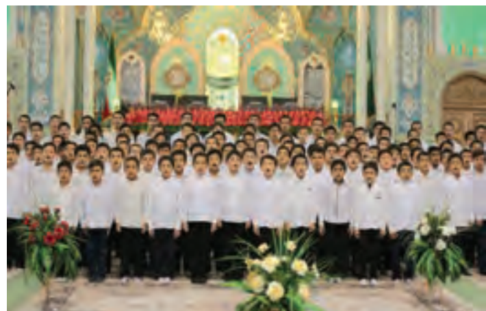
تصویر ۶۷ ▲

۴- فضای سالن (محیط): در برخی موارد و با وجود مشکلات نوری در سالن‌ها و آمفی‌تئاترها، ممکن است با فضاهای زیبایی از نظر معماری روبه‌رو شویم. بهتر است توجه ما فقط به برگزاری یک جلسه و یا مراسم آئینی معطوف نباشد. تهیه عکس از مدعوین در کنار زیبایی‌های موجود در سالن از نظر معماری و تنوع در طراحی دکور و چیدمان وسایل، می‌تواند ارزش عکس‌های تولید شده را ارتقاء بخشد. به عنوان مثال؛ برگزاری مراسم روز بزرگداشت سعدی و یا حافظ در حافظیه و سعدیه شیراز و یا بزرگداشت حکیم ابوالقاسم فردوسی در کنار بنای یادبود وی در طوس و بناهای یادبود دیگری مانند آن، می‌تواند به جذابیت و زیبایی عکس‌های تولید شده کمک قابل توجهی کند و یا برگزاری جشن غدیر و یا جشن‌های تکلیف، در مساجد و اماکن متبرکه، موقعیت مناسبی است که ما می‌توانیم در حین تهیه عکس از مراسم در حال برگزاری، به فضای معماری زیبای مساجد و یا کاشی‌کاری‌ها و مانند آن هم توجه کافی داشته باشیم و عکس‌های متنوع‌تر و مفیدتری را تهیه کنیم. همچنین عکاسی از جشن میلاد امام رضا (ع) در مشهد مقدس با توجه به معماری ویژه این مکان و کاشی‌کاری‌ها، کتیبه‌ها، نور و فضای صحن امام رضا (ع) از جاذبه‌های عکاسی با رویکرد معماری می‌تواند محسوب شوند.