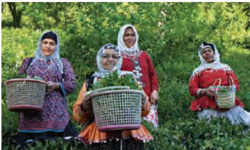
جشن چای | تصویر ۷۲ ▲