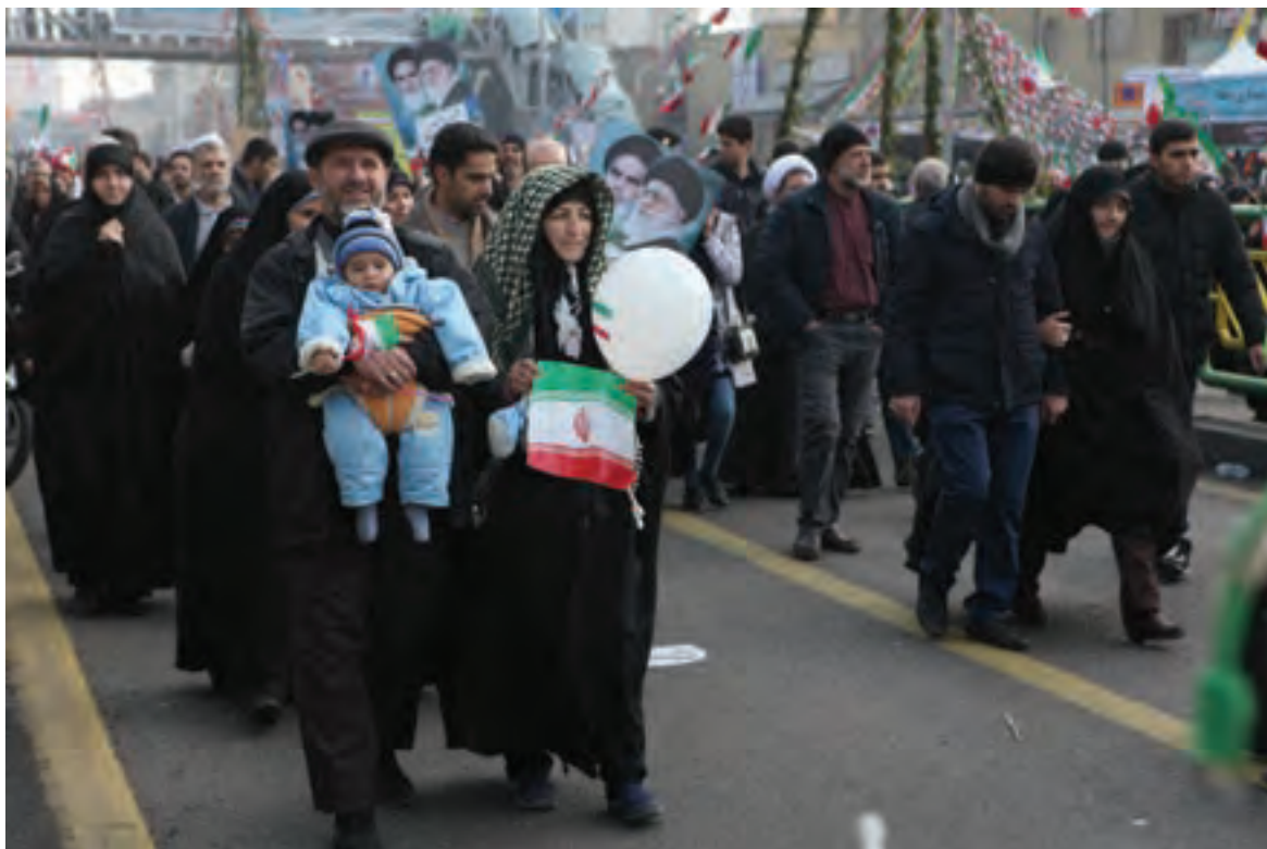
▲ تصویر ۹