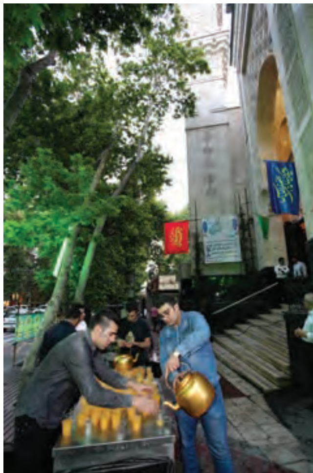
▲ تصویر ۹۴

اکنون به عکس‌های زیر توجه کنید. درباره هر یک از عکس‌ها متناسب با موضوع و مکان عکاسی در کارگاه گفت‌وگو کنید و با جست‌وجو در عکس‌ها ابتدا مناسبت آنها را بنویسید و بگویید کدام یک از آنها در بیان موضوع موفق بوده‌اند؟