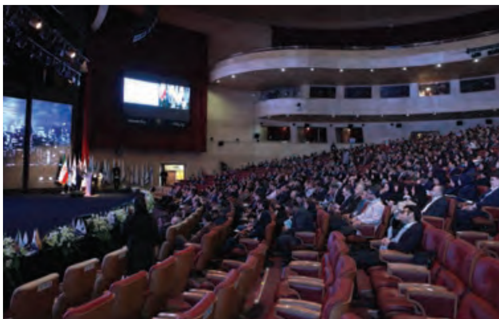
▲ تصویر ۶۳