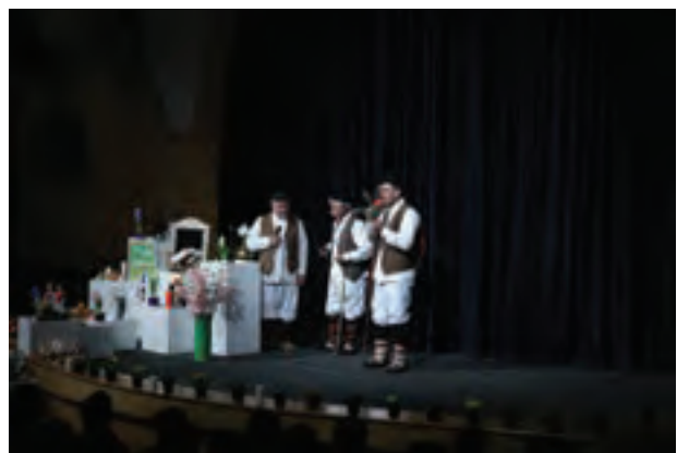
▲ تصویر ۱۰۶