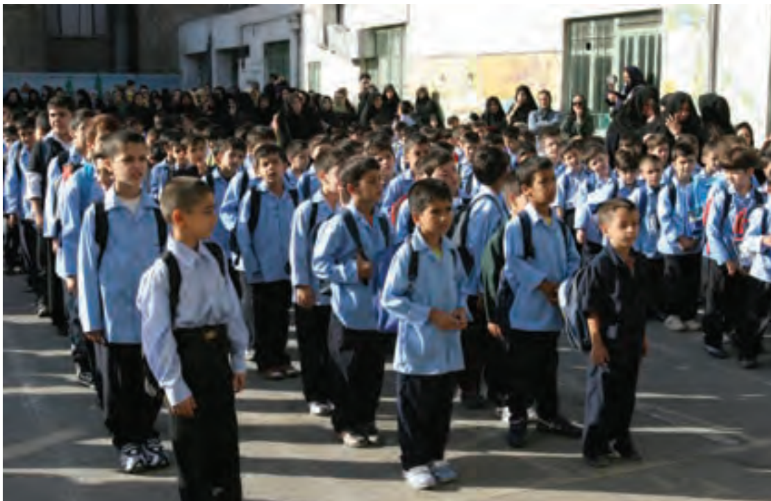
▲ تصویر ۱۵