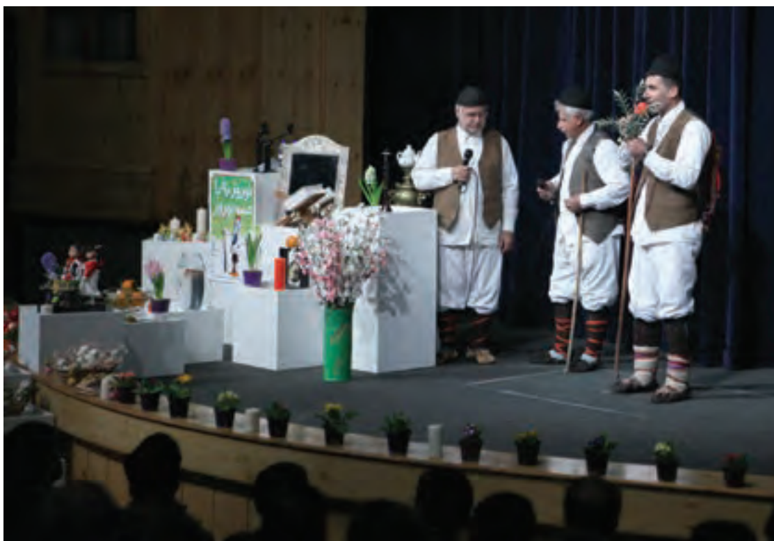
تصویر ۶۰ ▲