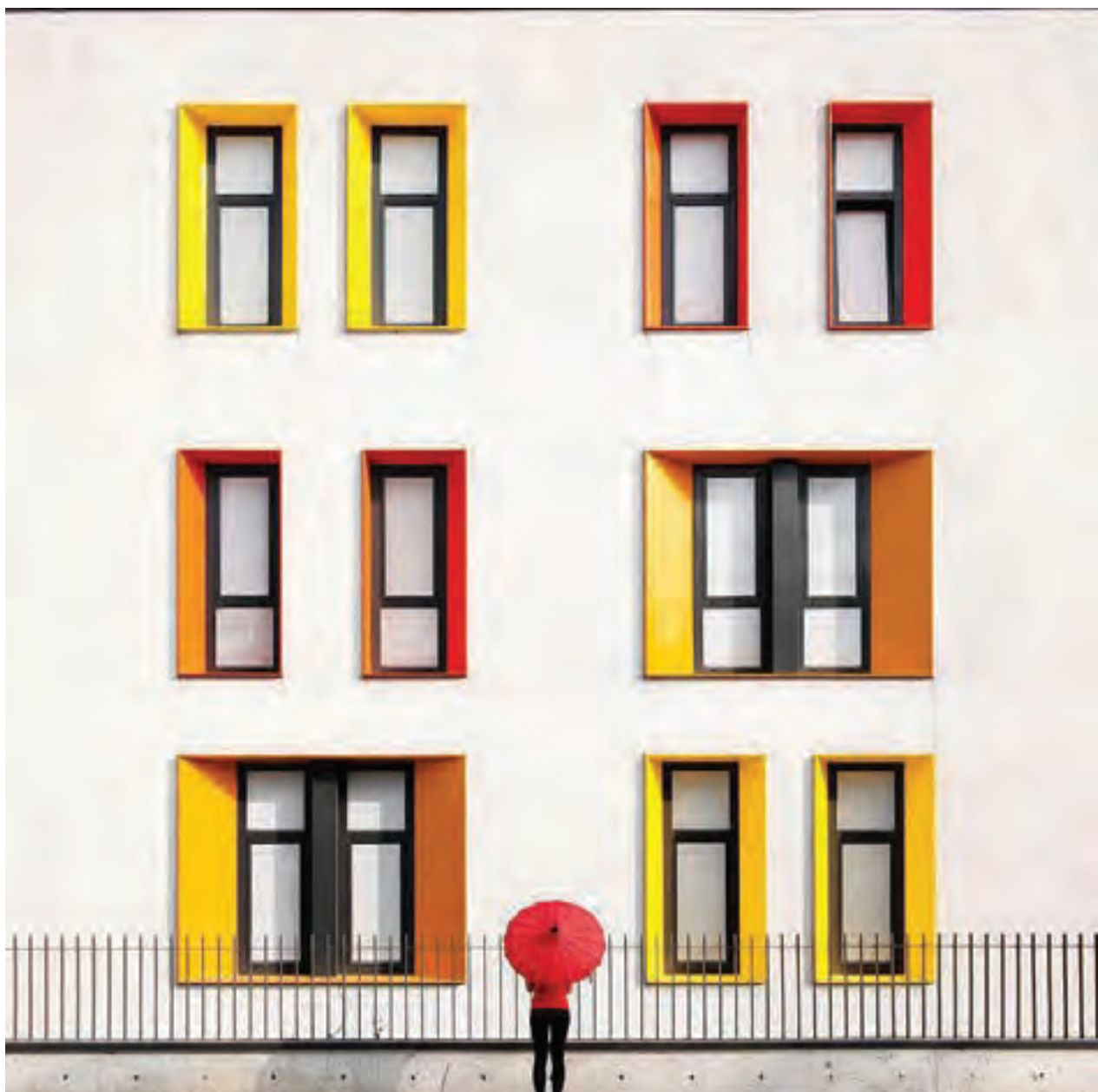
▲ تصویر ۱۰۲