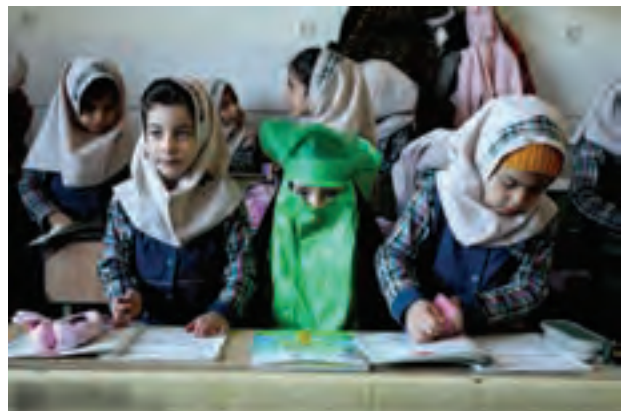
تصویر ۵۷ ▲

با مراجعه به کتابخانهٔ مدرسه و یا فضای مجازی، دو مجموعه عکس را با خود به کلاس آورده و دربارهٔ موضوع، ایده و اجرای آن‌ها با هنرآموز خود و دیگر هنرجویان گفت‌وگو کنید.