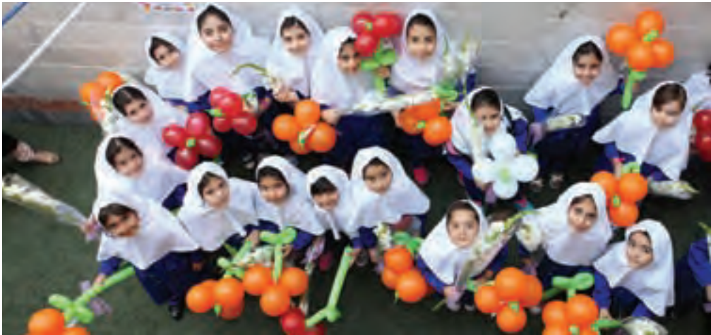
▲ تصوير ۹۶