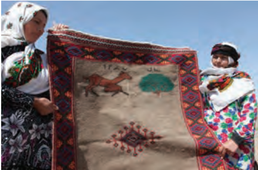
▲ تصویر ۱۰۱