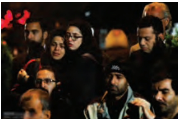
▲ تصویر ۲۶