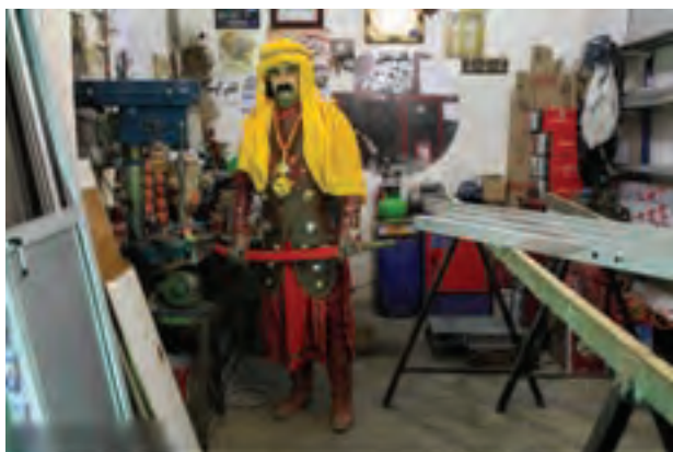
▲ تصویر ۴۶