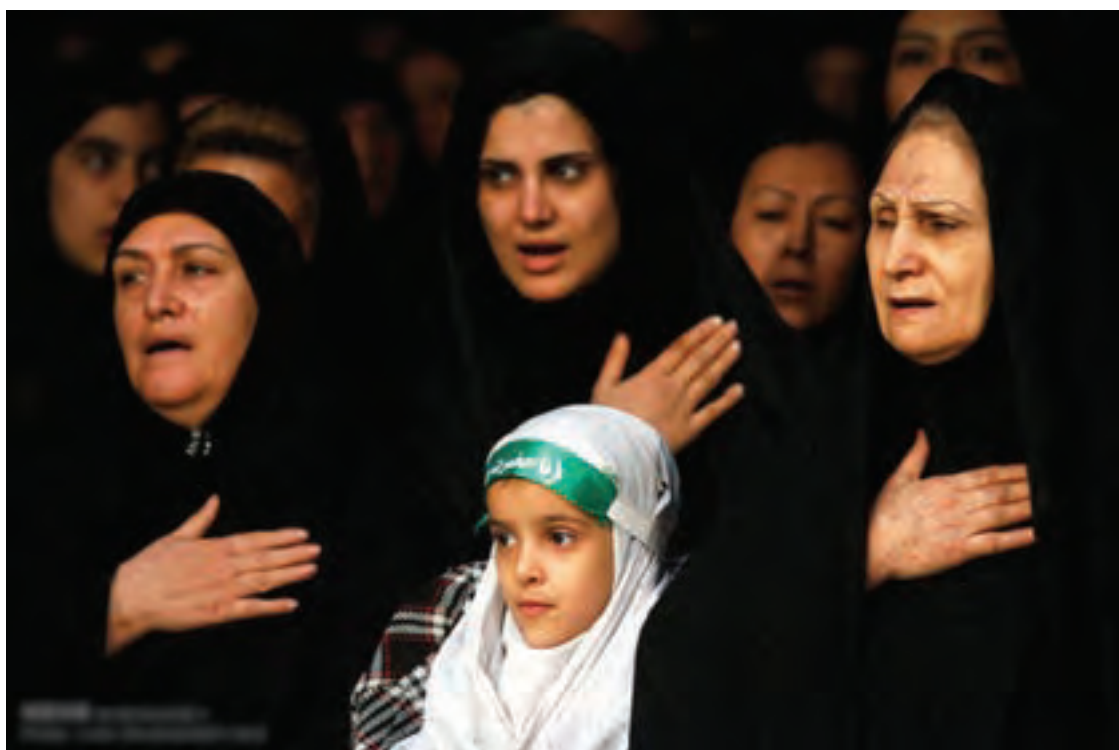
▲ تصویر ۱۹