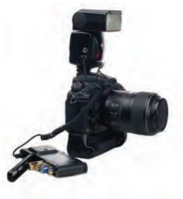
تصویر ۷۸ ▲

فلاش‌ها (فلاش‌های قابل حمل): به تصاویر زیر نگاه کنید.