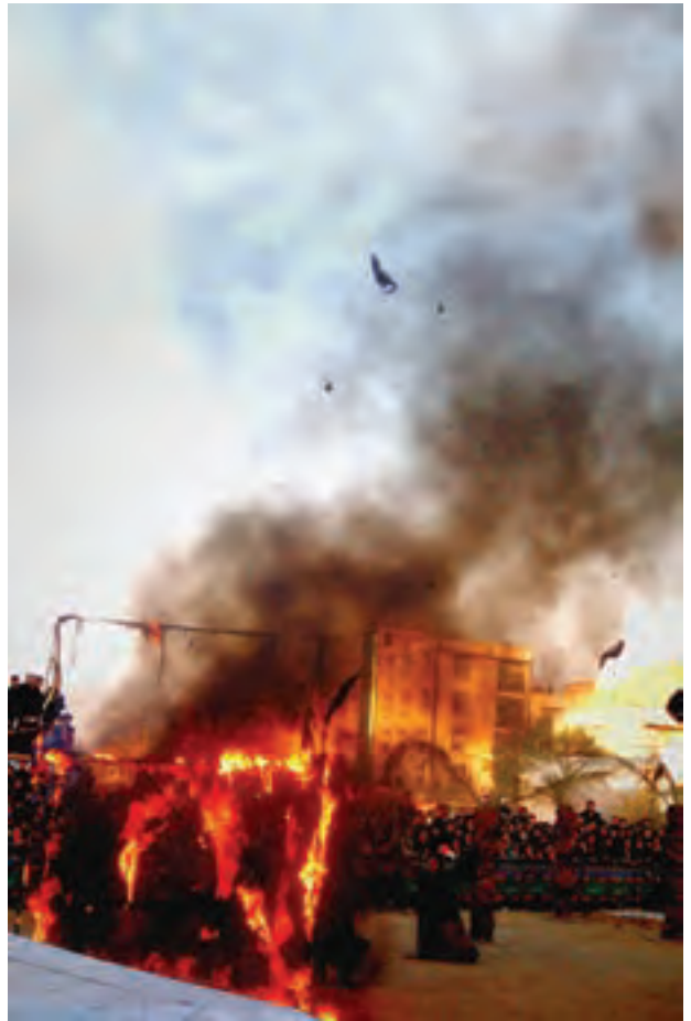
▲ تصویر ۳۵

به نظر شما کدام عکس واقعی‌تر است؟ هریک از عکس‌ها به چه نوع مراسم یا واقعه‌ای اشاره می‌کند؟ آیا عکاس با توجه به موضوع عکس، کادربندی مناسبی انتخاب کرده است؟ کدامیک از عکس‌ها با موضوع این واحد یادگیری (مراسم و جشن‌ها) ارتباط مستقیمی دارد؟