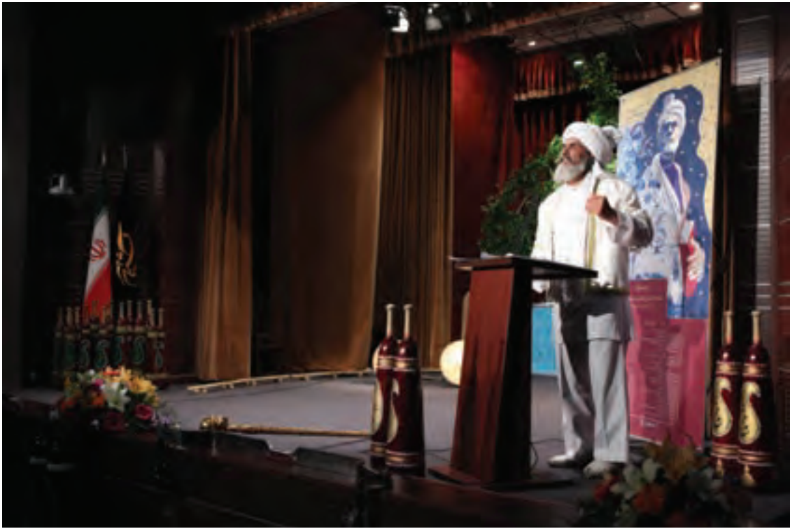
▲ تصویر ۳