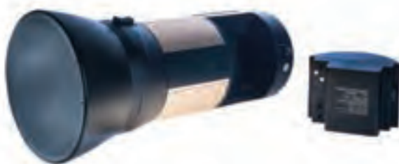
تصویر ۸۱ ▲