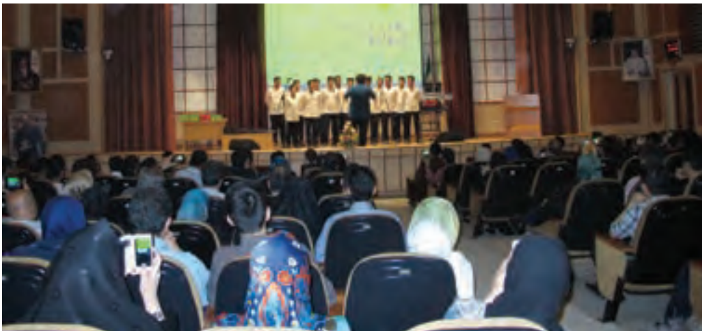
▲ تصویر ۹۸