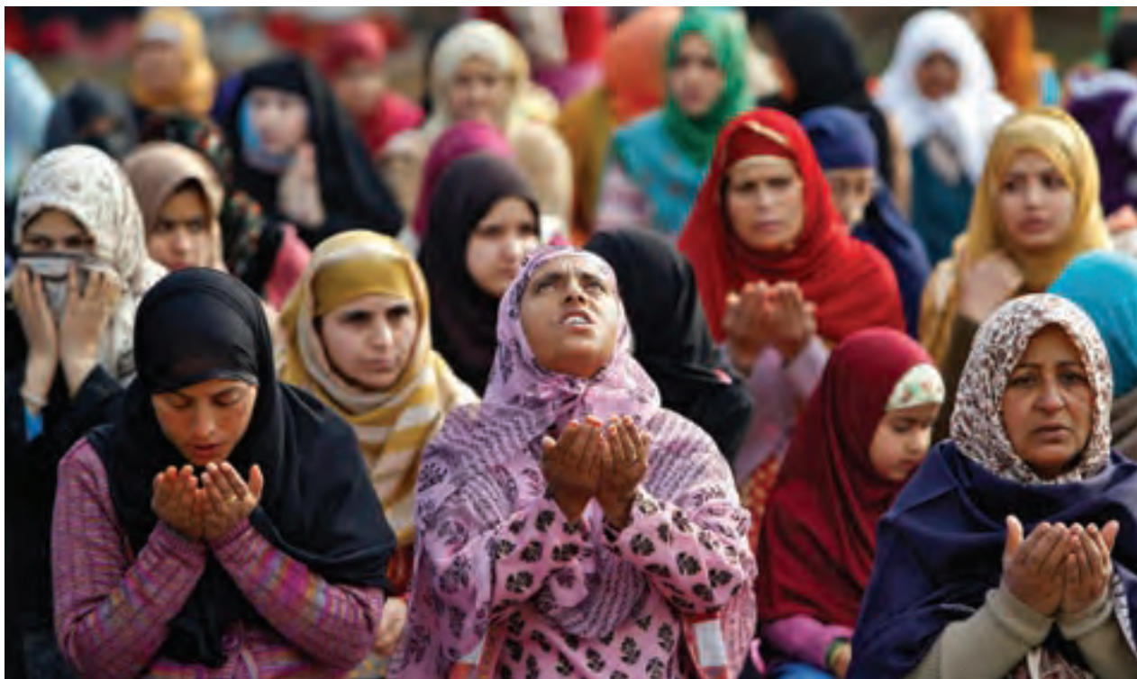
تصویر ۵ ▲