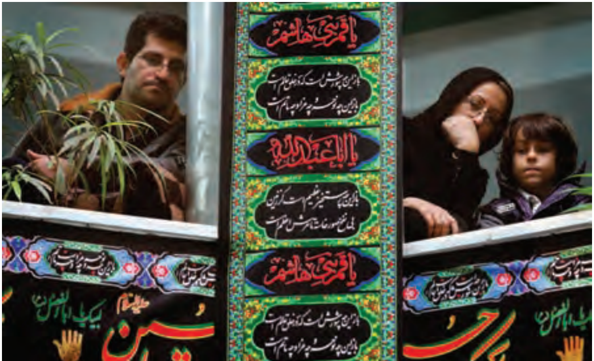
تصویر ۲۰ ▲