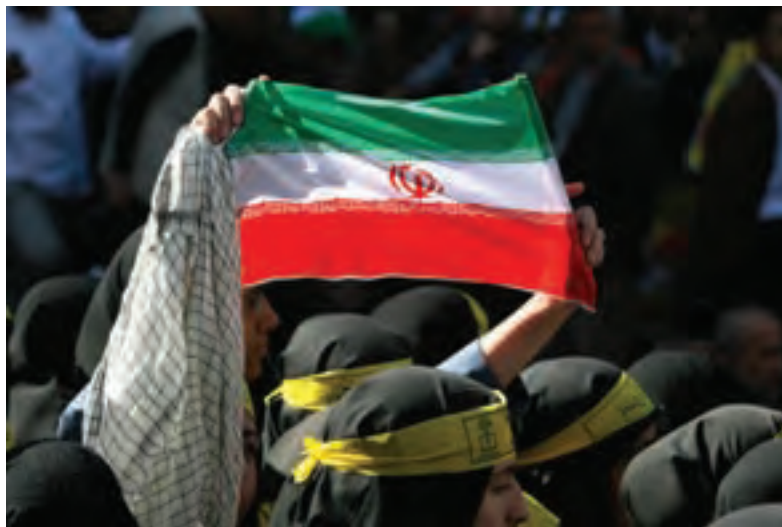
تصویر ۲ ▲