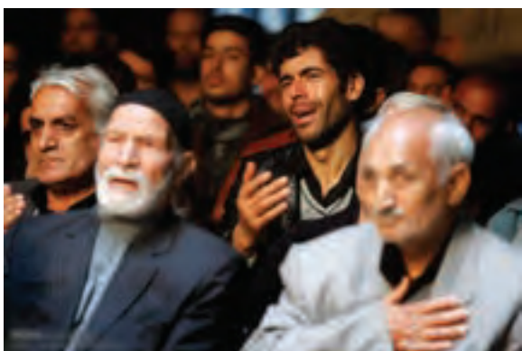
▲ تصویر ۲۸