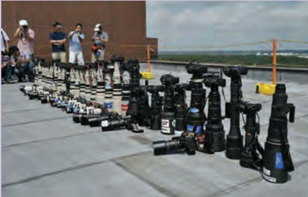
تصویر ۱۳ ▲

آیا می‌توانید فهرستی از تجهیزات لازم برای عکاسی در شرایط جوی و اقلیمی گوناگون تهیه کنید؟