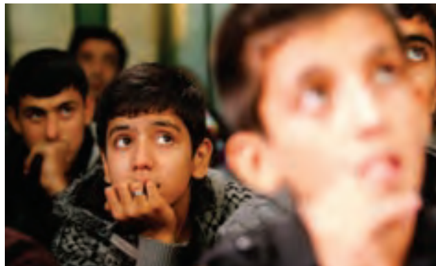
▲ تصویر ۲۷