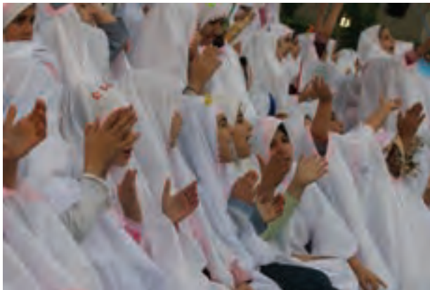
▲ تصویر ۱۰۴