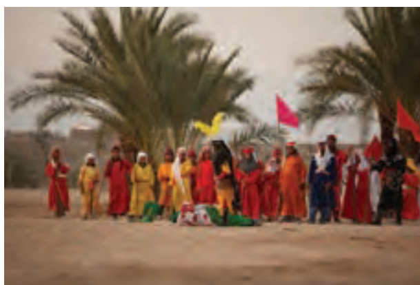
▲ تصویر ۳۷