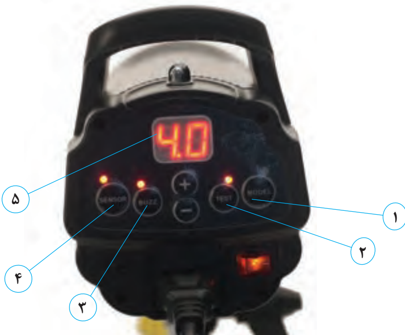
تصویر ۸۷ ▲