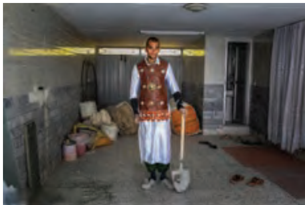
▲ تصویر ۴۱