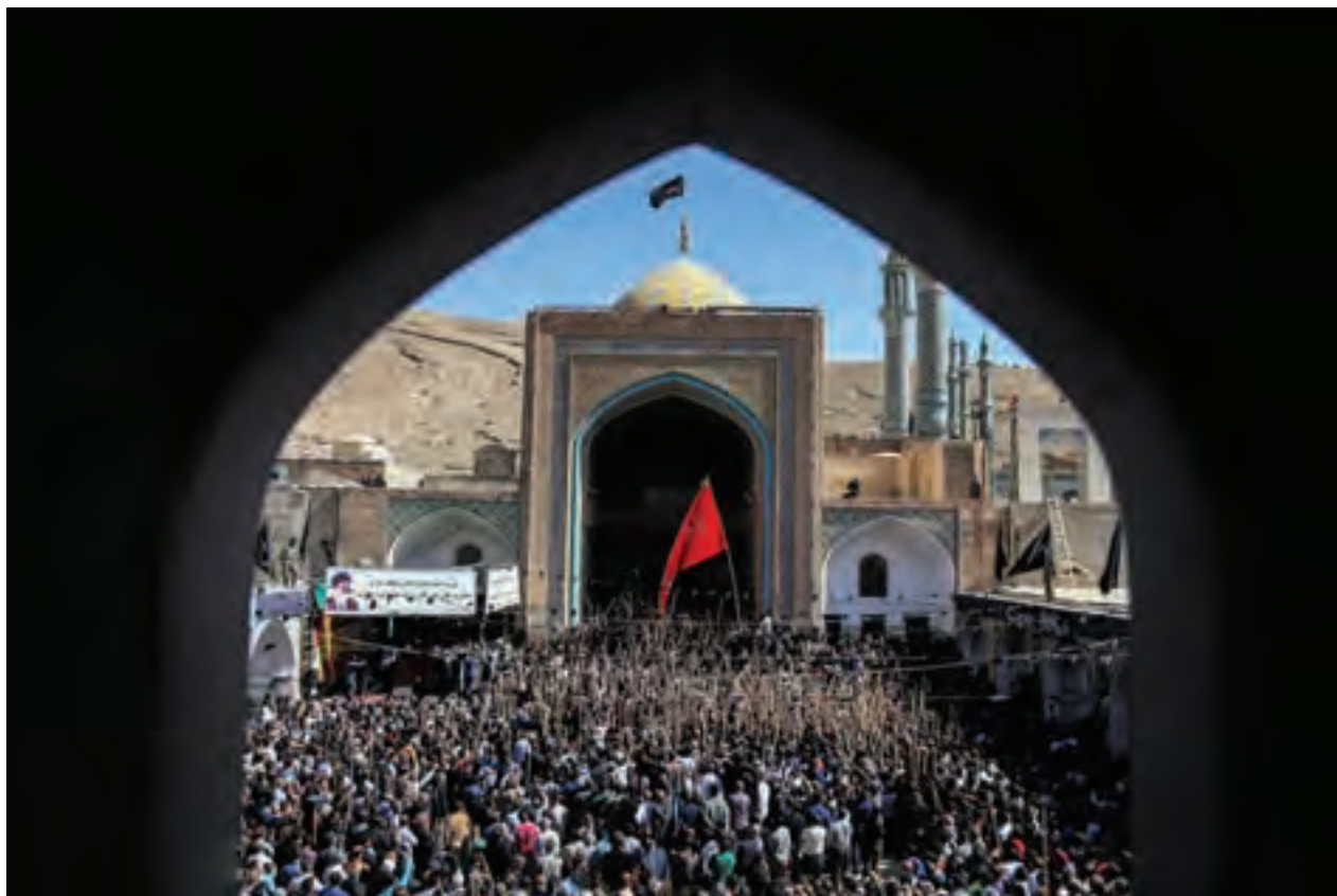
▲ تصویر ۷۴

این وسایل نسبتاً ساده هستند و نیازی به خرید همه آنها نیست. ما می‌توانیم با کمی وسایل ساده یک کاور ضد آب برای کیف و یا کوله و یک کاور ساده هم برای دوربین‌مان بسازیم تا در زمان لازم بتوانیم از آنها بهره‌مند شویم.