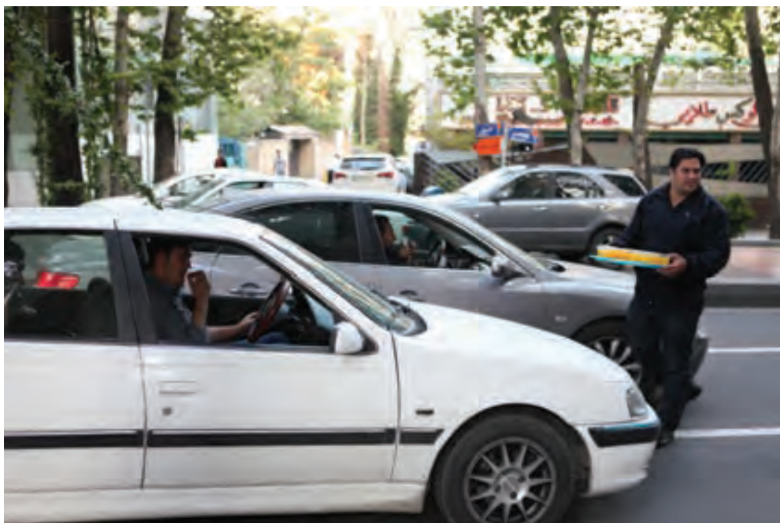
▲ تصویر ۱۲