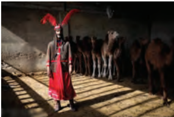
تصویر ۵۶ ▲