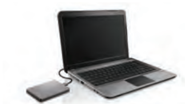
تصویر ۹۳ ▲

عکاسان می‌توانند با همراه داشتن ۲ یا ۳ کارت حافظه با گنجایش بالا و سرعت خوب، از نگرانی در هنگام عکاسی کم کرده و با خیال راحت در مراسم‌ها به تعداد بالایی اقدام به تهیه عکس‌ها کنند.