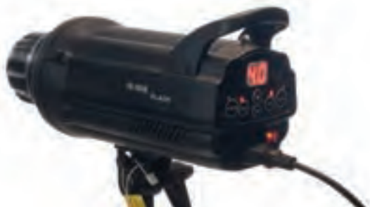
تصویر ۸۲ ▲

کار با فلاش‌های قابل حمل: به تصاویر نگاه کنید. در این تصاویر صفحه کنترل فلاش‌ها را می‌بینید.