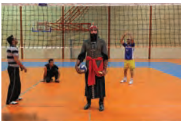
▲ تصویر ۵۰