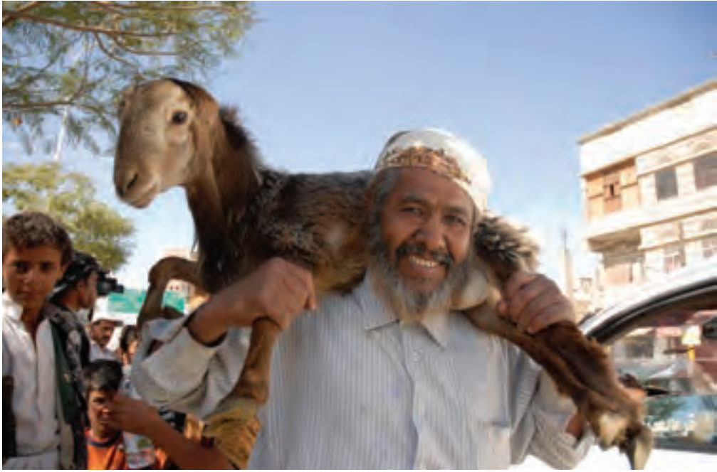
▲ تصوير ۹۵