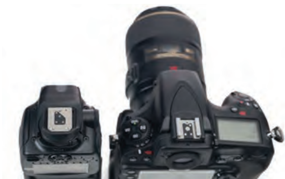
▲ تصویر ۹۱