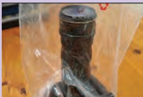
▲ تصویر ۷۶