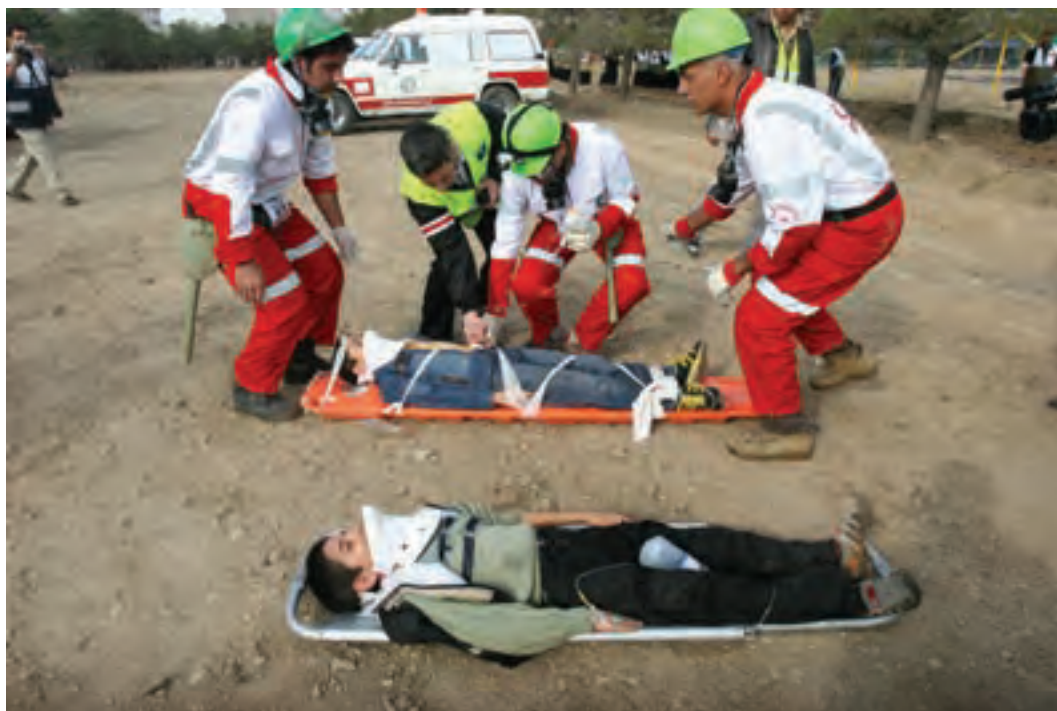
تصویر ۳۰ ▲