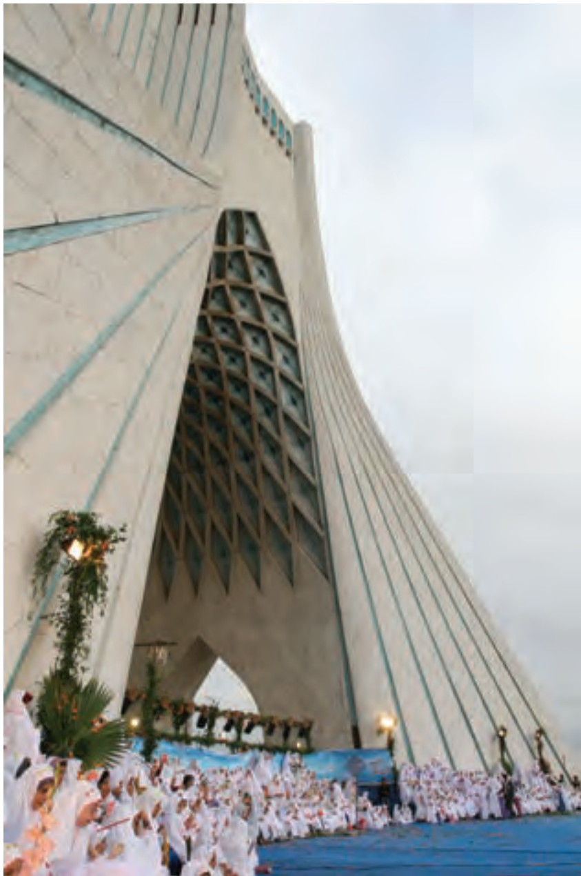
تصویر ۵۸ ▲

۲- ارزیابی از شرایط مکان و فضای عکاسی: عکاسی از جشن‌ها، مراسم و آیین‌ها نیز یکی از فعالیت‌های مرتبط با عکاسی بوده و از اصول و قواعد ویژه‌ای پیروی می‌کند.