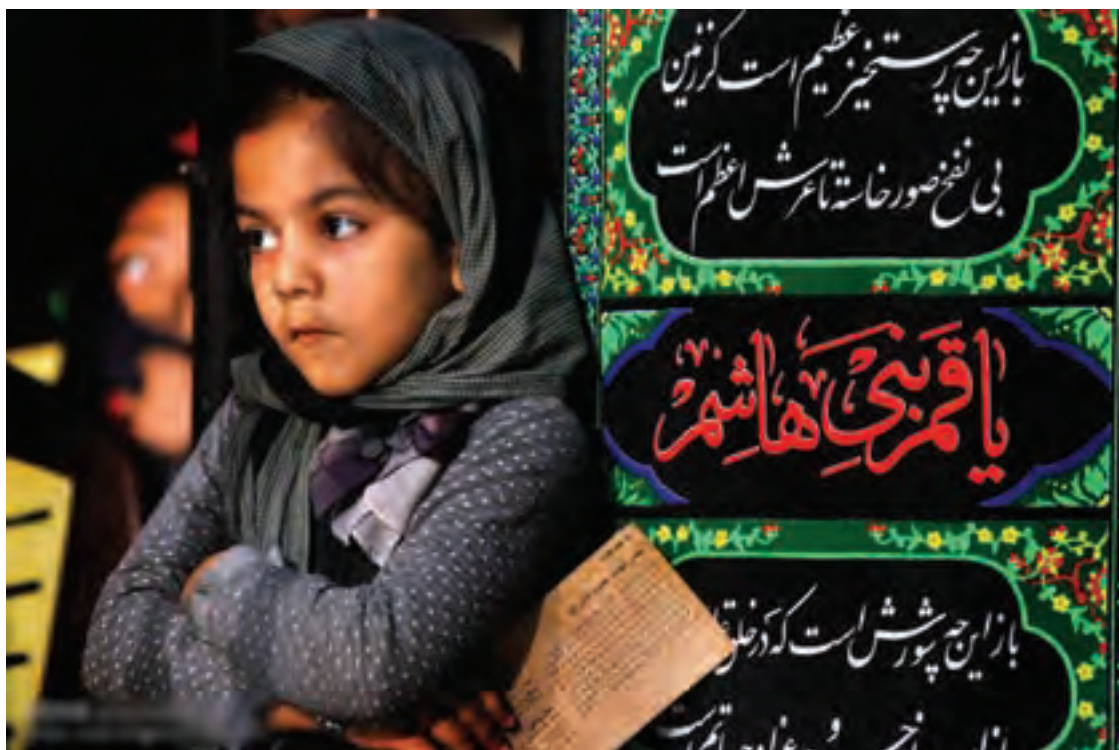
▲ تصویر ۱۸