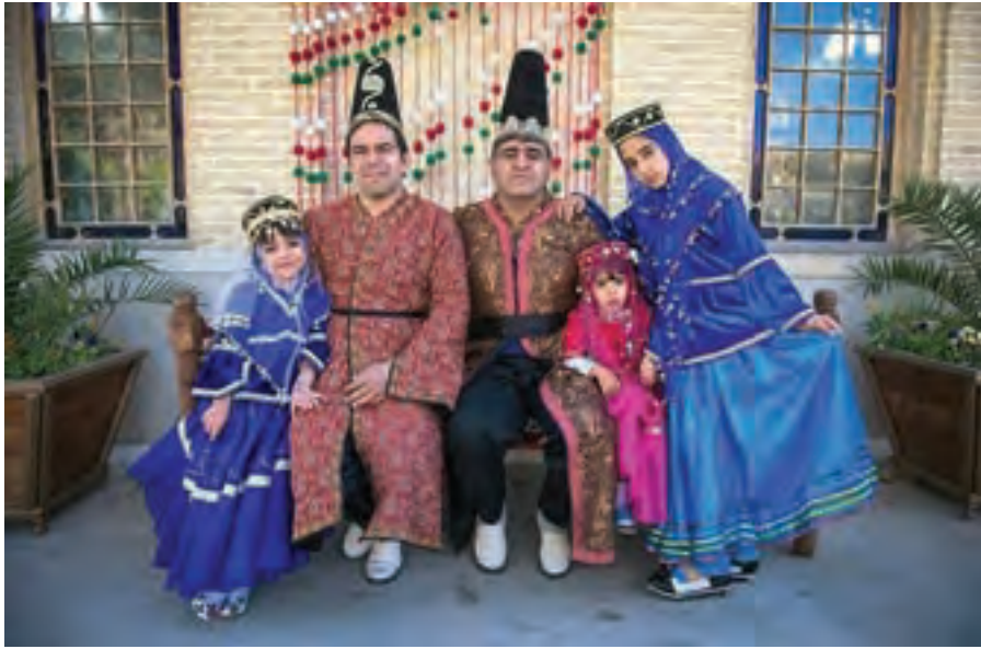
▲ تصویر ۱۰۰