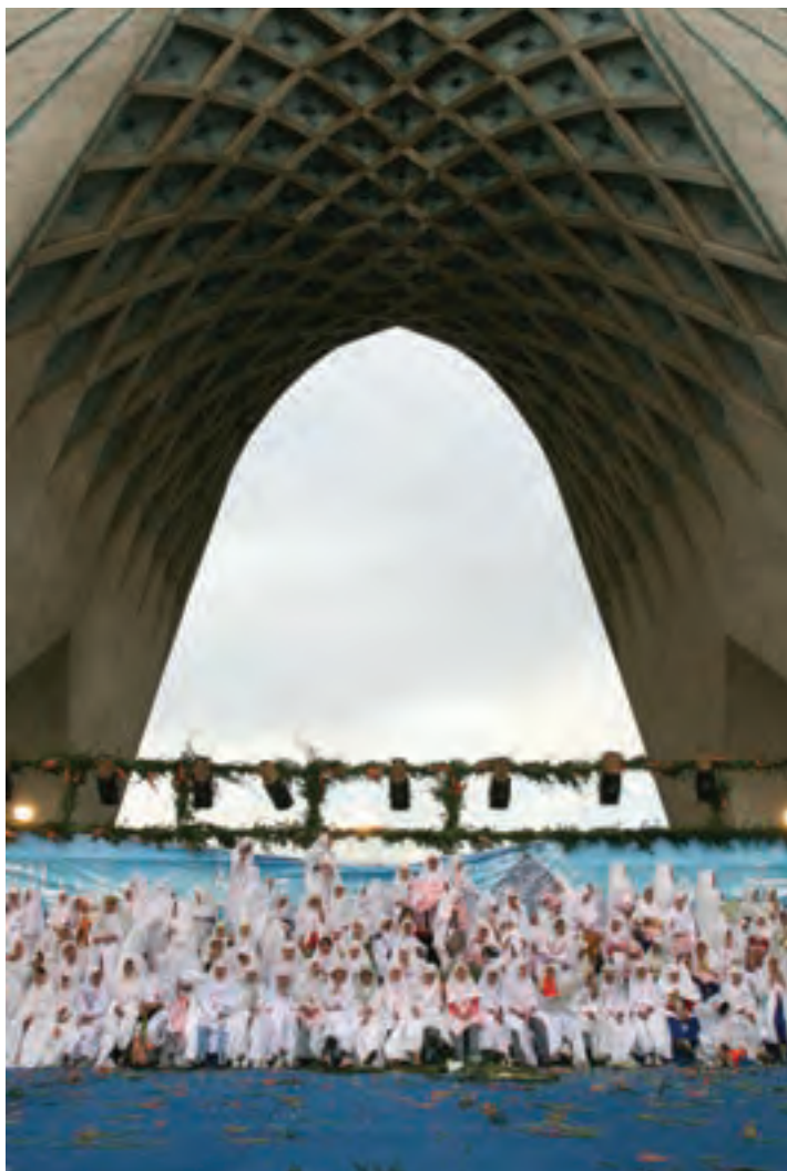
تصویر ۶۶ ▲