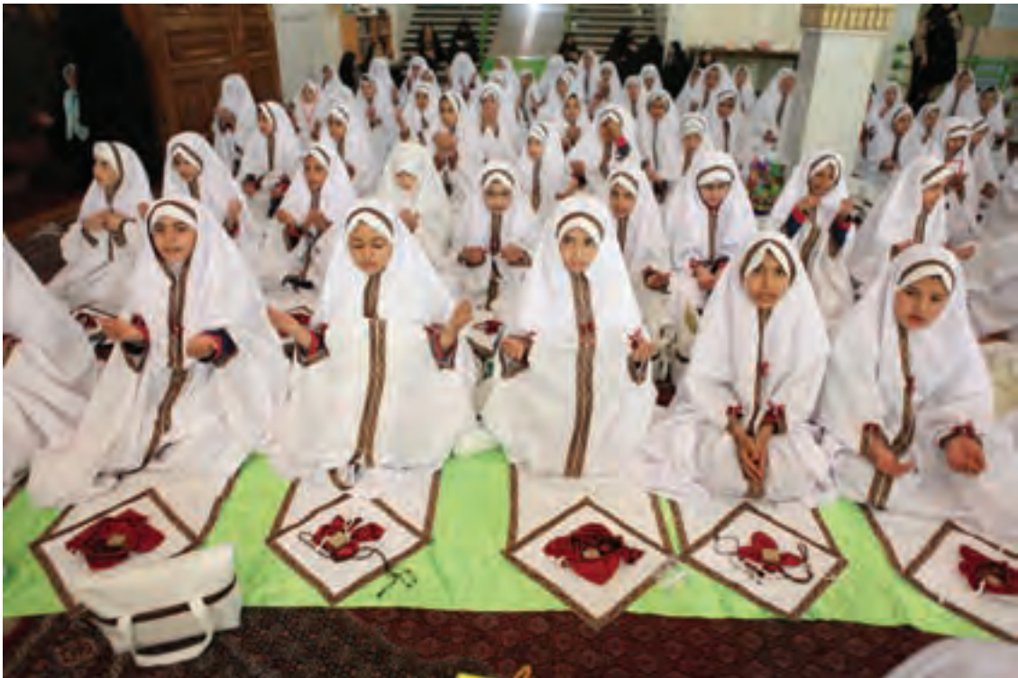
▲ تصویر ۴