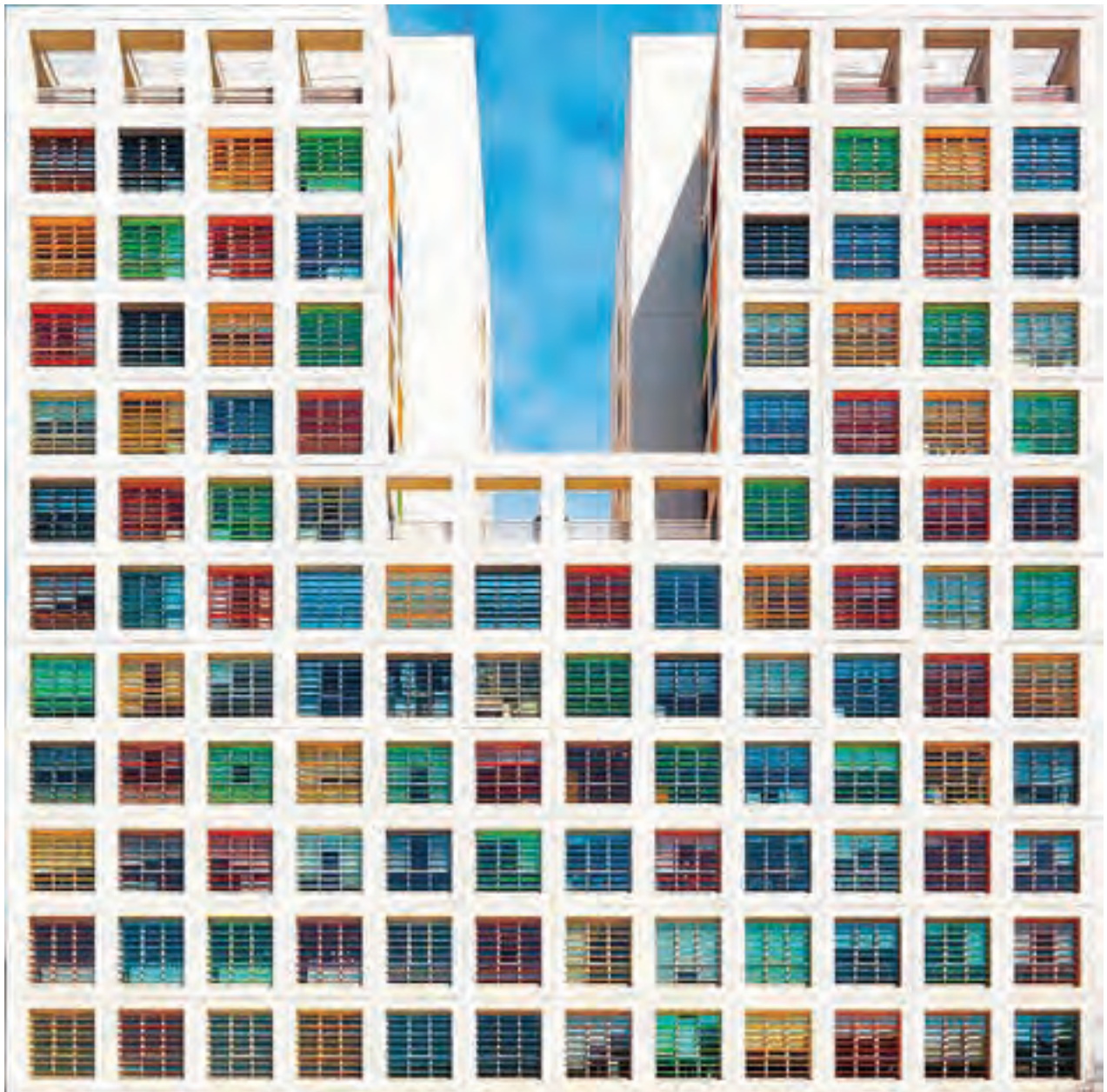
▲ تصویر ۱۰۳