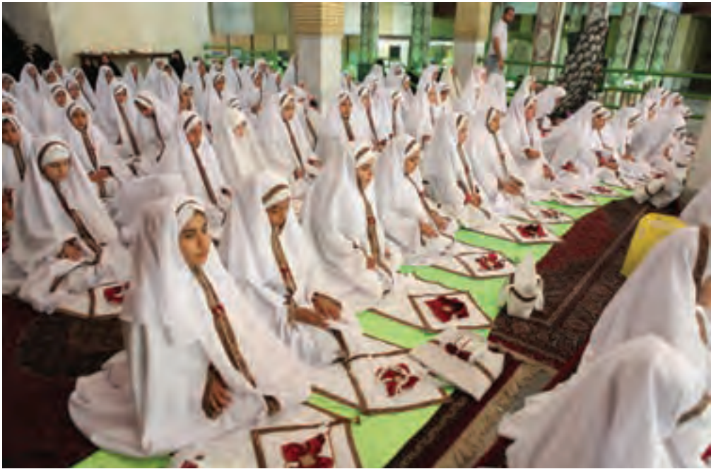
▲ تصویر ۹۷