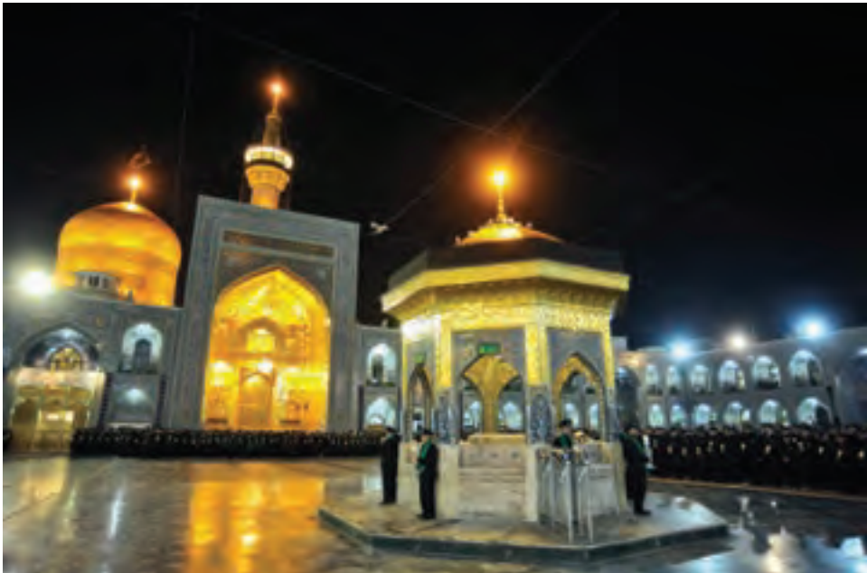
تصویر ۶۹ ▲