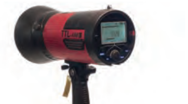
تصویر ۸۳ ▲

چه شباهت‌ها و تفاوت‌هایی می‌بینید؟ آنها را بنویسید.