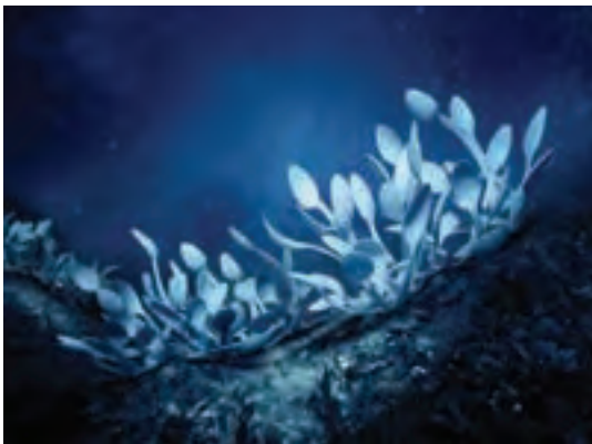
شکل ۲۰-۱- تصویر با موضوع حفظ محیط زیست

آفریده‌های خداوند، با گستردگی بی‌کران خود همیشه منبع سرشار از الهام برای هنرمندان و صنعتگران در دوره‌های گوناگون بوده است. نمونه‌های بسیار زیادی از ساخت اشیا و آفرینش آثار هنری توسط هنرمندان وجود دارد که منشأ شکل‌گیری آنها طبیعت، جانوران، گیاهان، سنگ‌ها و ... بوده است. این الهام گرفتن از طبیعت که در آثار هنرمندان نمونه‌های بسیاری از آن دیده شده است، در اختراعات و ابتکارات دانشمندان در طول تاریخ سبب شکل‌گیری علمی با نام بیونیک یا علم بررسی نظام حیات جانداران شده است. بیونیک را می‌توان علم «طبیعت الگو» نیز نامید.