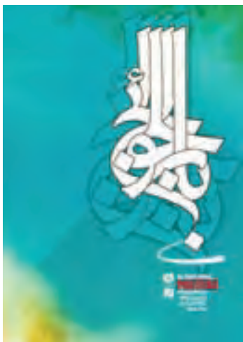
شکل ۱-۶- تایپوگرافی