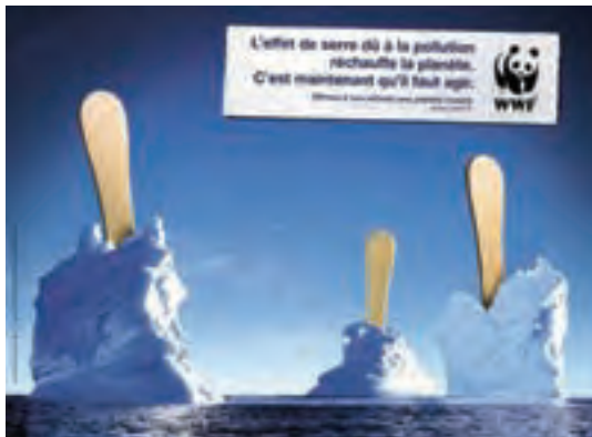
شکل ۲۵-۱- تبلیغ درباره گرمایش زمین و آب شدن یخ‌های قطبی