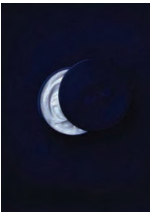
شکل ۳۲- تبلیغ کرم مخصوص شب با الهام از شکل هلال ماه