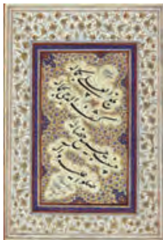
شکل ۱-۵- خوش نویسی