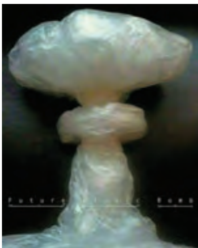
شکل ۳۶-۱- پوستر با موضوع فاجعه زیست محیطی استفاده بی رویه از پلاستیک