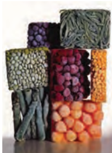
شکل ۱-۳- عکس تبلیغاتی