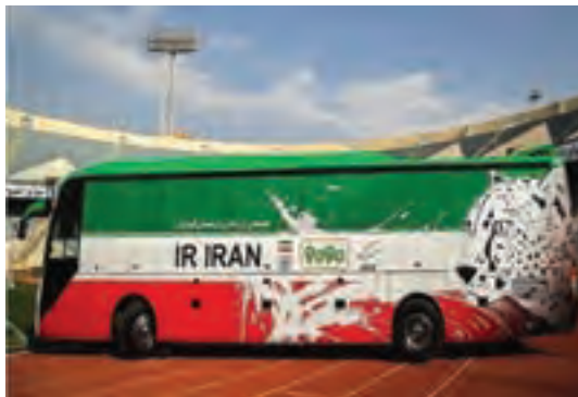
شکل ۱۵-۱- گرافیک محیطی - طراحی تبلیغاتی بر روی بدنه اتوبوس