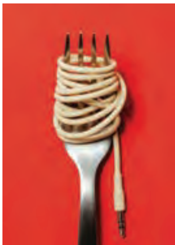
شکل ۲۸-۱- شباهت سیم به رشته ماکارونی