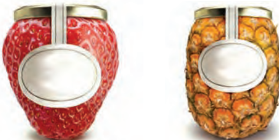
شکل ۱-۲۲- بسته‌بندی ظروف مربا با الهام از شکل طبیعی میوه‌ها