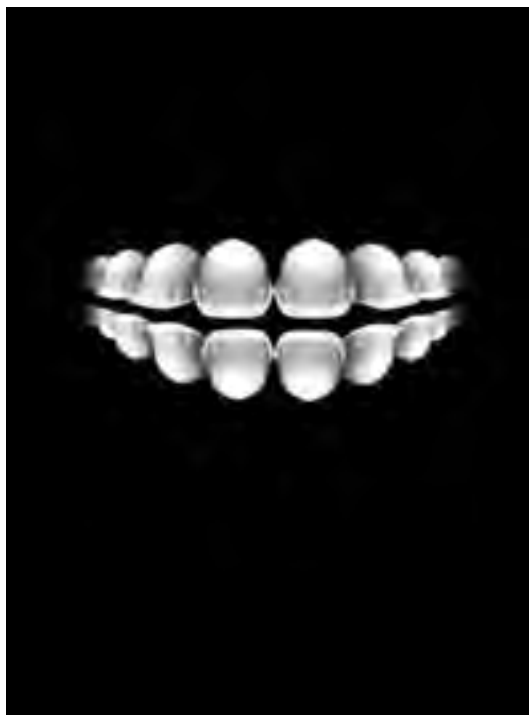
شکل ۲۹- تبلیغ خمیردندان با تأکید بر محافظت از دندان‌ها همچون کلاه ایمنی