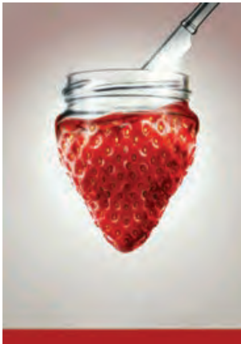
شکل ۳۳-۱- تبلیغ مواد غذایی با الهام از شکل طبیعی میوه