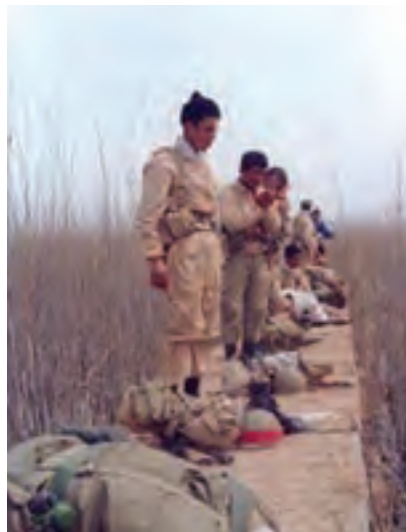
شکل ۱۳-۱- عکس خبری از دفاع مقدس