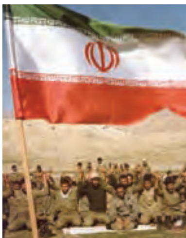
شکل ۱-۸- عکس خبری