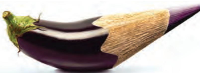
شکل ۱-۲۳- تبلیغ مدادرنگی با تأکید بر رنگ‌های طبیعی گیاهی