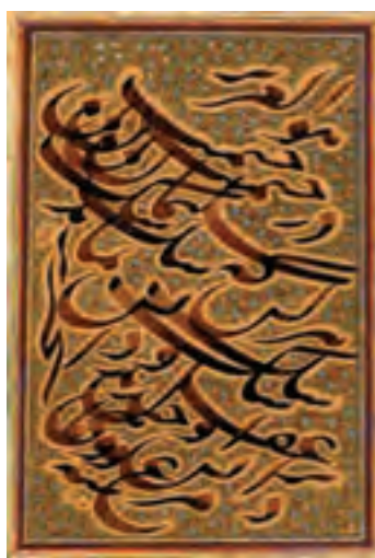
شکل ۱۶-۱- خوش نویسی