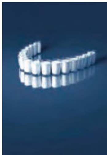
شکل ۳۵-۱- تبلیغ شیر با تأکید بر محافظت و استحکام دندانها

طراحان صنعتی در طراحی انواع وسایل کاربردی زندگی روزمره (مانند صندلی، ابزار کار، وسایل صنعتی، خودروها و...) توجه ویژه‌ای به طراحی بر اساس بیونیک (طبیعت‌الگو) دارند.