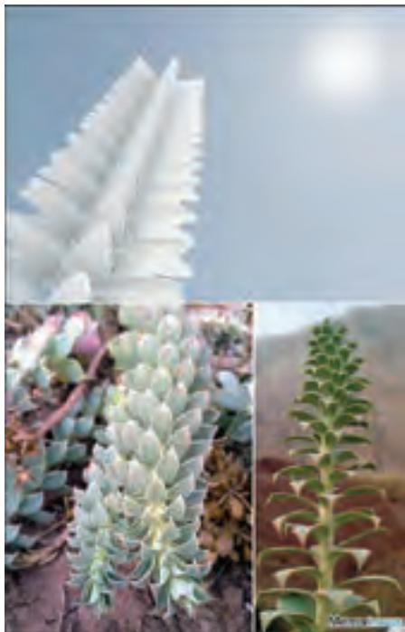
شکل ۳۴-۱- یک سازه معماری با الهام از شکل یک گیاه