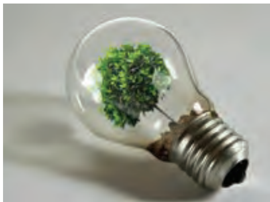
شکل ۱۹-۱- تصویر با موضوع انرژی‌های پاک

همچنین «بیودیزاین» نوعی از طراحی است که بر مبنای واقعیت‌های موجودات زنده در طبیعت صورت می‌گیرد. این الگوبرداری‌ها از طبیعت و موجودات آن زمینه گسترده‌ای را برای آفرینش‌های هنری در آثار هنرمندان در شاخه‌های گوناگون هنر پدید آورده است، علاوه بر آن، این گونه الگوبرداری از طبیعت، سبب می‌شود که نوع نگاه به طبیعت عمیق‌تر و دقیق‌تر شود و تمرین بسیار مؤثری است برای خوب دیدن و دقیق شدن در جلوه‌های آفرینش. در الگوبرداری از طبیعت، می‌توان آثار خلاقانه و ابتکاری را با محصولات گرافیکی طراحی کرد که سبب جلب توجه بیشتر محصول و یا کاربردی‌تر شدن آن در زندگی روزمره باشد.