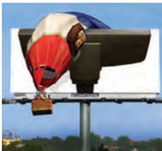
شکل ۱-۷- بیلبورد