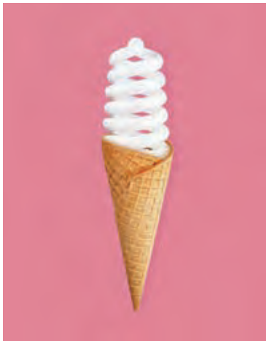
شکل ۳۱- تصویر با موضوع لامپ‌های بدون حرارت