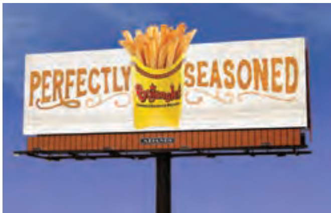
شکل ۱۲-۱- بیلبرد

اکنون بار دیگر به نمونه‌های تصویری از همان نوع نگاه کنید و دربارهٔ هر یک در کلاس گفت‌وگو کنید.