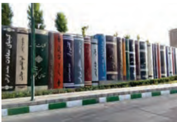
شکل ۱-۹- گرافیک محیطی