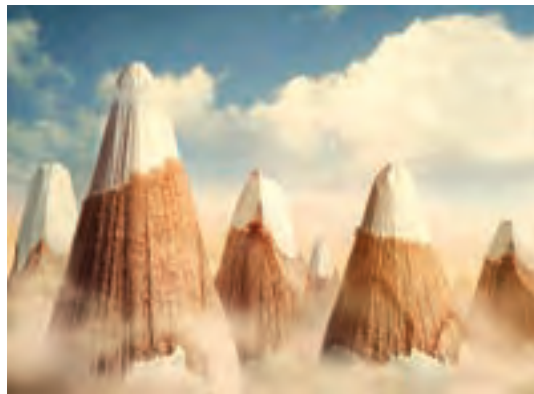
شکل ۲۴-۱- تبلیغ مدادرنگی با شبیه‌سازی به قلّه‌های پوشیده از برف