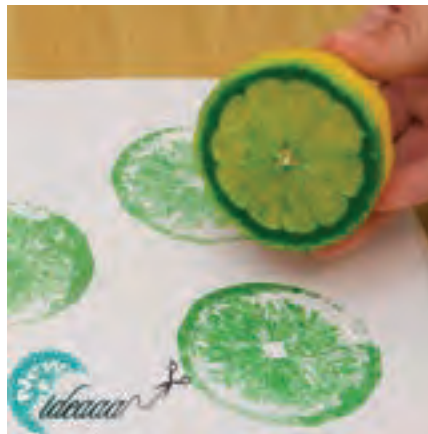
شکل ۲۶-۱- چاپ مستقیم با برش میوه