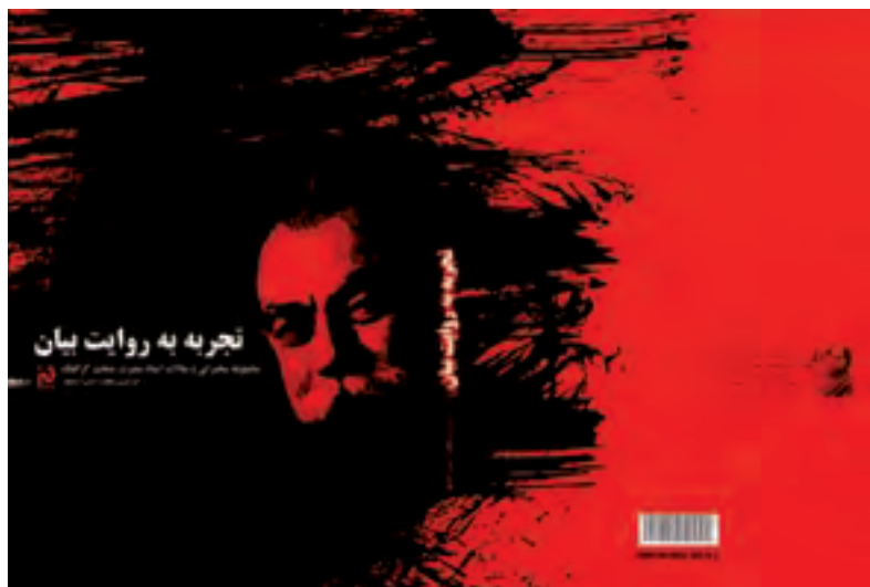
شکل ۱۸-۱- جلد کتاب