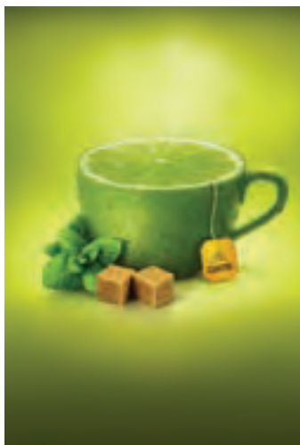
شکل ۲۷-۱- تبلیغ چای لیمو با بهره‌گیری از شکل طبیعی میوه