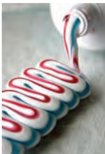
شکل ۱۷-۱- عکس تبلیغاتی