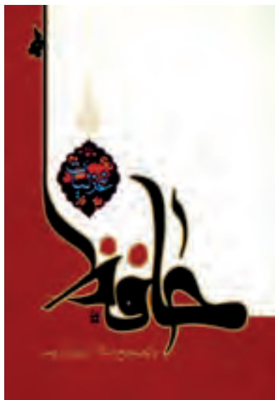
شکل ۱-۱- جلد کتاب