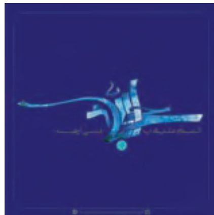
شکل ۱۱-۱- تایپوگرافی