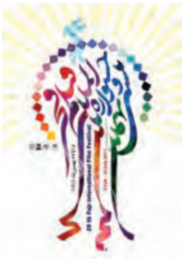
شکل ۱۴-۱- پوستر جشنواره فیلم فجر