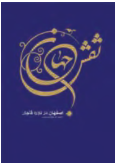
شکل ۱-۴- پوستر