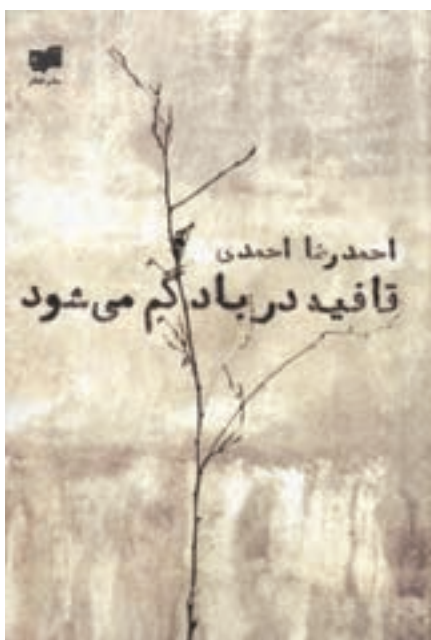
شکل ۵-۸- جلد کتاب

به نمونه تصاویر زیر نگاه کنید و جدول را مانند نمونه داده شده، کامل کنید.