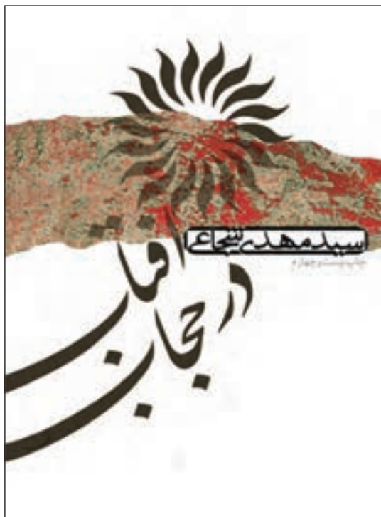
شکل ۳-۵- جلد کتاب