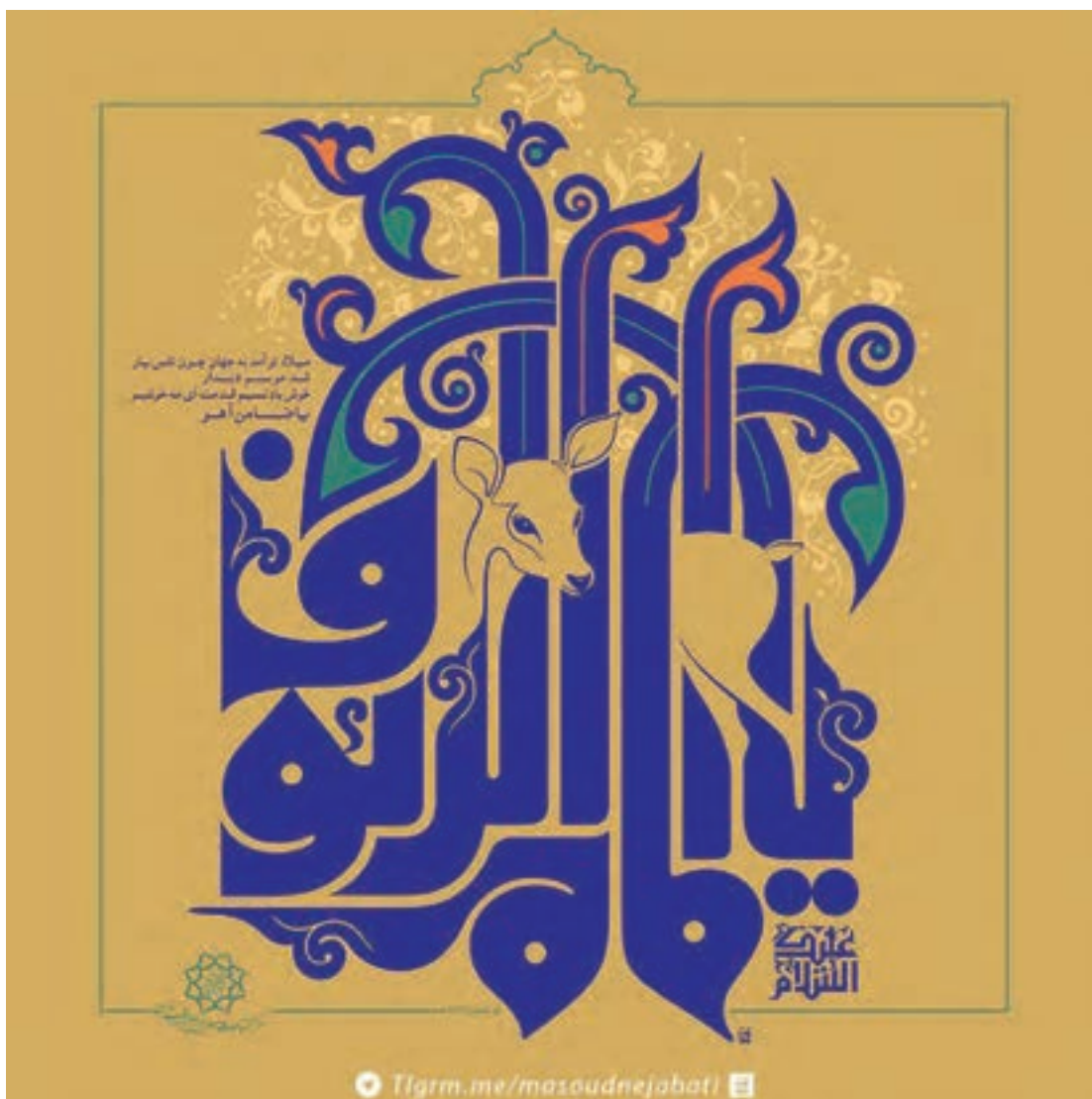
شکل ۱۹-۵- عنوان: «یا امام الرئوف»، اثر: مسعود نجابتی، برای میلاد حضرت امام رضا (علیه السلام) ضامن آهو