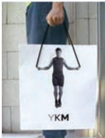
شکل ۵-۶- طراحی کیف دستی