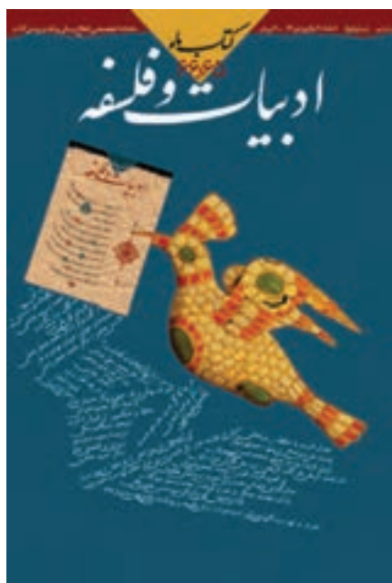
شکل ۵-۷- جلد مجله