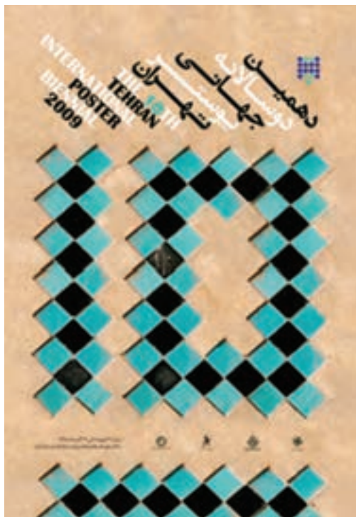
شکل ۲-۵- پوستر دوسالانه جهانی پوستر

از روش‌های مذاکره بین طراحان و سفارش‌دهندگان، تهیه چارت یا جدول است که به آن دستورکار مشتری ۱ می‌گویند. در این روش مذاکره، نکات کلیدی موردنظر مشتری یا سفارش‌دهنده و توضیح درباره ویژگی‌های مهم محصول، شیوه‌های تبلیغاتی مرتبط با آن؛ ویژگی مخاطبین اصل محصول، شیوه مصرف و میزان آن، اهداف اصلی ارتباطی - تبلیغاتی، زمان‌بندی و هزینه‌های هر مرحله کاری، و نوع محصول گرافیکی مناسب با سفارش و مواردی مانند آن تعیین می‌شود. طراحان گرافیک معمولاً برای رسیدن به نقاط مشترک تأمین‌کننده نظر سفارش‌دهنده و چهارچوب‌ها و اصول حرفه‌ای خود در یک فرایند کاری تلاش می‌کنند.