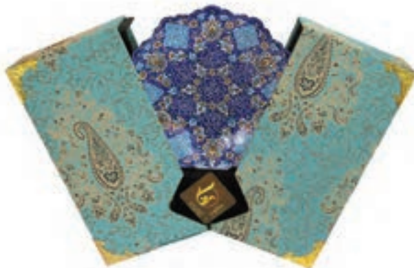
شکل ۴-۵- طراحی جعبه برای صنایع دستی

از روش‌های مذاکره بین طراحان و سفارش‌دهندگان، تهیه چارت یا جدول است که به آن دستورکار مشتری ۱ می‌گویند. در این روش مذاکره، نکات کلیدی موردنظر مشتری یا سفارش‌دهنده و توضیح درباره ویژگی‌های مهم محصول، شیوه‌های تبلیغاتی مرتبط با آن؛ ویژگی مخاطبین اصل محصول، شیوه مصرف و میزان آن، اهداف اصلی ارتباطی - تبلیغاتی، زمان‌بندی و هزینه‌های هر مرحله کاری، و نوع محصول گرافیکی مناسب با سفارش و مواردی مانند آن تعیین می‌شود. طراحان گرافیک معمولاً برای رسیدن به نقاط مشترک تأمین‌کننده نظر سفارش‌دهنده و چهارچوب‌ها و اصول حرفه‌ای خود در یک فرایند کاری تلاش می‌کنند.