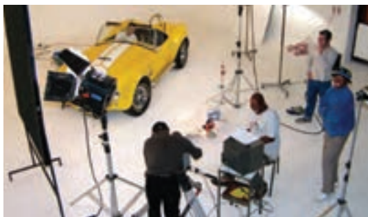
شکل ۵-۲۰- تصویر یک استودیو با سیم‌ها و کابل‌های روی زمین (احتمال بروز حوادث)