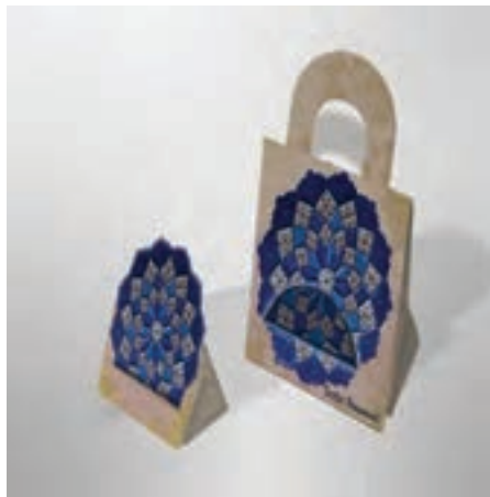
شکل ۵-۵- طراحی کیف دستی و پایه نگهدارنده برای صنایع دستی

به نظر شما در کدام یک از مراحل مذاکره، سفارش دهنده می‌تواند در نوع طراحی محصول مداخله کند و نظر دهد.