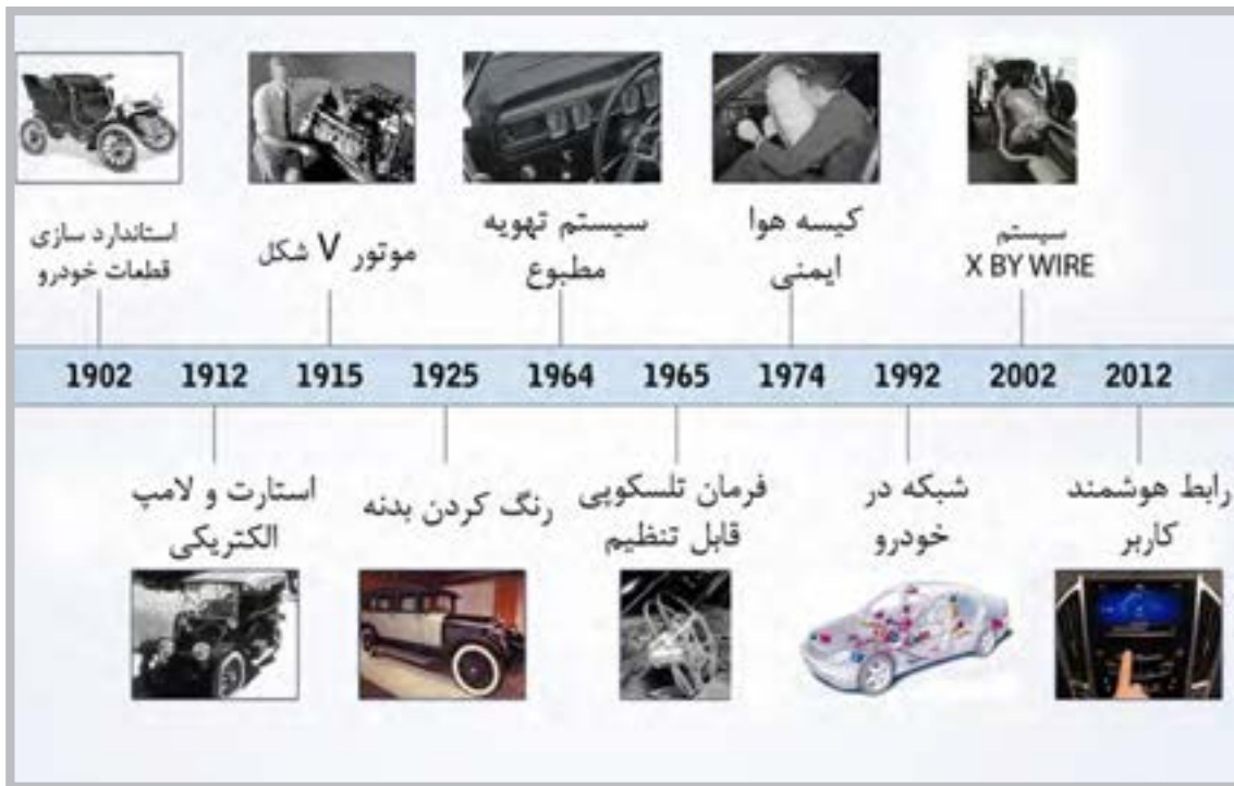
شکل ۱-۱ روند تکامل خودرو

یک خودرو معمولاً از چندین هزار قطعه که در ارتباط با یکدیگرند تشکیل شده است تا اهداف اصلی از تولید خودرو محقق شود. این تعداد قطعات به مرور زمان افزایش یافته است. اگرچه در ابتدا هدف از به کارگیری خودرو بیشتر ایجاد حرکت و جابه‌جایی بود اما با گذشت زمان و افزایش سطح توقعات از خودرو، امکانات و وظایف دیگری نیز برای خودرو در نظر گرفته شده است. معمولاً ساخت یک خودرو به جز ایجاد حرکت و جابه‌جایی، به‌منظور تأمین اهداف مختلفی مانند افزایش راحتی و ایمنی سرنشین صورت می‌پذیرد. شکل ۱-۱ سیر تکاملی خودروهای سواری را نشان می‌دهد.