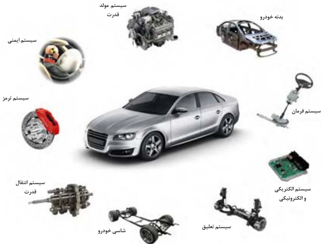
شکل ۱-۲- سیستم‌های مختلف خودرو

امروزه یک خودرو علاوه بر ایجاد حرکت، باید دارای ویژگی‌هایی از قبیل ایمنی، پایداری، راحتی، کاهش آلاینده‌های زیست‌محیطی و میزان مصرف سوخت، تولید توان بالاتر، زیبایی ظاهری و نظایر آنها باشد. تأمین این ویژگی‌ها به طراحی بخش‌های مختلف برای خودرو نیازمند است.