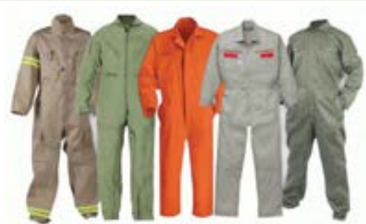
شکل ۱-۳- لباس کار

استفاده از تجهیزات ایمنی فردی در محیط کارگاهی الزامی است.