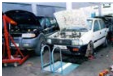
فضای کارگاهی نامناسب