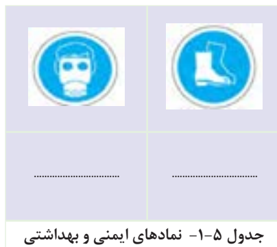
جدول ۵-۱- نمادهای ایمنی و بهداشتی

جدول ۵-۱ نمونه‌هایی از تجهیزات ایمنی کار را نشان می‌دهد.