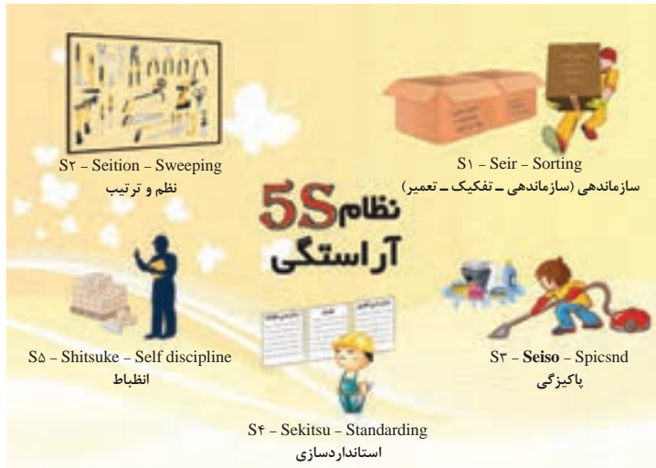
شکل ۶-۱- نظام آراستگی

نظام آراستگی که نخستین بار توسط ژاپنی‌ها به اجرا درآمد در محیط کار منجر به پیشگیری از حوادث و افزایش بهره‌وری می‌گردد.