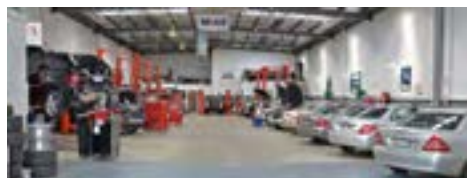
فضای کارگاهی مناسب

کدام یک از دو فضای کارگاهی نشان داده شده در شکل ۱-۴ به عنوان محیط تعمیرگاهی مناسب‌تر است؟