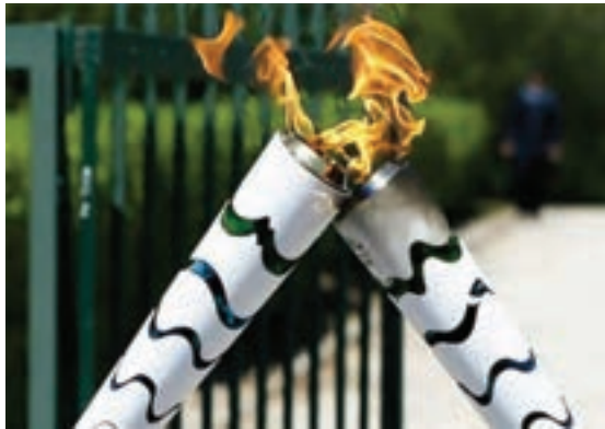
شکل ۲۰-۱- مشعل المپیک