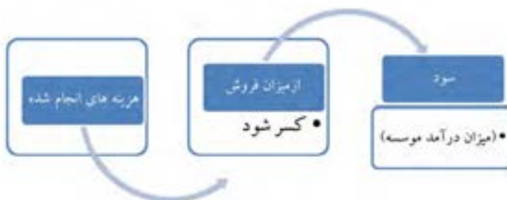
عوامل تعیین کننده سود و زیان یک مؤسسه در حالت کلی

در هر منطقه با توجه به شرایط خاص آب و هوایی، منابع آبی قابل دسترس و نوع خاک، اقدام به کشت گیاهان خاصی می شود. یک نهال کار حرفه ای باید اطلاعات جامع و کاملی از نوع درختان و ارقام مورد کشت و کار منطقه داشته باشد. در ضمن از ارقام و انواع جدید تازه معرفی شده به بازار نیز باید آگاه باشد تا بتواند در کوتاه ترین زمان ممکن نسبت به تکثیر و معرفی آن به بازار اقدام نماید. در بیشتر مناطق، نهال کارانی که توان تکثیر سریع ارقام مورد نیاز بازار را دارند منافع اقتصادی بالایی را به دست می آورند و ضمن کسب درآمد، در سطح منطقه به عنوان تولیدکننده موفق نیز شناخته می شوند.