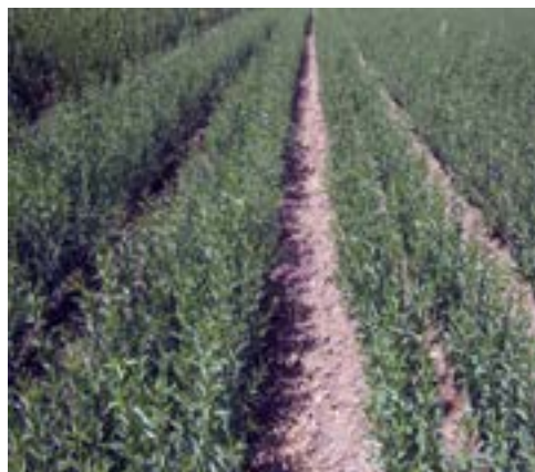
نهالستان بادام، هلو و شلیل