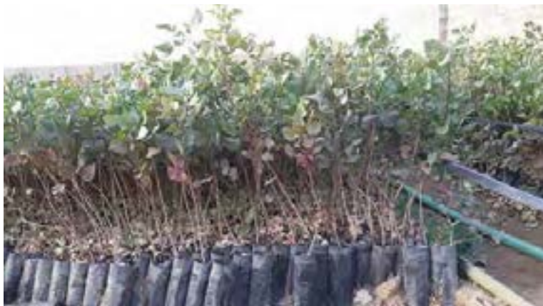
نهال‌های یکساله بذری پسته تهیه شده در داخل کیسه

نهال: درخت جوانی است که در مرحله قبل از تولید میوه قرار داشته و به وسیله یکی از روش‌های جنسی و یا غیر جنسی تکثیر می‌شود.