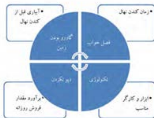
عوامل مؤثر در افزایش کیفیت نهال‌ها در زمان کندن نهال از خزانه

سومین عامل مهم، استفاده از ابزار مناسب و کارگر ماهر برای خارج کردن نهال از زمین است. با توجه به اینکه در نهالستان‌ها برای خرید محدود روزانه نیازی به استفاده از ماشین‌آلات نیست، معمولاً برای انجام این کار از بیل‌های مخصوص استفاده می‌شود. برای این کار ابتدا تا حدی که ریشه نهال اجازه می‌دهد، خاک اطراف آن را برداشته و در نهایت با یک بیل عمیق، تمامی محدوده ریشه با خاک آن برداشته می‌شود.