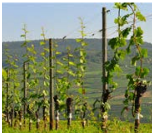
سمت راست انگورهای پیوندی کشت شده و سمت چپ یک نهالستان پیشرفته انگور