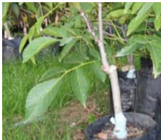
سمت راست گردوی پیوندی یکساله و سمت چپ نهال های بذری سوزنی برگ ها