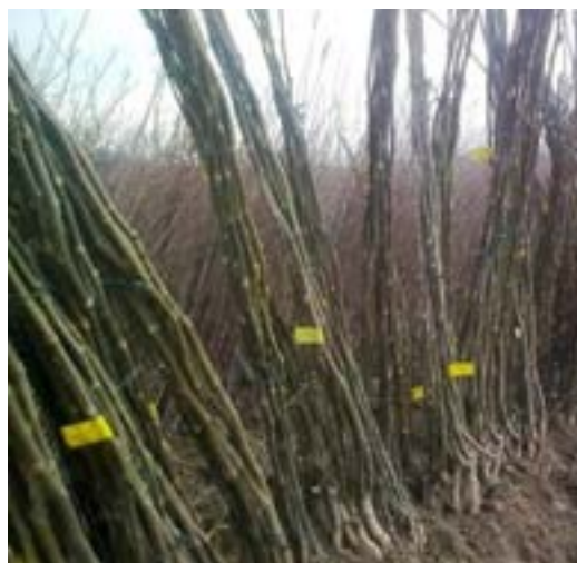
سمت راست نهال‌های کنده شده برچسب‌دار و سمت چپ نهال‌های برچسب‌دار در خزانه