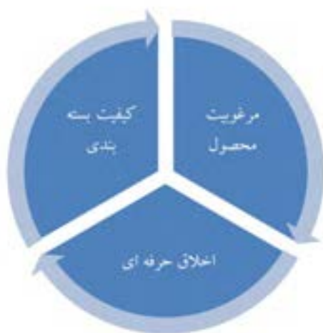
عوامل مؤثر در رضایتمندی مشتری

در هر کدام از حالات فوق، یک نهال فروش حرفه ای نصب برچسب و مشخص نمودن نهال های قابل فروش را قبل از خارج کردن نهال از خزانه انجام می دهد. بنابراین در زمان بسته بندی، بارگیری و فروش، مشکلات زیادی نخواهد داشت. در حالت کلی بهتر است قبل از خارج کردن نهال از زمین، برچسب ضد آب مخصوص را که حاوی اطلاعات مربوط به نوع رقم، نوع پایه، نوع پیوندک و... می باشد تهیه و بر روی ساقه، مقداری بالاتر از محل یقه نصب نمود.