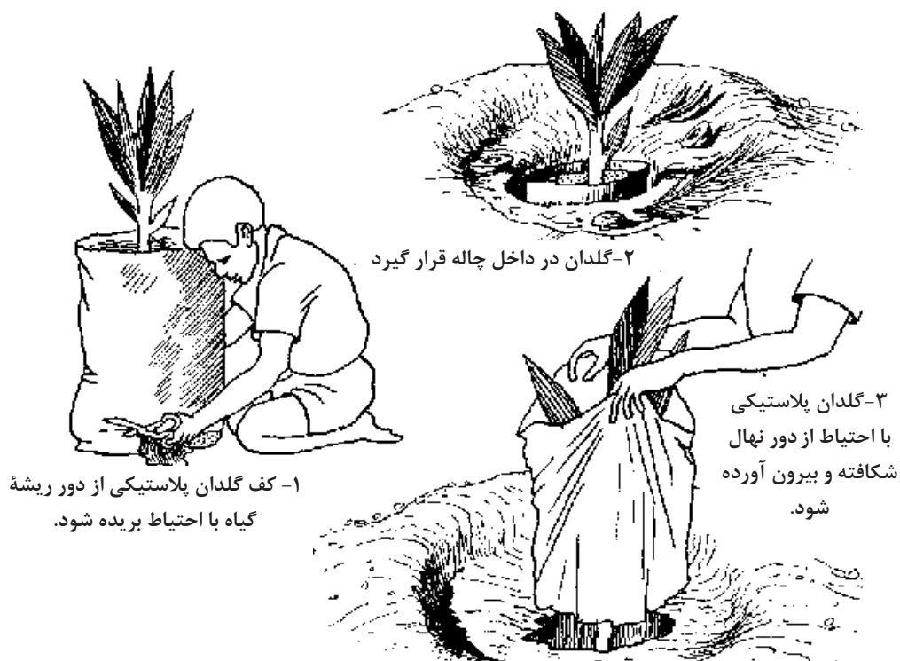
شرایط انتقال نهال‌های حساس گلدانی به چاله کاشت

سپس این نهال‌ها تا زمان انتقال باید در انبار و یا در محلی سایه گذاشته شده و ریشه‌ها نیز در داخل گودالی ۳۰ تا ۵۰ سانتی متری قرار گیرد. در کشورهای پیشرفته نهال‌ها را در سردخانه‌هایی با دمای حدود ۲ درجه و رطوبت ۹۵ درصد و تا زمان فروش نگهداری می‌نمایند. ضمن اینکه این نکته را باید در نظر گرفت که در انتقال نهال به مناطق دور دست باید مجوزهای لازم را از مدیریت حفظ نباتات محل فروش نهال مبنی بر دارا بودن سلامت کامل نهال‌ها از لحاظ آفات و بیماری‌های شایع تهیه نمود.