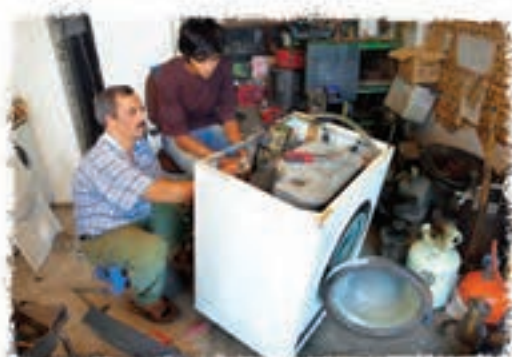
تعمیر کار لوازم برقی