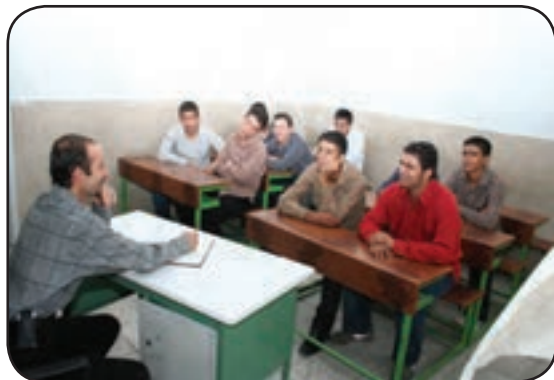
دقت کردن به درس

با توجه به عبارتهای سمت راست، برای تصویرهای سمت چپ، مانند نمونه یک عبارت بنویسید.