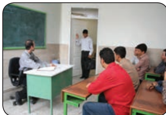
دیر رسیدن به مدرسه