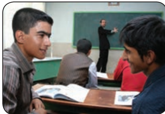
توجه نکردن به درس