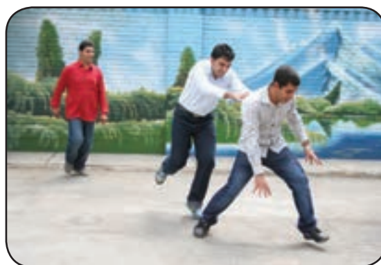
رفتار نامناسب در حیاط مدرسه