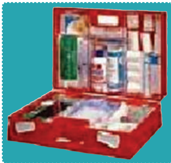
جعبه کمک‌های اولیه