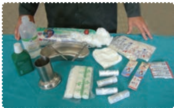
وسایل مورد نیاز در جعبه‌ی کمک‌های اولیه

در حرفه‌های گوناگون استفاده از ابزارها و مواد اولیه همواره می‌تواند برای افراد خطرهایی به وجود بیاورد. استفاده‌ی صحیح و داشتن دقت فراوان هنگام کار، این خطرها را از بین برده و فرد در امان خواهد بود. به همین دلیل لازم است در محیط کارگاه برای جلوگیری از خطرهایی احتمالی به موارد زیر دقت داشته باشید. ۱- در مواقع ضروری از جعبه کمک‌های اولیه‌ی کارگاه استفاده کنید.