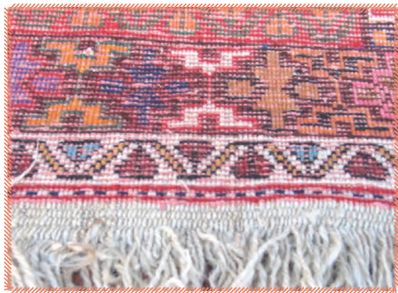
پشت قالی دستباف

امروزه با پیشرفت علم، قالی به کمک ماشین بافته می شود که به آن «قالی ماشینی» می گویند.