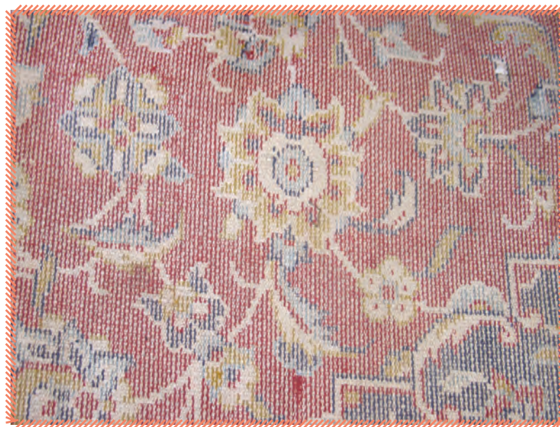
پشت قالی ماشینی

امروزه با پیشرفت علم، قالی به کمک ماشین بافته می شود که به آن «قالی ماشینی» می گویند.