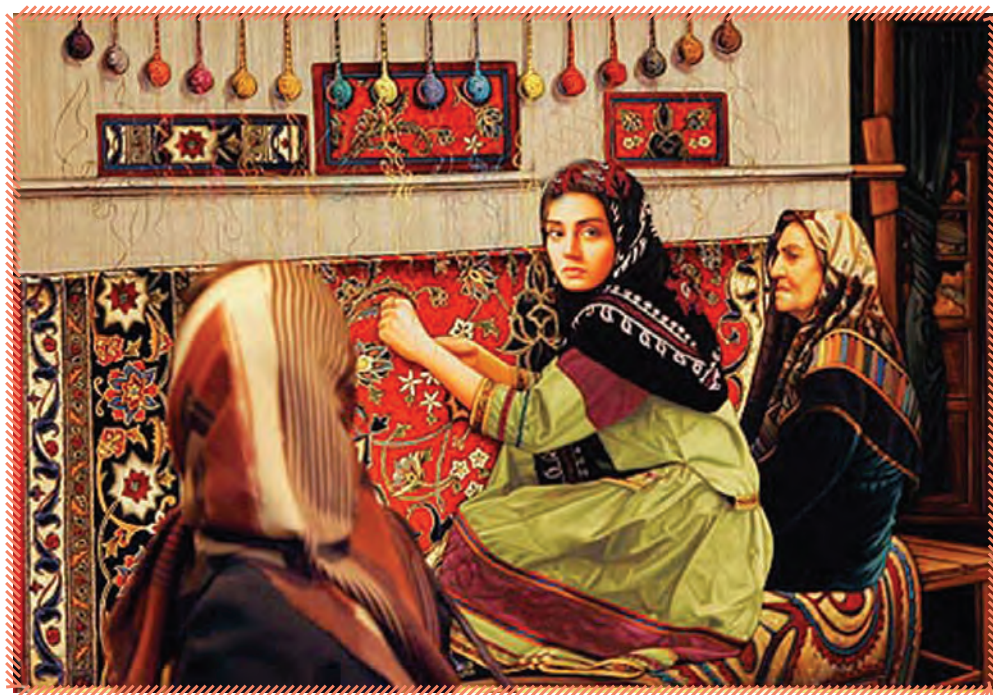
۱- بافنده‌ی فرش در کارگاه خوداشتغالی

همان‌گونه که در صفحه‌ی قبل مطالعه کردید صنعت فرش در ایران ظرفیت بالایی برای ایجاد شغل دارد. شما در این درس با برخی مشاغل این صنعت آشنا می‌شوید.