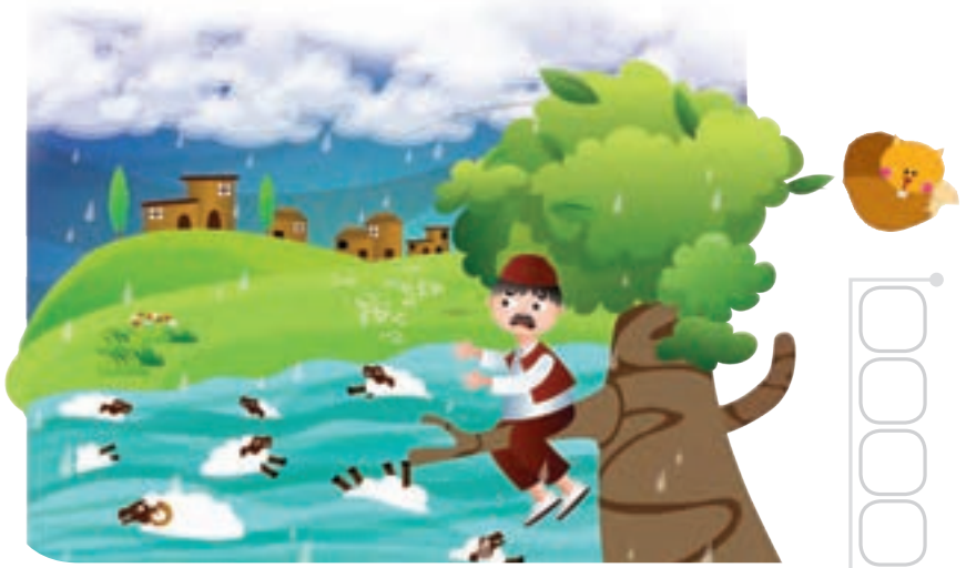
دست درد نکند!