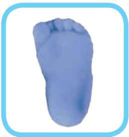
کف پای من

من امروز به دنیا پا گذاختم، در حالی که گریه می کردم. خانم پرستار پایم را گرفت، جوهری کرد و روی یک کاغذ فشار داد تا با نوزاد دیگری عوض نشوم. پرستار هم دور دستم یک نوار بست که روی آن نوشته بود: