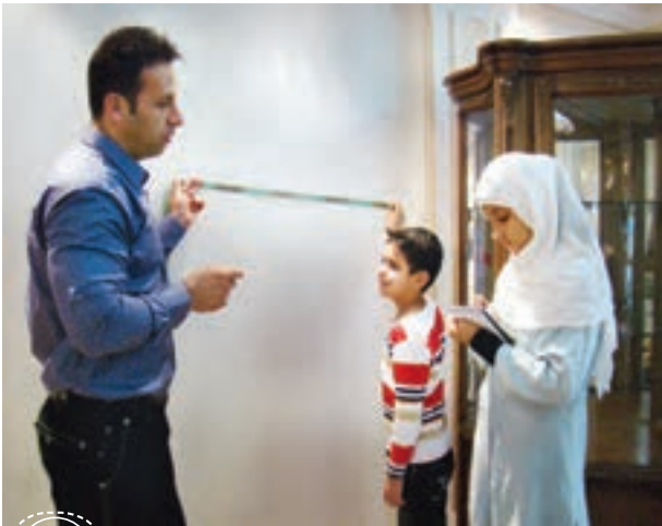
تفریح و سرگرمی