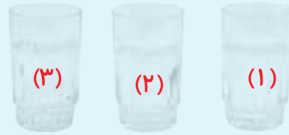
سرد نیم گرم گرم

۱- سه لیوان بردارید و آنها را شماره گذاری کنید. ۲- درون لیوان ها به ترتیب شماره تا نیمه آب سرد، آب نیم گرم و آب گرم بریزید.