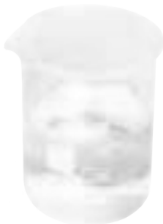
آب نیم گرم