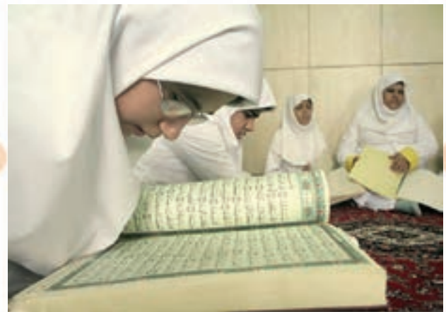
انس با قرآن کریم در مدارس استثنایی