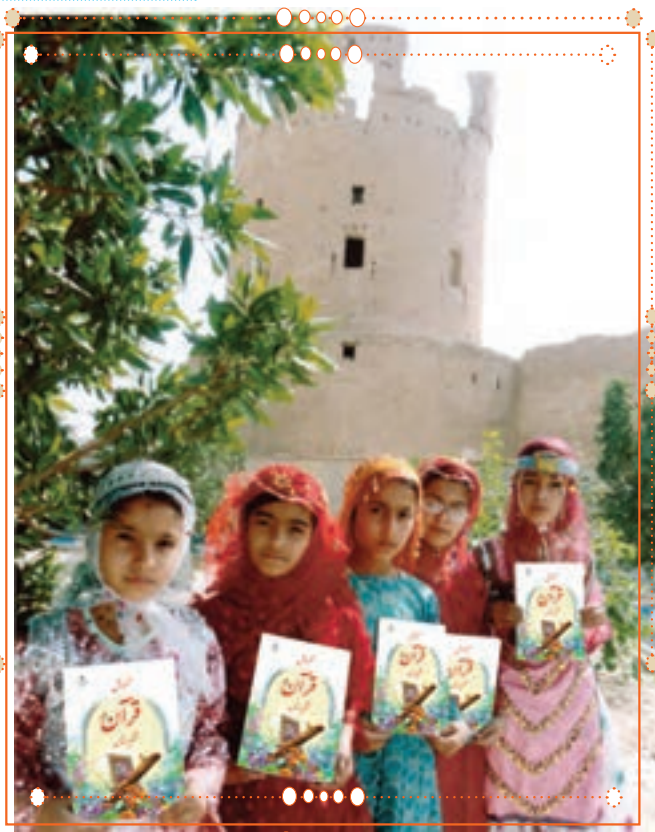
انسان با قرآن کریم در استان هرمزگان