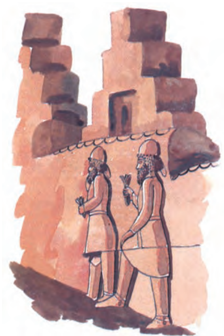
تخت جمشید در اطراف شهر شیراز

باغ ارم رفتند. بوی عطر گل‌ها و شکوفه‌های نارنج همه جا را پر کرده بود.