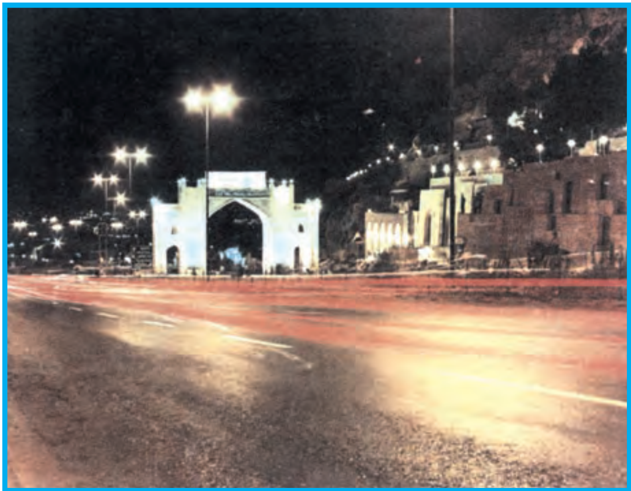
دروازه قرآن در شیراز