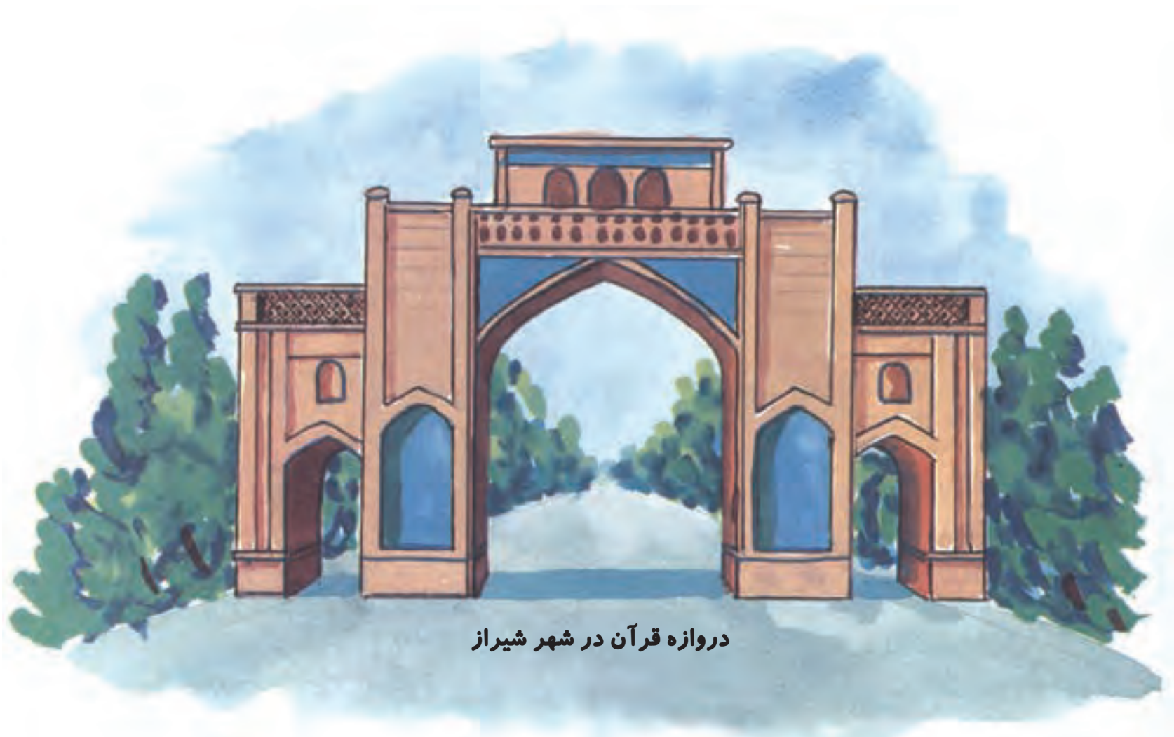
دروازه قرآن در شهر شیراز

هوا تاریک شده بود. پدر به بچه‌ها گفت تا نیم ساعت دیگر به شیراز می‌رسیم. در نزدیکی شهر شیراز چراغ‌های رنگی زیبایی دیدیم. کم‌کم دروازه قرآن از دور پیدا شد. مادر گفت: دروازه قرآن یکی از آثار تاریخی شهر شیراز است.