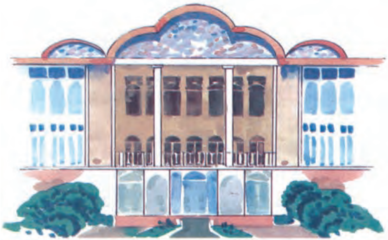
باغ ارم در شهر شیراز

مادر گفت: از این گل‌ها و شکوفه‌ها دارو و عرق‌های گیاهی تهیه می‌کنند. عرق این گل‌ها برای درمان بسیاری از بیماری‌ها مفید است. سوغات شهر شیراز، عرق گل‌ها و آب‌لیمو است.