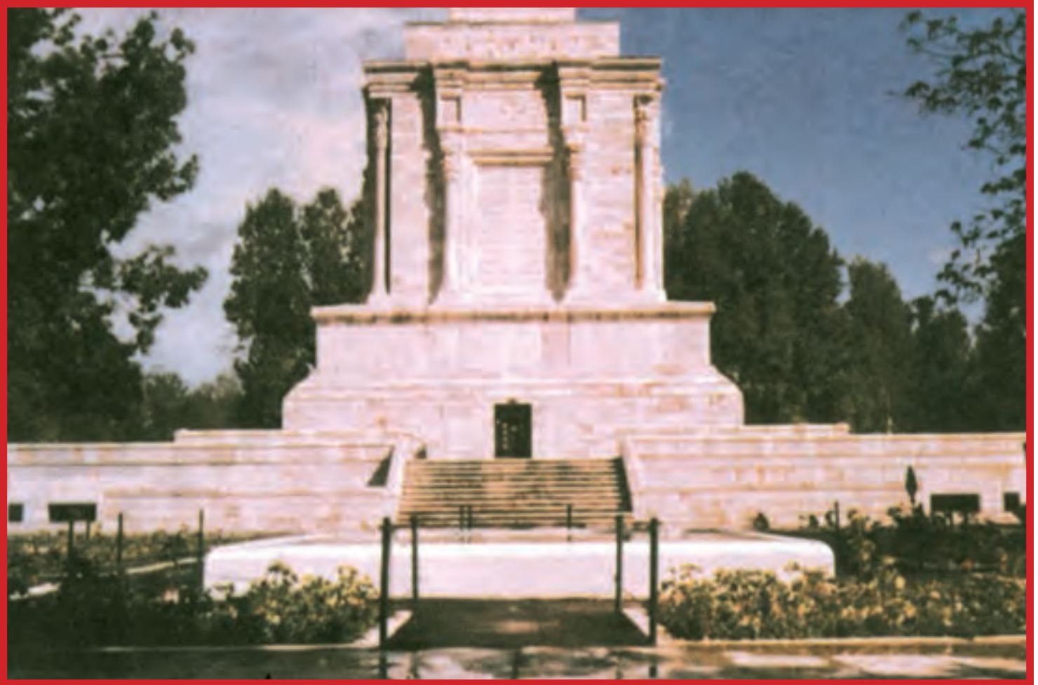
آرامگاه فردوسی در توس