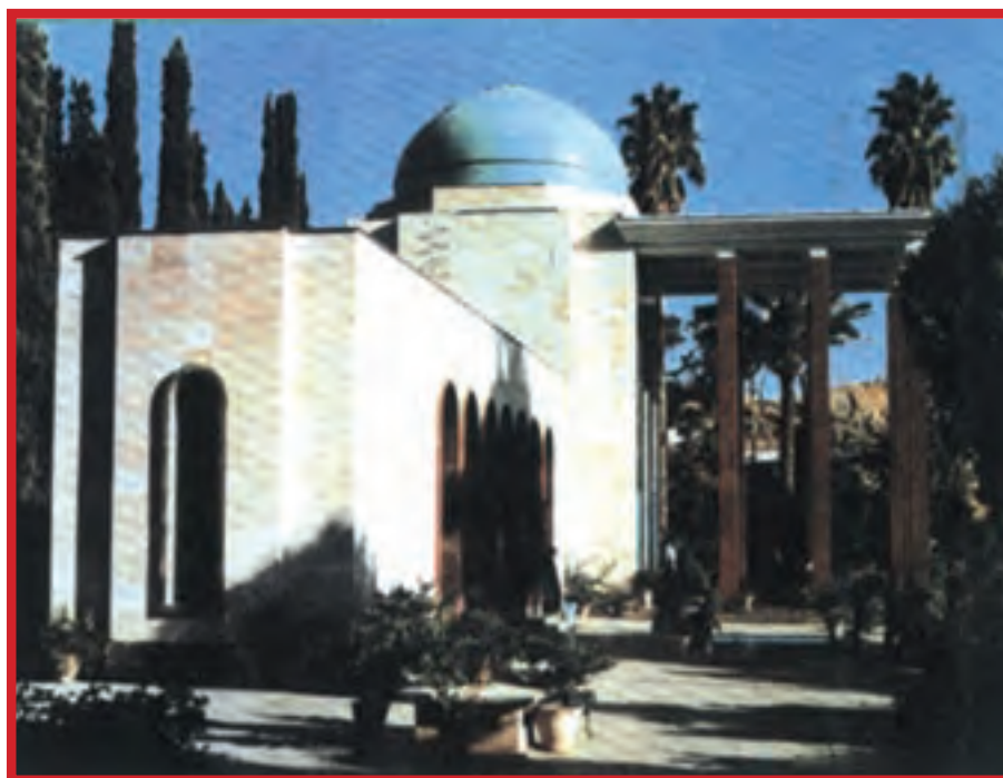
آرامگاه سعدی در شهر شیراز