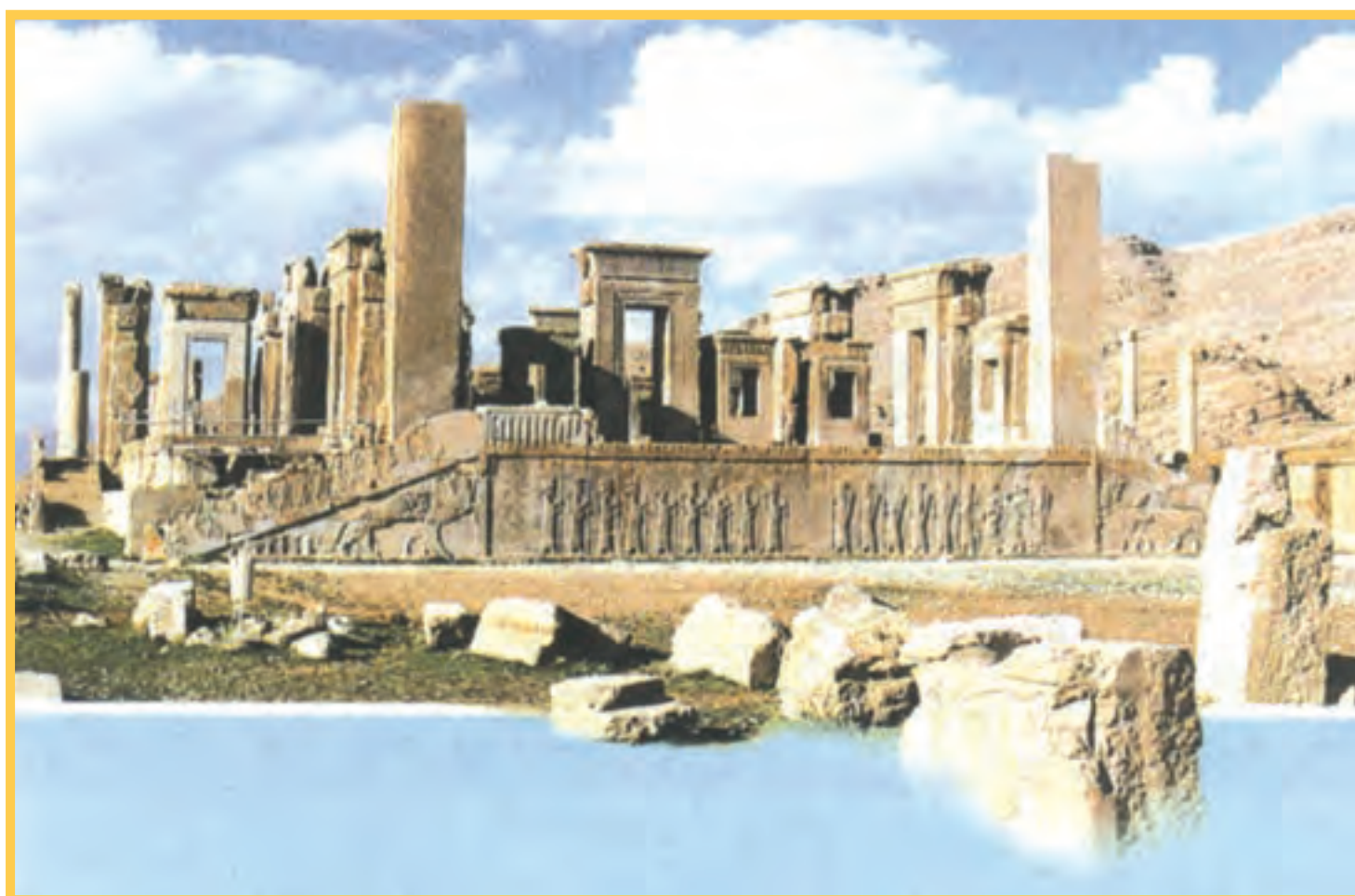
تخت جمشید در نزدیکی شهر شیراز