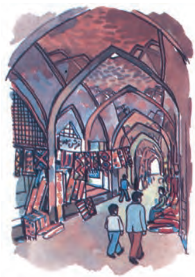
بازار وکیل در شهر شیراز

مادر گفت: از این گل‌ها و شکوفه‌ها دارو و عرق‌های گیاهی تهیه می‌کنند. عرق این گل‌ها برای درمان بسیاری از بیماری‌ها مفید است. سوغات شهر شیراز، عرق گل‌ها و آب‌لیمو است.