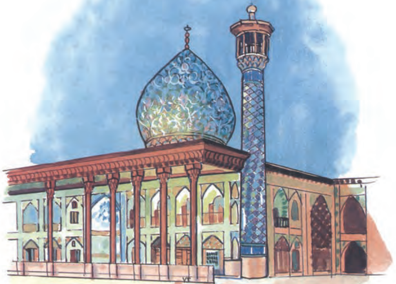
حرم شاه چراغ (ع) برادر امام رضا (ع) در شهر شیراز