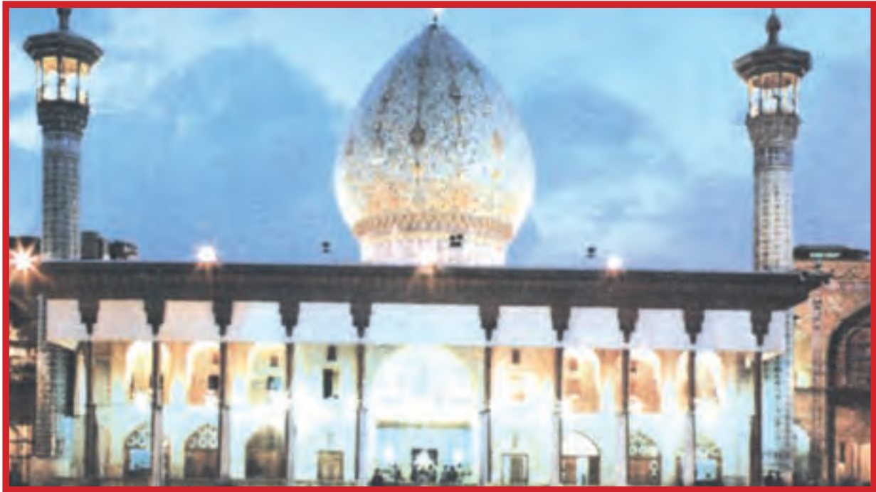
شاه چراغ در شیراز