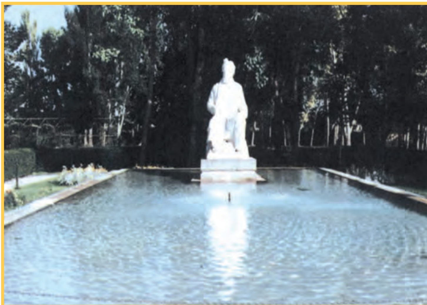
مجسمه فردوسی در طوس