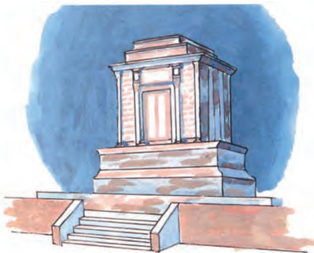
آرامگاه فردوسی، شاعر بزرگ ایران در شهر طوس