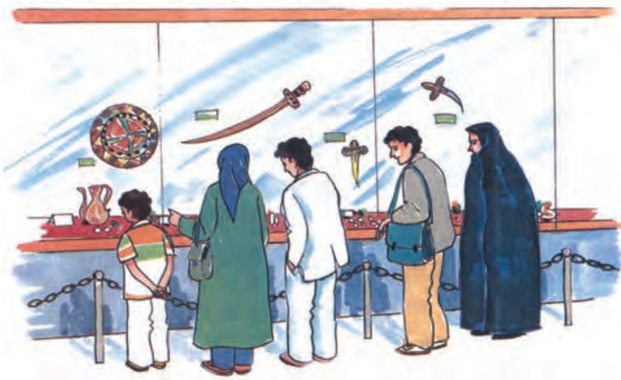
موزه‌ی امام رضا (ع) در شهر مشهد

موزه : محلّ نگهداری وسایل قدیمی، مانند سگّه، اسلحه و ظرف‌های گوناگون است.