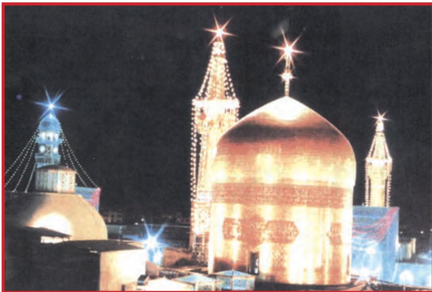
حرم امام رضا در شهر مقدس مشهد