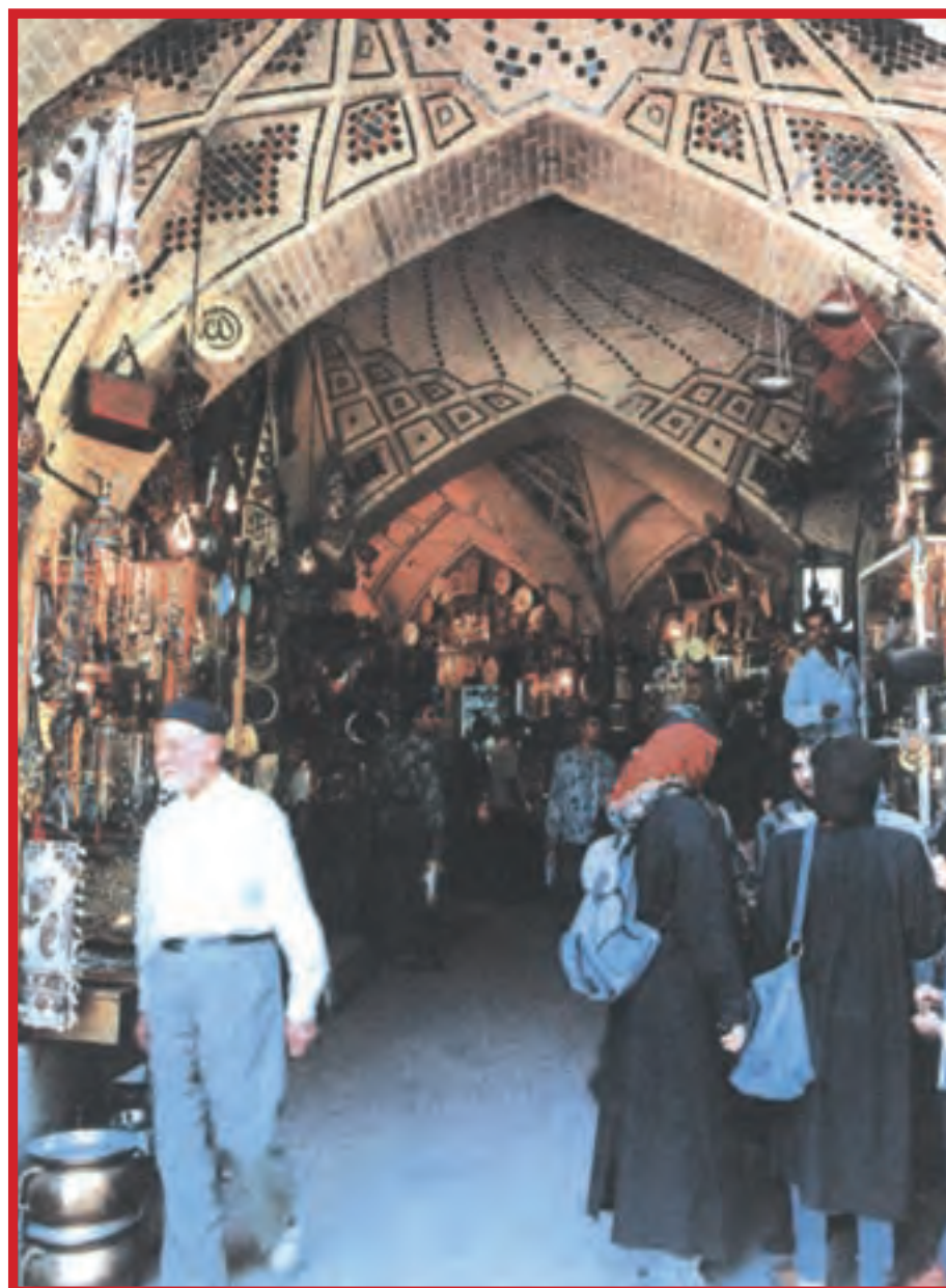
دو تصویر بالا، بازار وکیل در شهر شیراز را نشان می‌دهد.