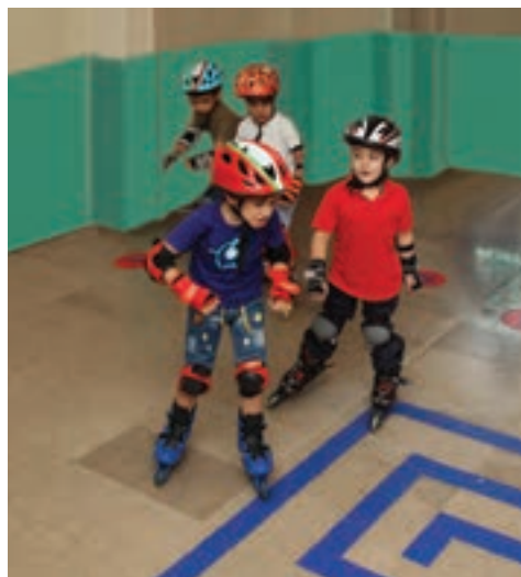
شکل ۱۲- فعالیت ورزشی

فعالیت‌های علمی: جست‌وجوگری، تجربه کردن، بودن در طبیعت و مشاهده پدیده‌های آن، کشف دنیای پیرامون خود به صورت آزاد و خلاق فعالیت‌های ورزشی: بازی‌های گروهی و انفرادی، دویدن، پریدن، توپ بازی و نظیر آنها (شکل ۱۲)