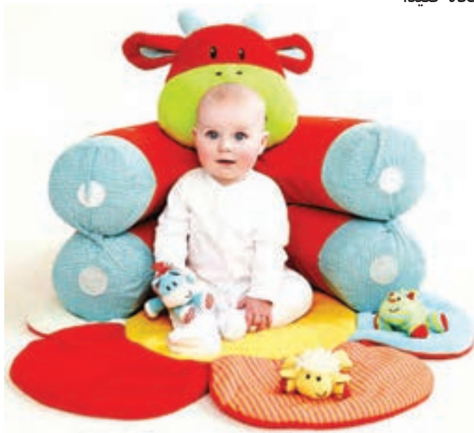
شکل ۶- کودک در حال استراحت

فعالیت ۱۰: در گروه‌های کلاسی با توجه به تصویر بالا، در مورد فعالیت‌های مناسب برای استراحت کودکان در مراکز پیش از دبستان گفت‌وگو کنید و نتیجه را در کلاس ارائه دهید.