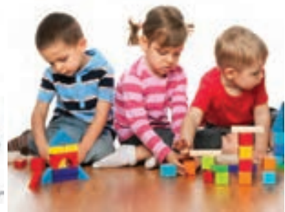
شکل ۱۰- فعالیت‌های کودکان در اوقات فراغت

فعالیت ۱۳: در گروه‌های کلاسی با توجه به تصاویر صفحه قبل در مورد تفاوت استراحت و اوقات فراغت کودکان در مراکز پیش از دبستان گفت‌وگو کنید و نتیجه را در کلاس ارائه دهید.