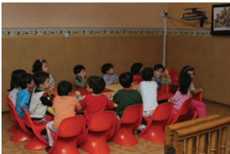
شکل ۲- کودکان در حال استراحت

تعریف استراحت: ایجاد موقعیتی که در آن کودکان احساس آرامش، آزادی، راحتی و رفع خستگی کنند. کودکان در مراکز پیش از دبستان نیاز به زمان‌هایی دارند که براساس علاقه و انتخاب خود از آن استفاده کنند. استراحت کافی به شاداب بودن و فراگیری بیشتر کودکان کمک می‌کند (شکل ۲).