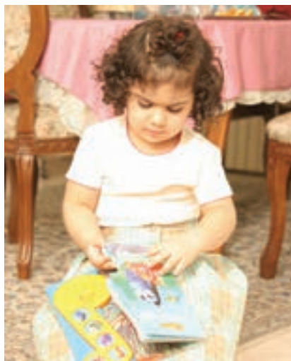
شکل ۳- فعالیت‌های فردی و گروهی کودکان