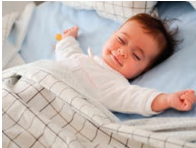
شکل ۱- محل خواب کودک

فعالیت ۱: در گروه‌های کلاسی، در مورد اهمیت ایمنی و بهداشت مکان خواب گفت‌وگو کنید و نتیجه را در کلاس ارائه دهید.