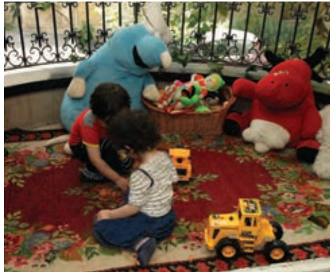
شکل ۳- مکان استراحت کودکان