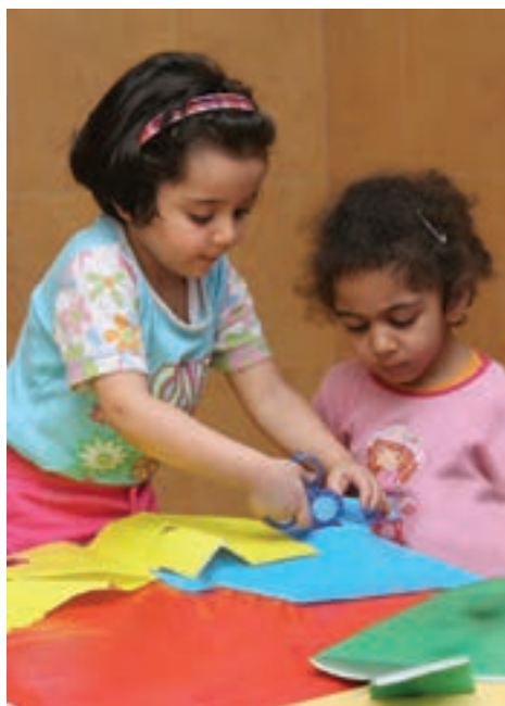
شکل ۵- مهارت‌های خودیاری کودکان