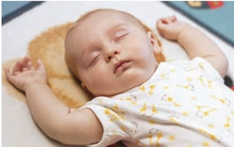
شکل ۱- خواب کودک