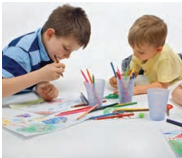
شکل ۱۱- فعالیت هنری

مهم‌ترین روش‌های مناسب برای استفاده کودکان از اوقات فراغت عبارت‌اند از: فعالیت‌های کتابخوانی ۱ : کتاب و قصه‌خوانی، تصویرخوانی و امثال آنها. فعالیت‌های هنری ۲ : نقاشی، کاردستی، موسیقی، نمایش و غیره (شکل ۱۱)