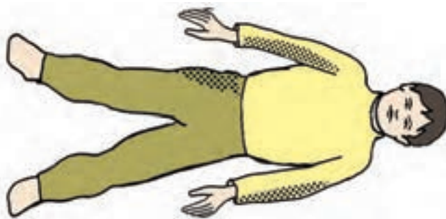
شکل ۷- وضعیت پایه

این تمرین بسیار ساده به عنوان پایه تمرینات تصویرسازی ذهنی و همچنین حرکت - آگاهی است. تن آرامی با آزادسازی تنش‌ها و چرخش آگاهی به پیام‌های (محرک‌ها) درونی، فرد را کاملاً برای خلاقیت آماده می‌نماید. وضعیت پایه: خوابیده به پشت در حالی که پاها کمی بیش از عرض شانه از هم باز هستند و دست‌ها کمی با فاصله از بدن و کف دست‌ها رو به بالا قرار می‌گیرند (شکل ۷).