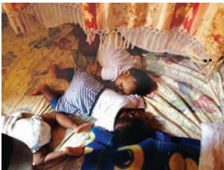
شکل ۱- شرایط نامایمن برای خواب کودکان

فعالیت ۳: در گروه‌های کلاسی با توجه به تصویر بالا، در مورد بهداشت و ایمنی مکان خواب بر روی سلامت کودکان گفت‌وگو کنید و نتیجه را در کلاس ارائه دهید.