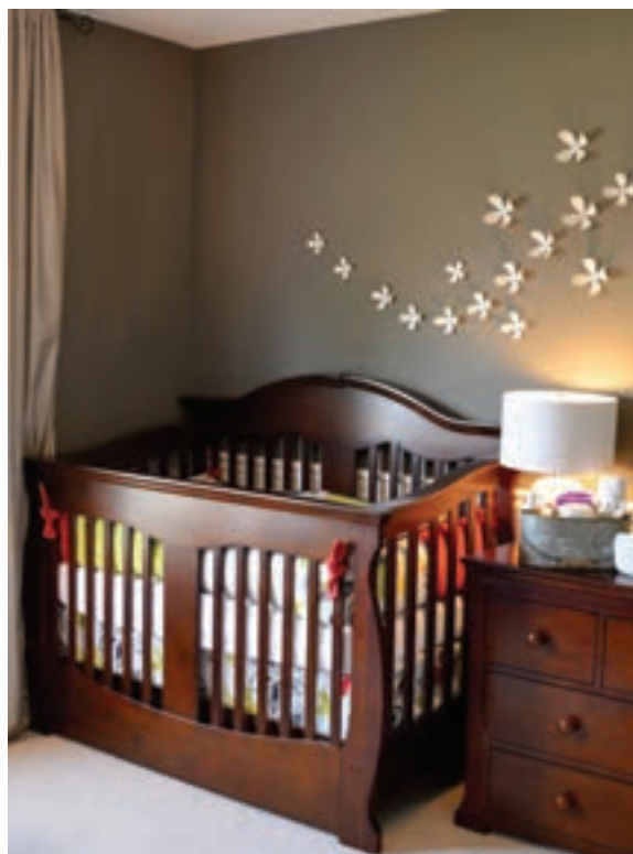
شکل ۳ - تخت کودک

خواباندن طاق‌باز نوزادان از مرگ ناگهانی نوزادان پیشگیری می‌کند. توجه شود که نسخه دستور پزشک درخصوص خواباندن نوزاد در پرونده مدارک نوزاد نگهداری شود.