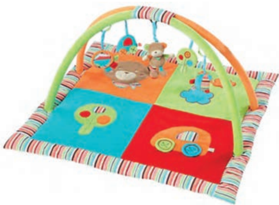
شکل ۴- وسیله‌ای برای بازی و استراحت کودکان خردسال