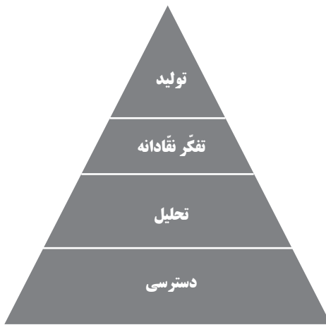
نمودار شماره ۳- سطوح دستیابی سواد رسانه‌ای

«سواد رسانه‌ای چارچوبی جهت دسترسی، تحلیل، ارزیابی و تولید پیام به اشکال مختلف از چاپ تا اینترنت را فراهم می‌کند». (تامن، ۲۰۰۵: ۱۵) این موارد را می‌توان در چهار سطح ارائه کرد (نمودار ۳).