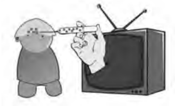
تصویر شماره ۱- مخاطب منفعل، نظریه تزریقی

صاحبان دیدگاه دوم معتقدند، اصولاً رسانه‌ها بر مخاطبان تأثیر چندانی ندارند و تأثیرات آنها بسیار محدود و ناچیز است. در این دیدگاه، مخاطب در مقابل پیام‌های رسانه‌ای از خود واکنش نشان می‌دهد و درباره‌ی چگونگی استفاده از رسانه‌ها تصمیم می‌گیرد. بر پایه این دیدگاه، مخاطب از دریافت‌کننده منفعل رسانه به مفسر فعال پیام‌های رسانه‌ای تبدیل می‌شود و تصمیم‌گیرنده اصلی مخاطب است.