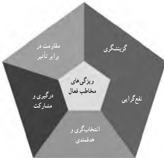
تصویر شماره ۲- ویژگی‌های مخاطب فعال

صاحبان دیدگاه دوم معتقدند، اصولاً رسانه‌ها بر مخاطبان تأثیر چندانی ندارند و تأثیرات آنها بسیار محدود و ناچیز است. در این دیدگاه، مخاطب در مقابل پیام‌های رسانه‌ای از خود واکنش نشان می‌دهد و درباره‌ی چگونگی استفاده از رسانه‌ها تصمیم می‌گیرد. بر پایه این دیدگاه، مخاطب از دریافت‌کننده منفعل رسانه به مفسر فعال پیام‌های رسانه‌ای تبدیل می‌شود و تصمیم‌گیرنده اصلی مخاطب است.