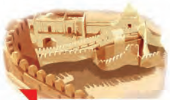
اینجا، ارگِ بَمِ کرمان است.