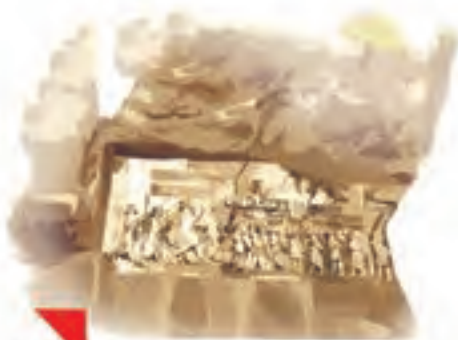
این، تصویری از بیستونِ کرمانشاه است.