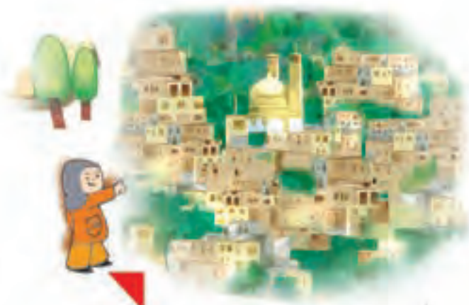
اینجا، ماسوله‌ی گیلان است.