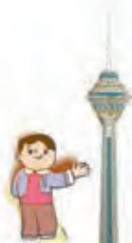
اینجا، بُرج میلاد تهران است.