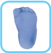
کف پای من

من امروز به دنیا پا گذاشتم، درحالی که گریه می کردم. خانم پرستار پایم را گرفت، جوهری کرد و روی یک کاغذ فشار داد تا با نوزاد دیگری عوض نشوم. پرستار هم دور دستم یک نوار بست که روی آن نوشته بود: