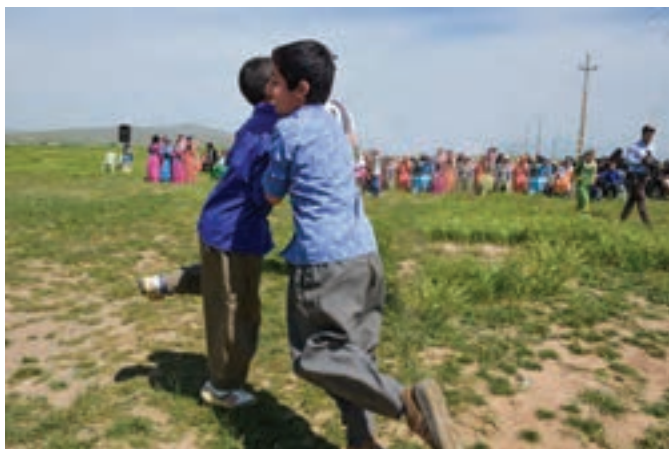
بازی‌های جنوب ایران

شرح بازی: ابتدا شرکت‌کنندگان را به دو گروه تقسیم می‌کنیم و بعد از اینکه قانون بازی را مشخص کردیم دو خط را جهت تعیین محوطه رقیبان می‌کشیم هر دو گروه در پشت خط‌ها می‌ایستند. بازی به صورت گروهی و انفرادی آغاز می‌شود. مبارزه به صورت نفر به نفر آغاز می‌شود، نفرات با یک دست یک پای خود را می‌گیرند و با هل دادن باید یکی از رقیبان به زمین بخورد نفرات بازنده و برنده شمرده می‌شوند در حین بازی نباید پنجه‌های یکدیگر را بگیرند و با سر به یکدیگر بزنند به صورت گروهی همه دو گروه می‌توانند مبارزه کنند و تعداد نفراتی که از هر گروه بیشتر باقی بمانند برنده می‌شوند. نفرات بازنده باید در فاصله‌ای معین افراد برنده را سواری می‌دهند. هدف از این بازی ایجاد محیط مساوی برای رقابت سالم، تقویت عضلات دست و پا و به وجود آمدن نشاط است.